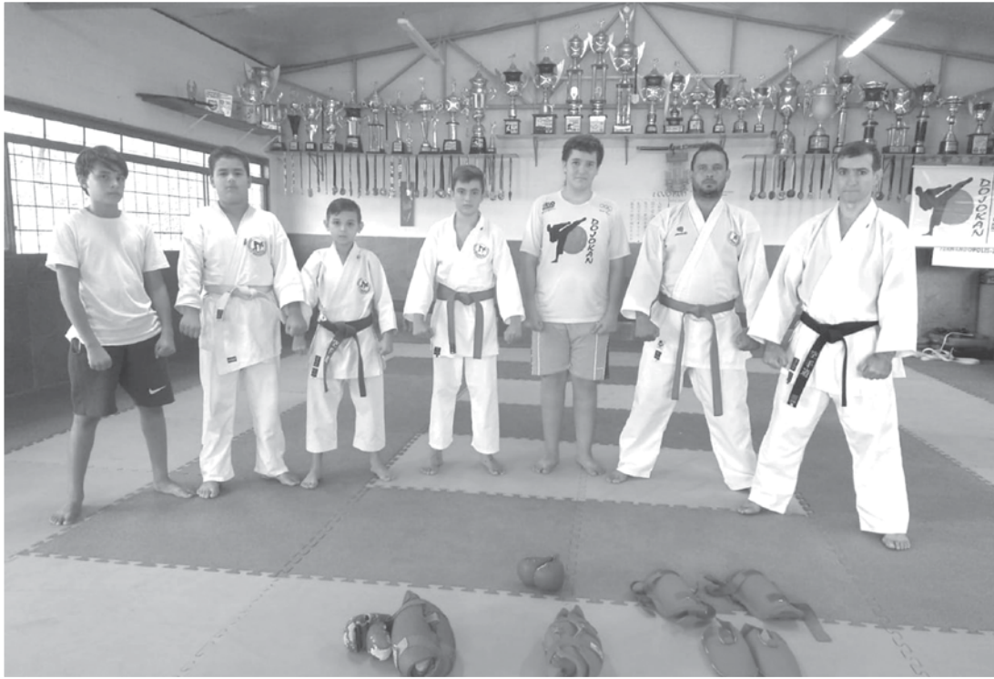
Evento é realizado pela Federação Brasileira de Karatê