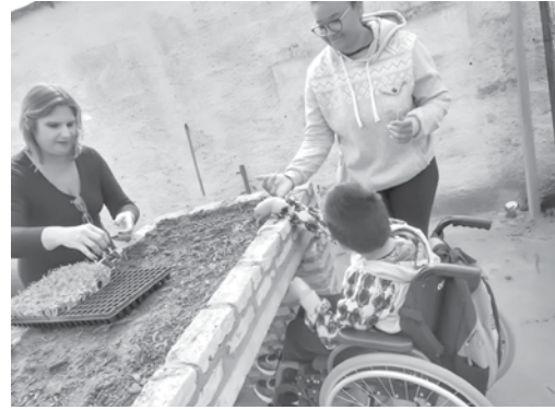
Crianças participando das plantações na horta da escola

grande importância, utilizando métodos de ensino para educação ambiental e alimentação saudável e para aplicação da interdisciplinaridade. “O desenvolvimento da horta escolar possibilita aos nossos educandos um melhor e mais proveitoso aprendizado e todos têm se empenhado muito. Para nos