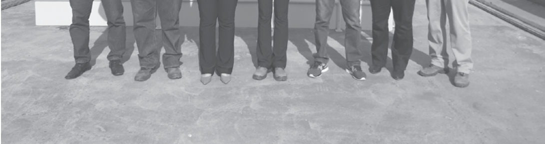
Comitiva conheceu todo o processo de geração de energia

sitaram na semana passada a Usina Hidrelétrica Salto do Rio Verdinho.