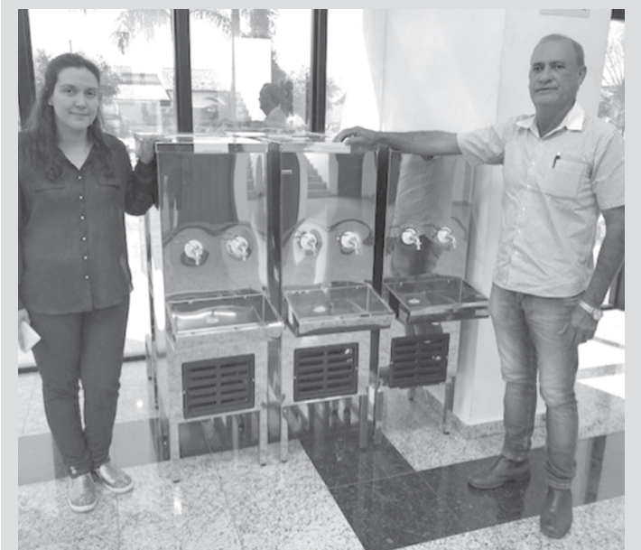
Bebedouros foram adquiridos com recursos próprios do município