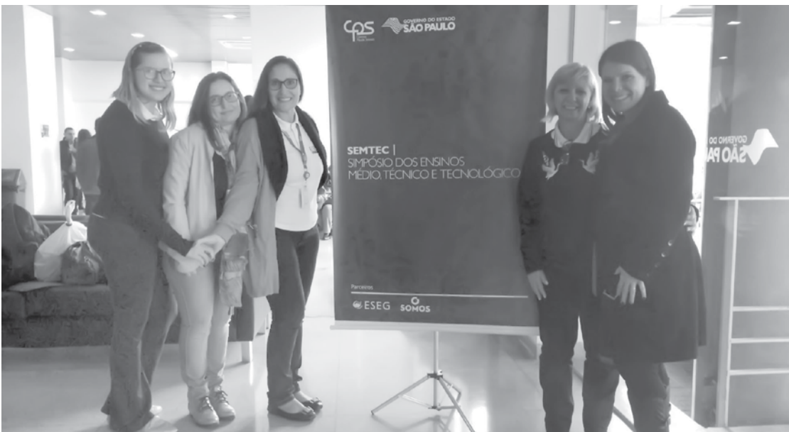
Simpósio foi realizado em São Paulo