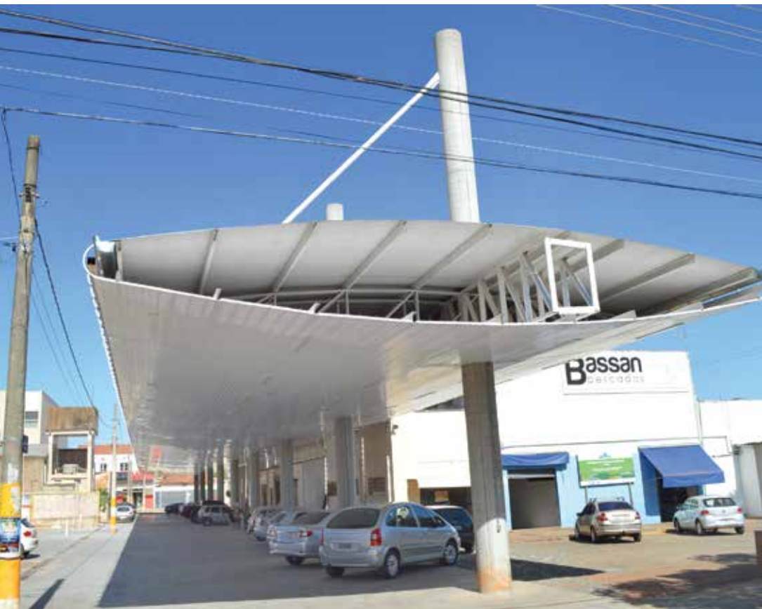
Evento acontece no final de semana, 24 e 25 de agosto, das 8 às 17h

dos empresários em promover a busca contínua por uma melhor qualidade em produtos e serviços. Este evento conta com apoio da Prefeitura de Fernandópolis e tem o objetivo de divulgar os reparados ligados ao Nura, enfatizando e fomentando a importância da manutenção preventiva. Na última edição foram inspecionados mais de 300 veículos, em dois dias de evento, envolvendo 90 profissionais.