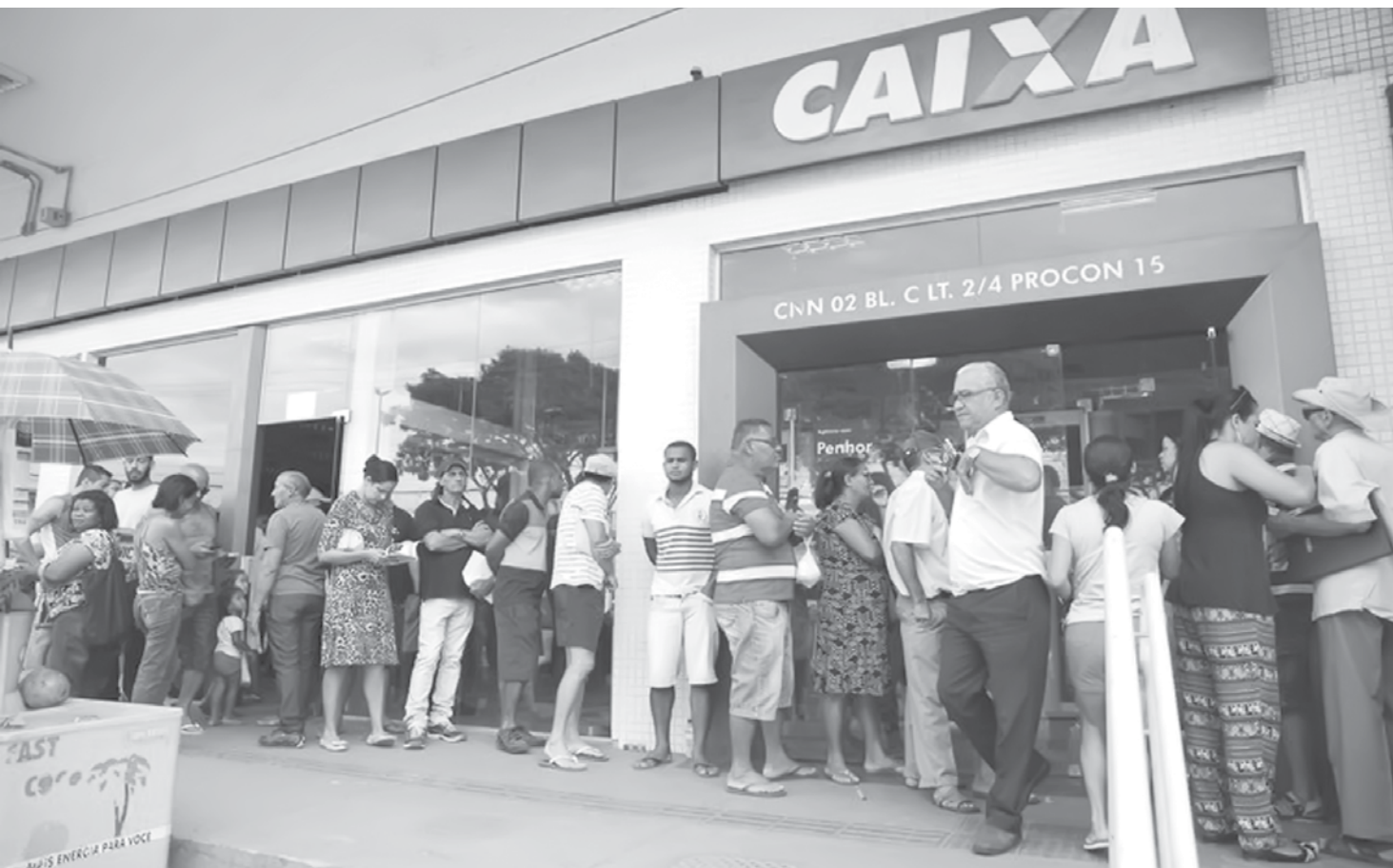
Para ter direito ao benefício é necessário ter trabalhado formalmente durante pelo menos 30 dias em 2017

O dinheiro ficará disponível na rede bancária até 30 de junho de 2019. Depois desta data, o recurso retornará ao FAT, que, além do Abono, também custeia o Seguro-Desemprego e financia de programas de Desenvolvimento Econômico.