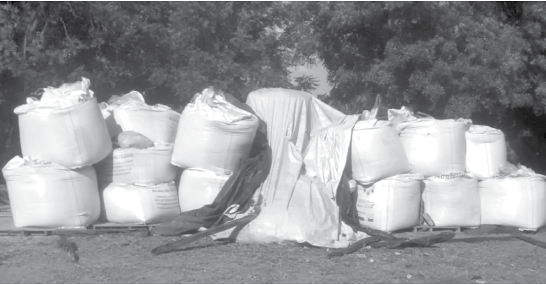
Toneladas de fertilizantes foram apreendidas pela PM em fazenda

Segundo a Polícia, funcionário de fazenda que foi vítima dos criminosos descobriu que material estava em propriedade de Auriflama e denunciou o local