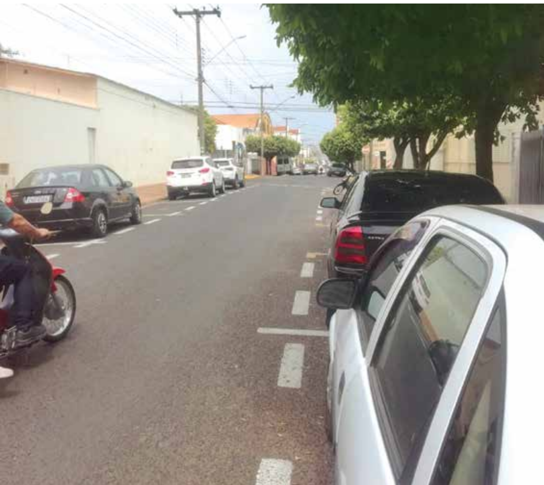
Número de veículos cadastrados era de 56.132 mil em julho de 2017 e saltou para 57.898 mil no mês passado