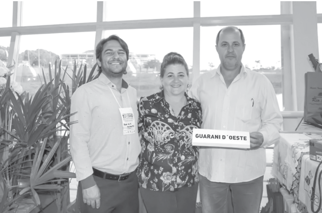
1ª Feira aconteceu entre os dias 17 e 19 de agosto

A Orquestra de Viola e Violão e o Grupo de Catira do Projeto Cidadão do Futuro Marco Caboclo se apresentaram no evento. O grupo vem se destacando nas apresentações em datas comemora-