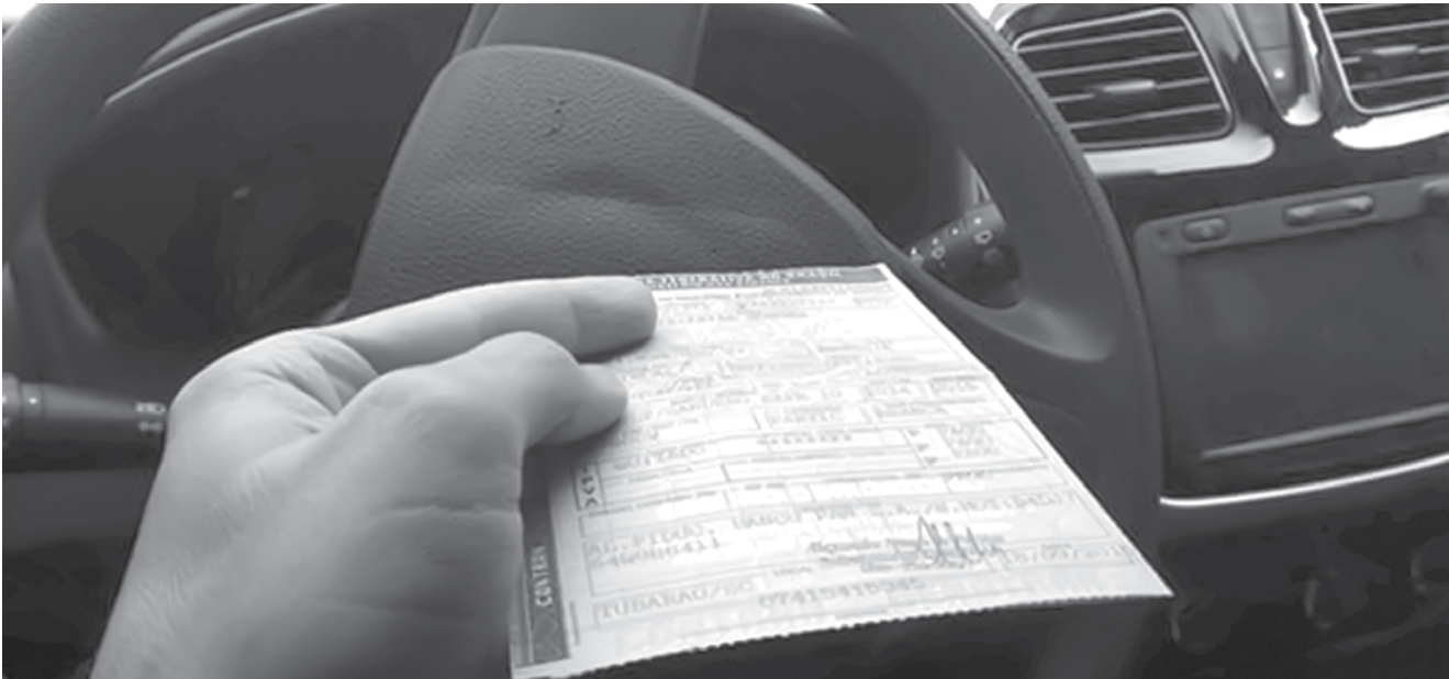
Prazo acaba na próxima sexta-feira

Com o comprovante de pagamento e um documento de identificação em mãos, o condutor deve ir à unidade do Detran.SP onde o veículo está registrado ou em qualquer posto Poupatempo para solicitar a emissão do documento. Se preferir, pode receber o licenciamento em casa. Para isso, tem que pagar o custo de envio pelos Correios, de R$ 11, no momento em que pagar a taxa de licenciamento. O prazo de postagem é de até sete dias úteis após a emissão.