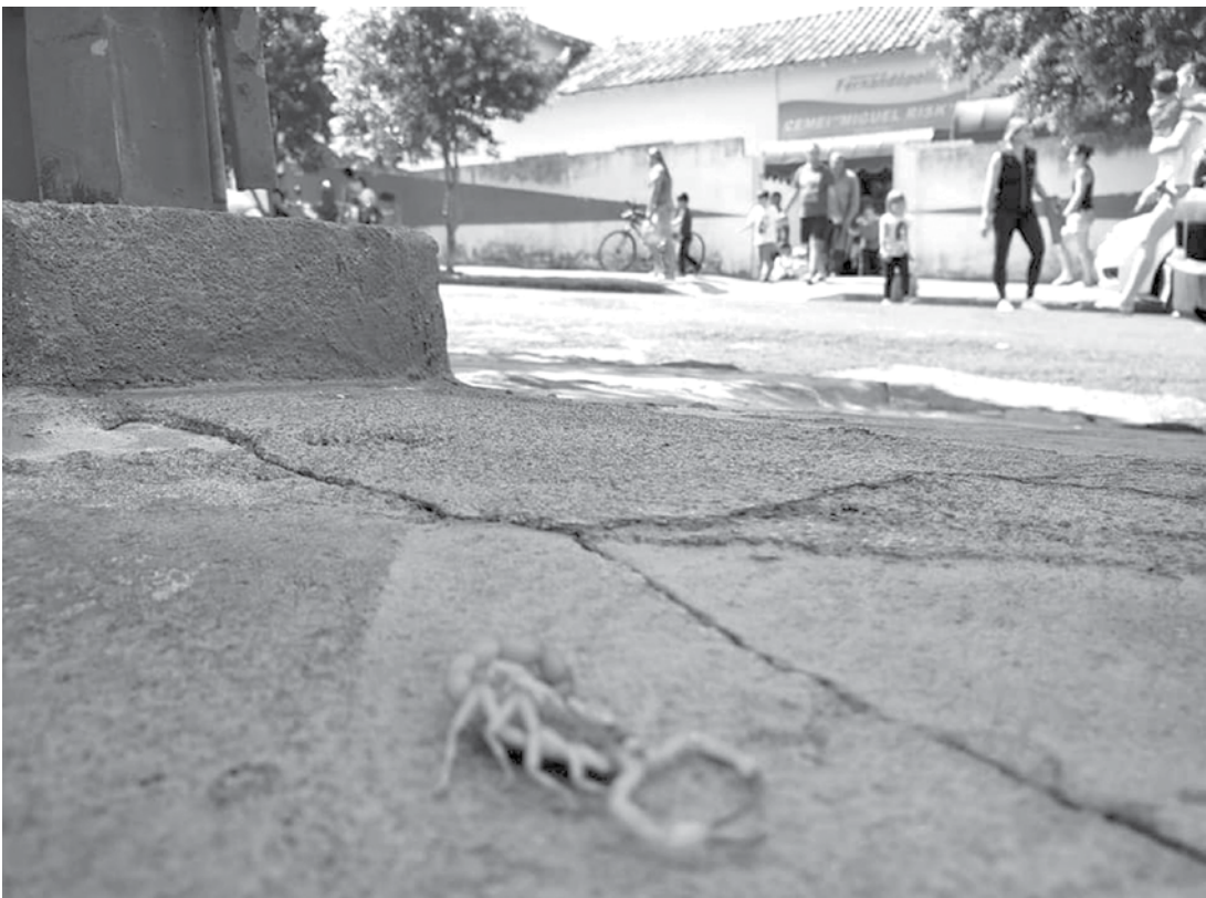
Escorpiões têm sido encontrados com frequência pelos moradores do bairro

corpiões em casa. Não adianta limparmos nosso quintal e fazermos a nossa parte, pois eles vêm de fora. Queremos que o problema seja resolvido”, afirma. A Prefeitura de Fernandópolis informou à Reportagem que “quando há denúncias e reclamações de terrenos com mato ou entulhos, os proprietários são notificados (muitos já foram) e, de acordo com a Lei 1843, de 1993, os mesmos têm o prazo de 15 dias para manterem o local limpo, caso contrário serão penalizados”. Em constatação de escorpiões, quando solicitados, os fiscais da vigilância epidemiológica comparecem ao local para averiguação e descoberta dos possíveis pontos onde os insetos possam ser encontrados e os moradores são orientados.