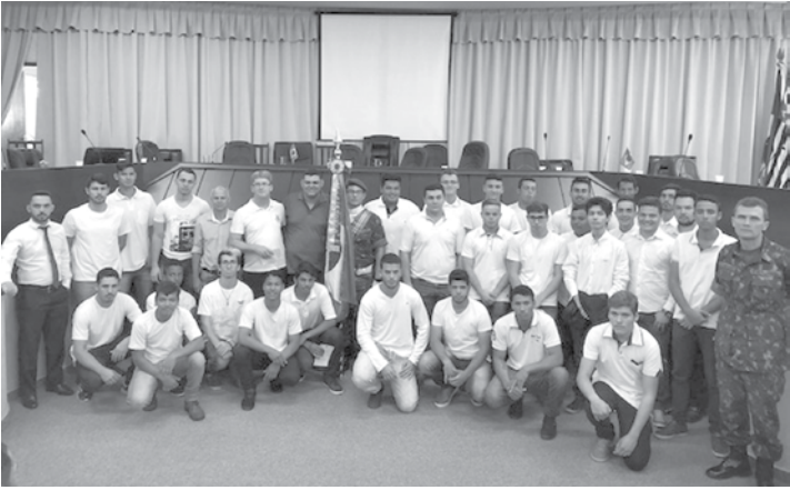
Jovens de Indiaporã na Solenidade Cívica Militar