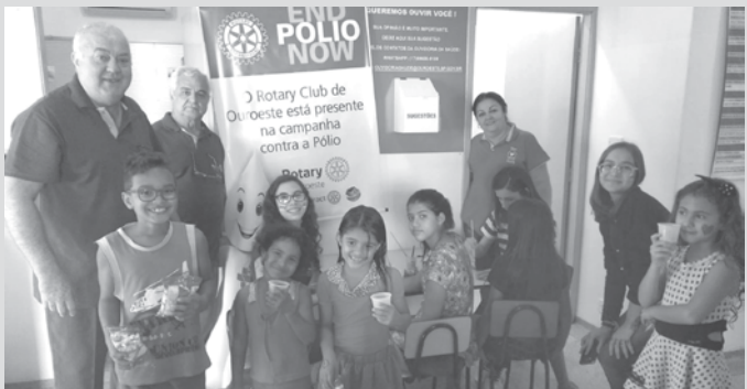
Meta do Rotary Club Internacional é erradicar a poliomielite do Mundo