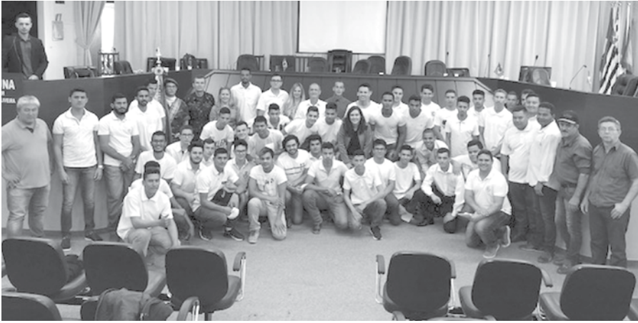
Jovens de Ouroeste dispensados do serviço militar junto às autoridades