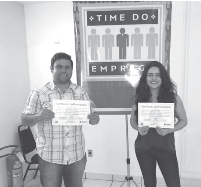
O Time do Emprego orienta o trabalhador na busca de um emprego compatível com suas qualificações profissionais