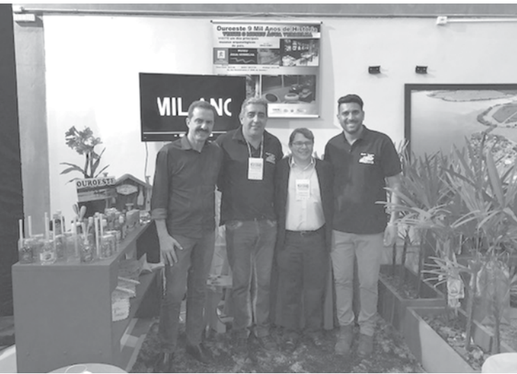
Centro de Cultura e Turismo “Marão Abdo Alfagali” foi sede da Feira