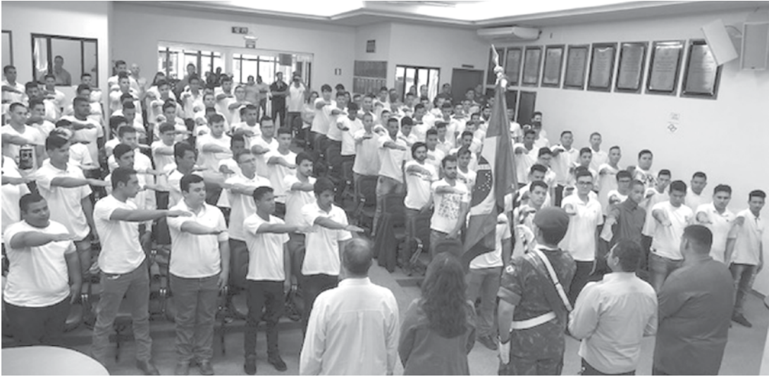
Cerca de 136 jovens alistados nos municípios de Ouroeste, Indiaporã, Populina e Guarani D'Oeste receberam os certificados

que todos os dispensados ficarão compromissados com relação à defesa da pátria, sendo então reservistas das forças armadas brasileira. Em seu discurso, a prefeita frisou sobre o significado do ato solene, inclusive dos benefícios que o jovem cidadão tem em estar em dia com o Serviço Militar. Ao término da solenidade, todos dei-