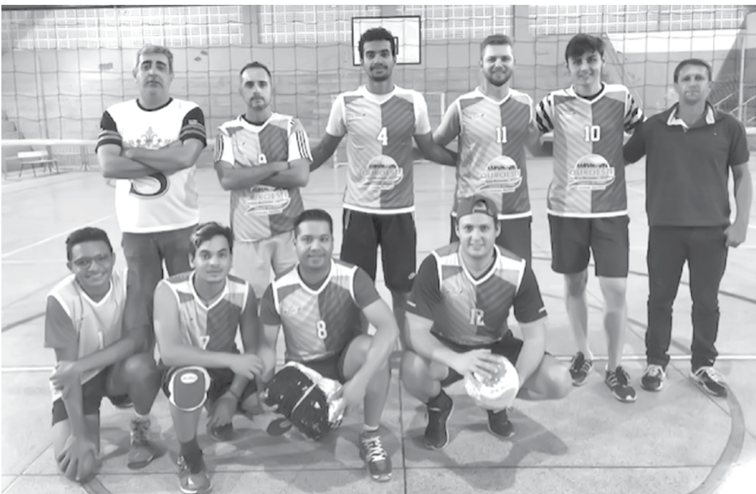
Doações foi para a equipe masculina de Ouroeste