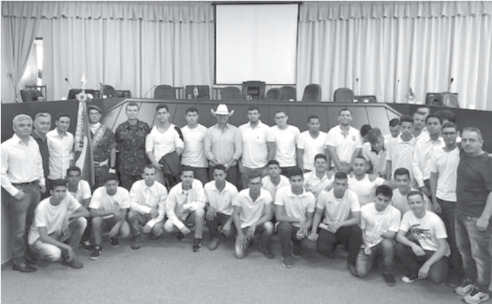
Jovens de Populina dispensados da prestação do Serviço Militar Inicial