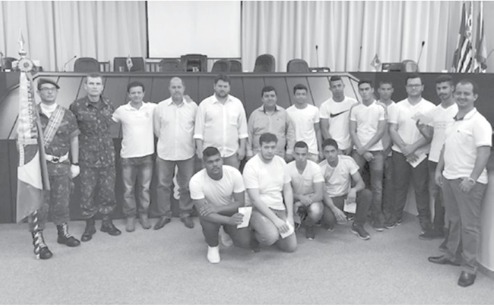
Jovens de Guarani D'Oeste que também participaram da cerimônia