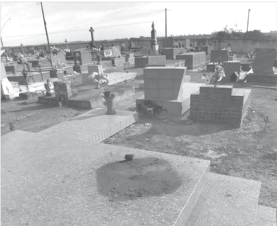
Ladrões furtaram imagens de santos, cruz e estátuas de bronze do Cemitério de Tabapuã

A Prefeitura informou que, por enquanto, reforçou a vigilância no cemitério