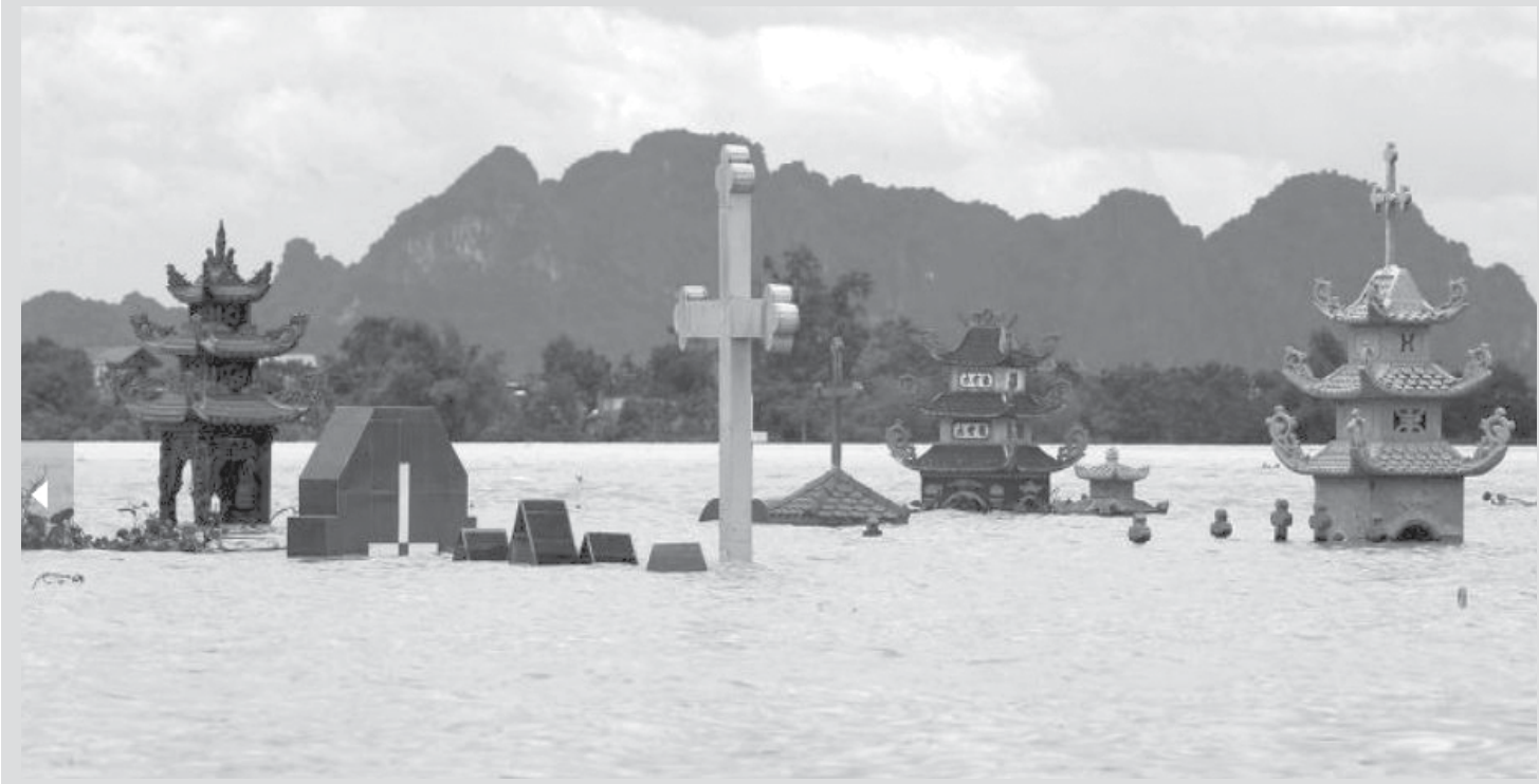
Túmulos ficam submersos após fortes chuvas atingirem vilarejo no Vietnã.