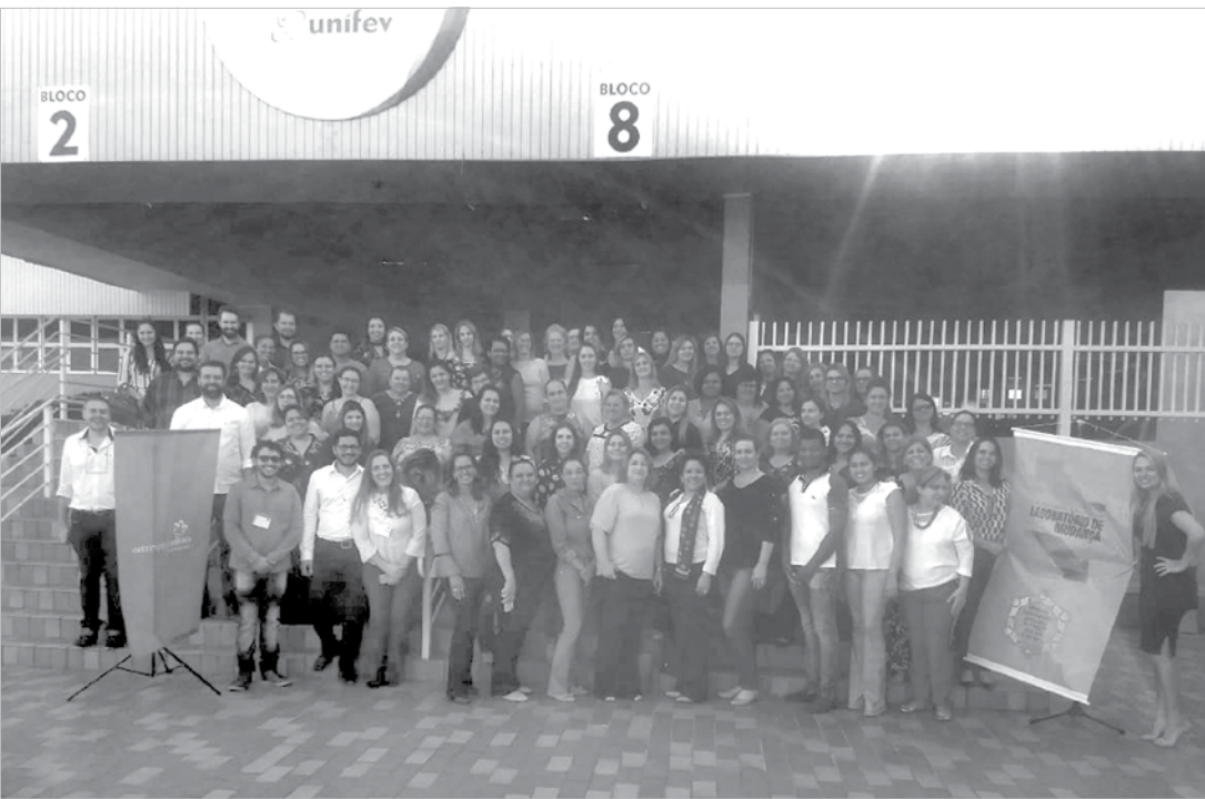
Encontro contou com a participação de educadores de toda região