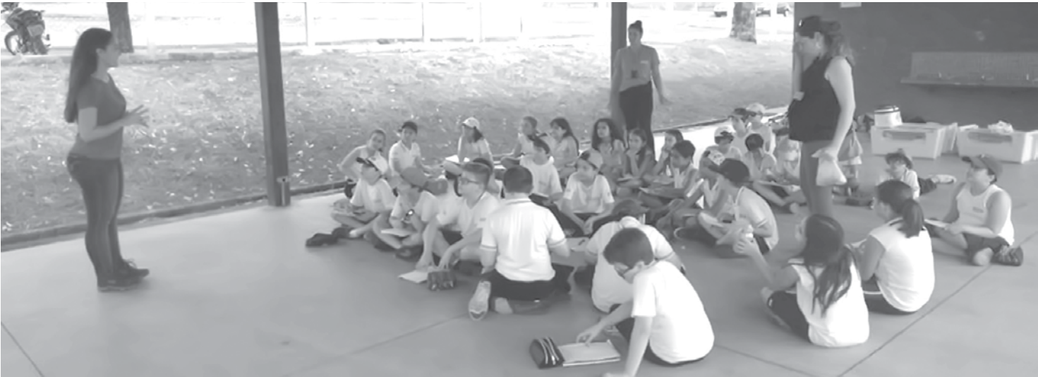
As crianças assistiram a várias palestras

A globalização priorizou interesses específicos de ganhos, descuidando do equilíbrio entre as nações. O populismo nacionalista se aproveitou do descontentamento geral para galgar o poder. Ambos descuidam da boa administração, abandonando a busca da continuada melhora das condições de vida.