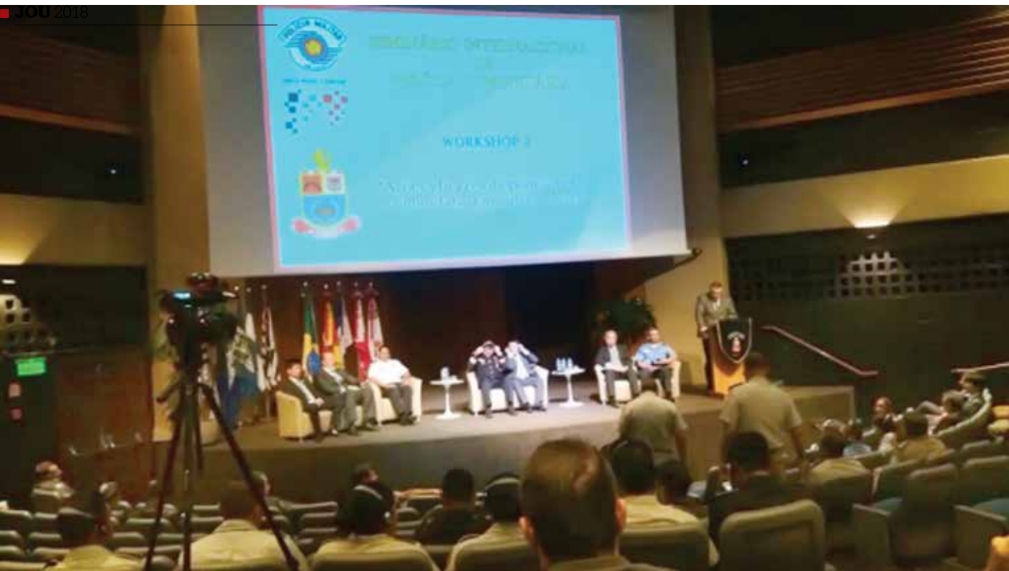
Evento foi realizado em São Paulo, no Centro de Convenções Rebouças.