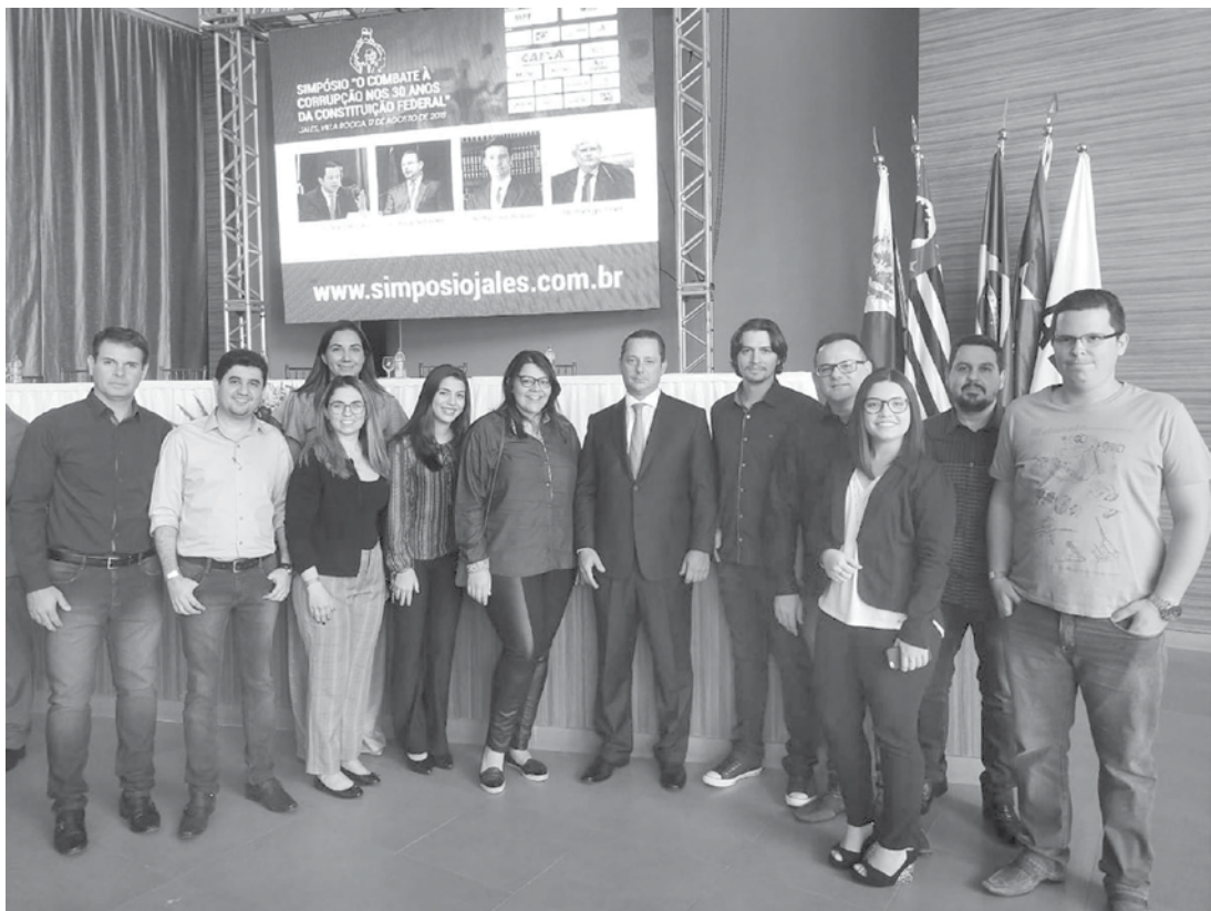
O evento, que reuniu importantes nomes do Direito, contou com a participação de alunos do curso e teve o patrocínio da Universidade