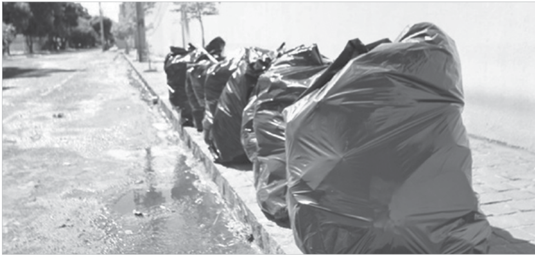
Destinação final dos resíduos e reciclagem ainda é um problema

Nesta 3ª edição, o ISLU mostra que das 1.264 cidades do Sudeste que participam do SNIS, 40 aparecem no nível "muito baixo"; 245; baixo; 783, médio; 195, alto; e apenas 1 atingiu o "muito alto". A melhor nota foi de Sapucaí-Mirim, uma pequena cidade da microrregião de Pouso Alegre, em Minas Gerais, com população inferior a sete mil habitantes.