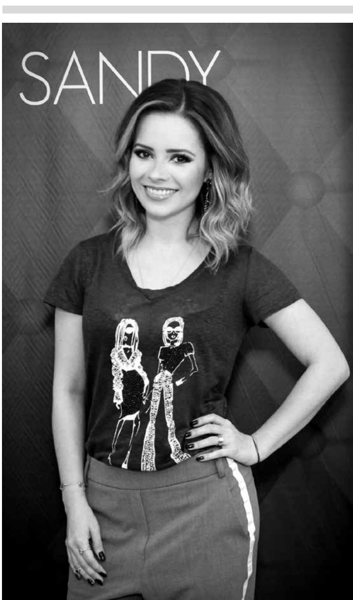
O filho de Sandy tem liberdade para brincar com o brinquedo que desejar

Segundo a artista, sua intenção é trazer conhecimento para os fãs: “Quero agregar e que as pessoas parem para pensar e tenham um momento que reflitam um pouco mais sobre algum assunto. Ou que se cuidem mais por estar ansiosos. Coisas que sejam úteis”. Kéfera entrega que tem passado por mudanças pessoais: “Tem muito a ver com a minha idade. Mas o que digo sobre ser útil e não só publicar coisas vazias é porque na época que eu tinha 17 e comecei no youtube não tinha nada que me interessasse e me engajasse e enterrasse de causas sociais. Tinham pessoas com mais de 30 falando sobre esses assuntos com uma linguagem muito limitada que eu não entendia quando tinha 17 anos e por isso não chamava a minha atenção. Por mais que tive privilégios, o dialeto de algumas causas é difícil de entender quando se é novo”.