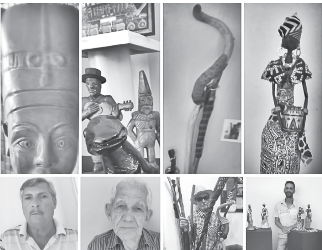
A exibição acontece de segunda a sexta-feira, das 12h às 17h no saguão do Teatro Municipal de Fernandópolis

as multas, juros e correção monetária. Os tributos são acompanhados desde o início do ano.