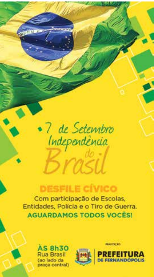
Desfile percorrerá a rua Brasil

da dos Arnaldos, seguindo até o cruzamento com a avenida Manoel Marques Rosa, área central da cidade.