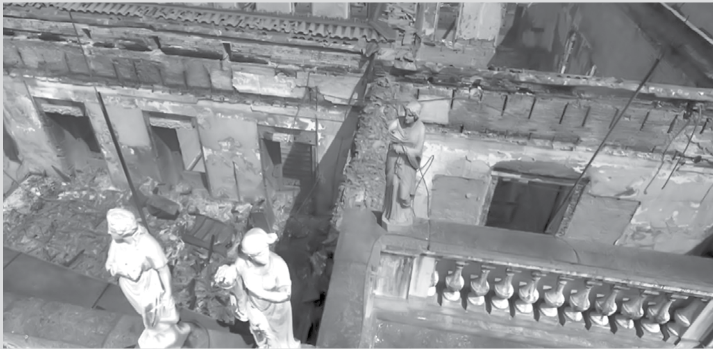
RUÍNAS: Escombros do Museu Nacional, na Quinta da Boa Vista, no Rio de Janeiro. Desde 2013, os repasses da União para o Museu Nacional encolheram 49%; já o Ibram só gastou 20% em conservação em 2017.