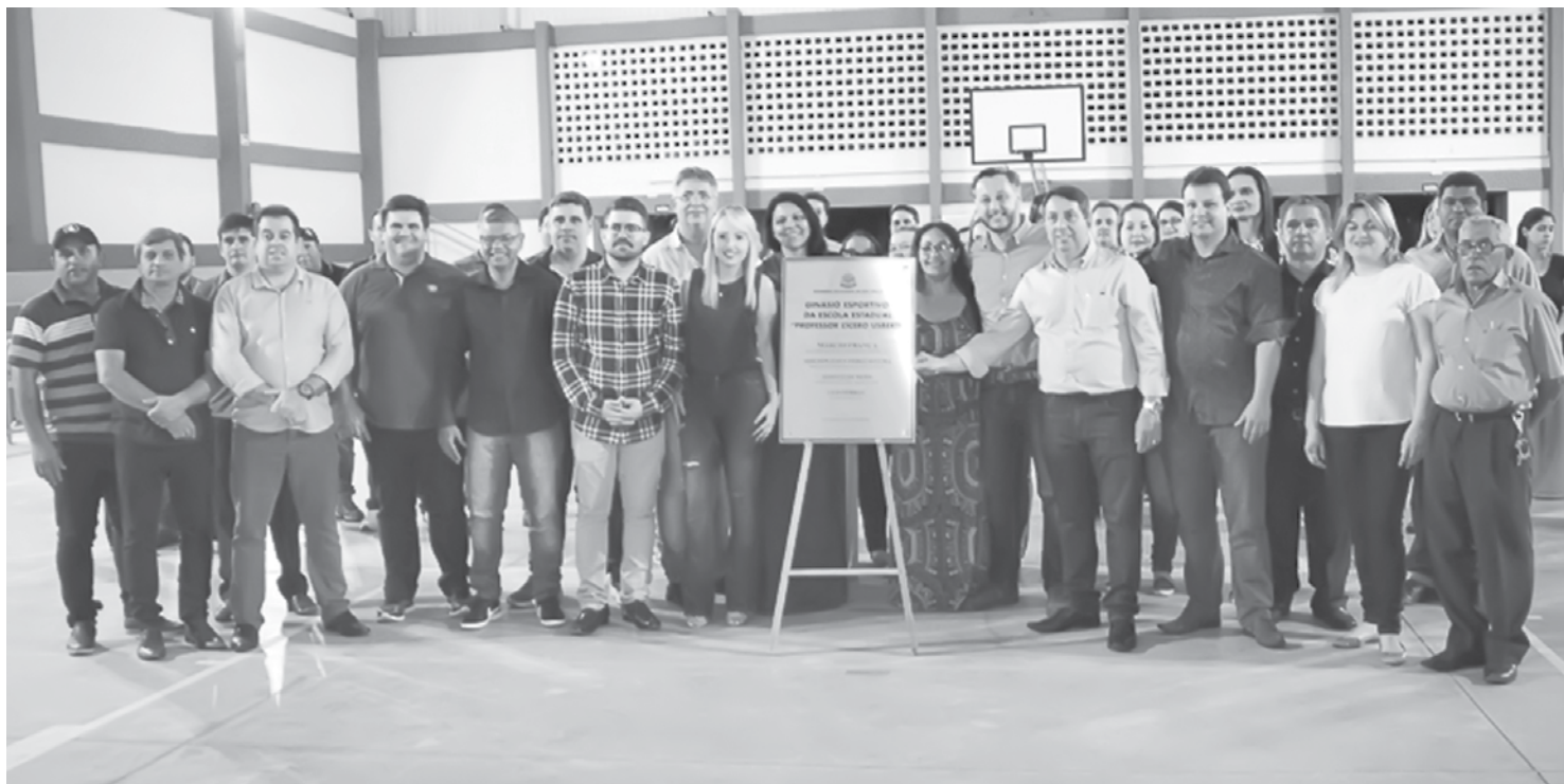
Autoridades e público durante cerimônia de inauguração do ginásio da escola Cícero Usberti, que foi completamente reconstruído

Nada existe passivamente; não se sofre a ação do ser, não nos deixamos ser: nós fazemos ser. Não pode haver felicidade a não ser no equilíbrio. Do mesmo modo que o bem, isto é, a felicidade do corpo está na saúde, não na doença, não na patologia somática, assim o bem isto é, a felicidade do espírito reside no equilíbrio psicológico, não na patologia interior. Tanto a experiência humana como o bom senso confirmam que existe uma relação essencial entre felicidade e normalidade.