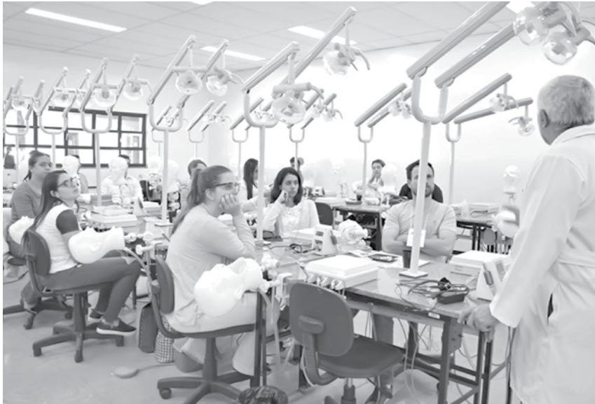
Evento contou com grandes nomes da área