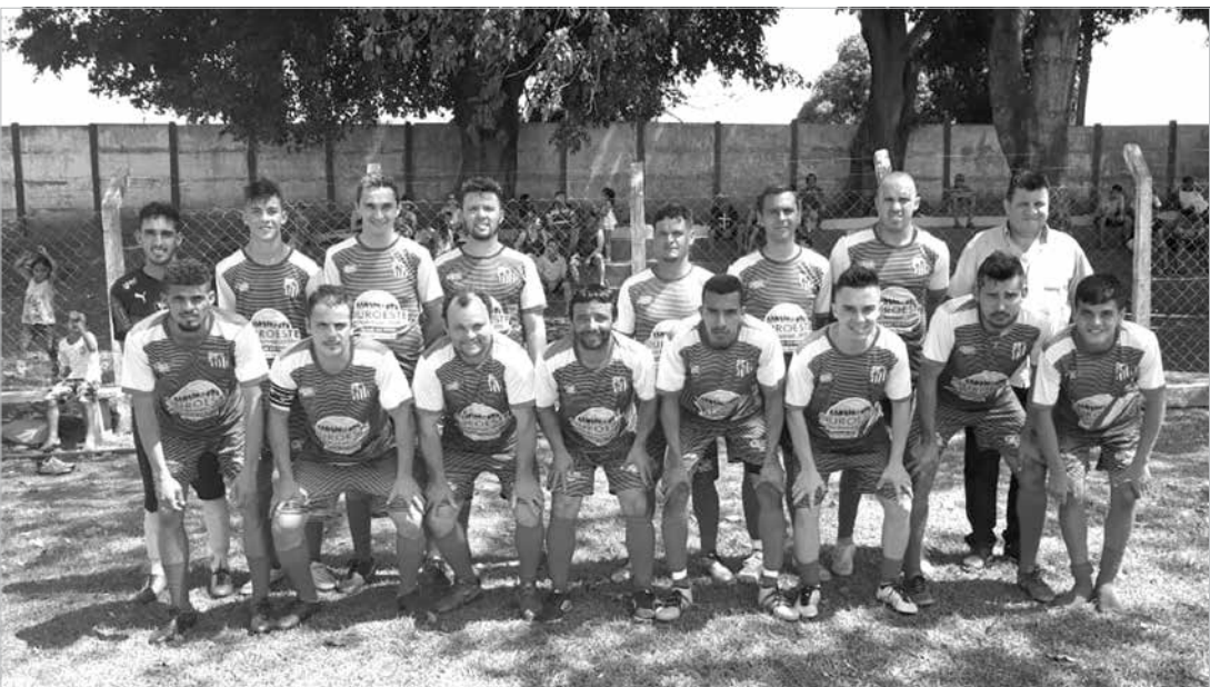
Equipe de Arabá campeã do “Quadrangular de Futebol de Campo”

A final da categoria aspirante foi entre as equipes de Arabá e Turmalina. No tempo normal o jogo ficou empatado em 0X0 e, nos pênaltis, a equipe de Arabá sagrou-se campeã com o resultado de 5X4. Na categoria titular a equipe Anfitriã, Arabá, também sagrou-se campeã ao vencer a equipe de Indiaporã por 2X1. O campeonato contou com o apoio e incentivo da Prefeitura, Câmara de Vere-