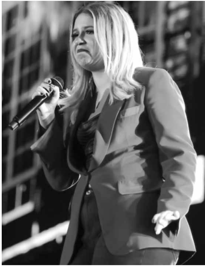
A cantora ainda contou detalhes sobre o novo projeto

A cantora, que se vê mais disposta nos shows após passar por reeducação alimentar e emagrecer 20 kg, também entrou em detalhes sobre o novo trabalho. “Eu sonhei com um projeto chamado ‘Eu Te Vejo Em Todos Os Cantos’, que era onde eu passava por todos os estados do Brasil e gravava uma música em cada um deles. E com muito custo, muito carinho e fé em Deus, a gente está conseguindo realizar. Consiste em chegar na cidade, mas eu não coloco meu nome em lugar nenhum da cidade, nem o cara do avião quando eu vou pousar, sabe que sou eu”, diz Marília, adicionando: “A gente chega, vai panfletar no centro da cidade em algum lugar que tem movimento e a galera fica sabendo no dia que vai ter Marília Mendonça de graça na cidade”.