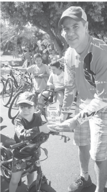
Evento atraiu grande público

dalou por toda extensão da Avenida dos Bandeirantes e da Rua Martins de Sá, finalizando o passeio na Praça