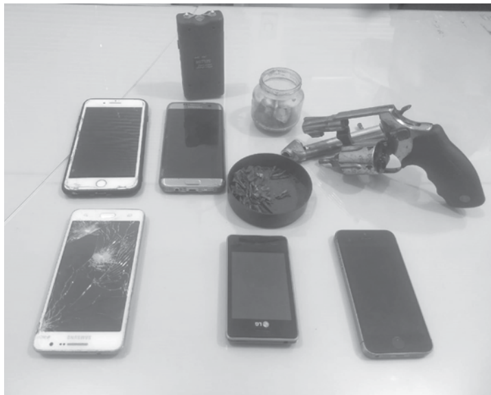
Drogas e um revólver calibre 38 foram apreendidos pela Polícia