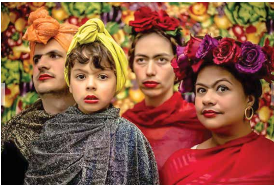
Retrato presente na exposição "Todos Podem Ser Frida"

Após alguns minutos de interrupção e muita discussão entre pessoas contrárias e favoráveis à mostra, a sessão foi retomada. Policiais militares precisaram colaborar nos trabalhos para evitar que algo grave acontecesse.