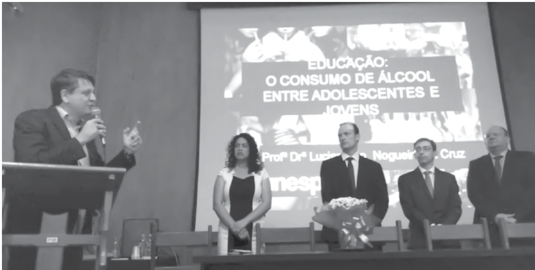
Encontro contou com a participação de profissionais que prestam atendimento às crianças e adolescentes