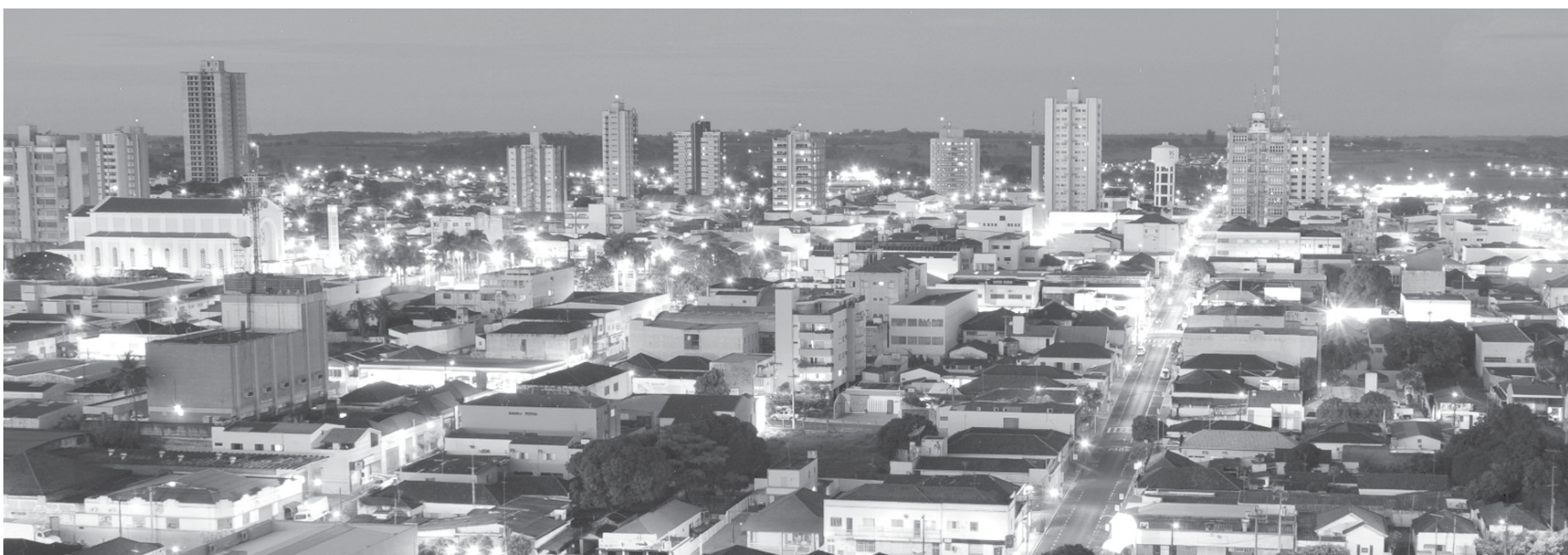
Única cidade paulista à frente de Fernandópolis é Águas de São Pedro

“Eficiência é algo conquistado com um grande trabalho de gestão dos recursos públicos. Só se é eficiente quando há ações de responsabilidade com a população. Fernandópolis é um