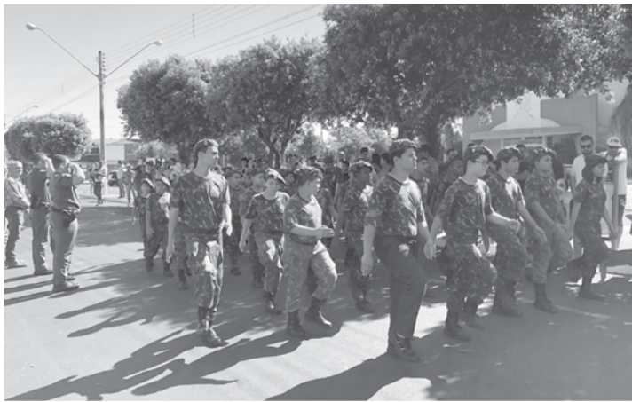
Desfile aconteceu na região central de Ouroeste

de Ouroeste e fã do exercício e da Polícia também participou do desfile. O Tiro de Guerra e o Projeto Soldado Mirim possuem como Chefe de Instrução, o sargento Heroito Gomes. A participação, em Ouroeste, teve a iniciativa do CB DE MANI e SD CARIS que atuam no GP local.