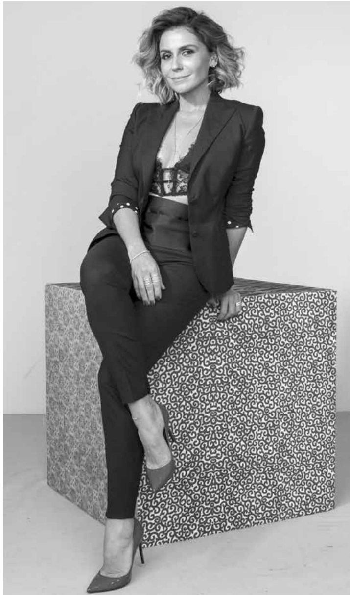
A atriz abriu uma loja virtual para colocar à venda algumas peças de roupa