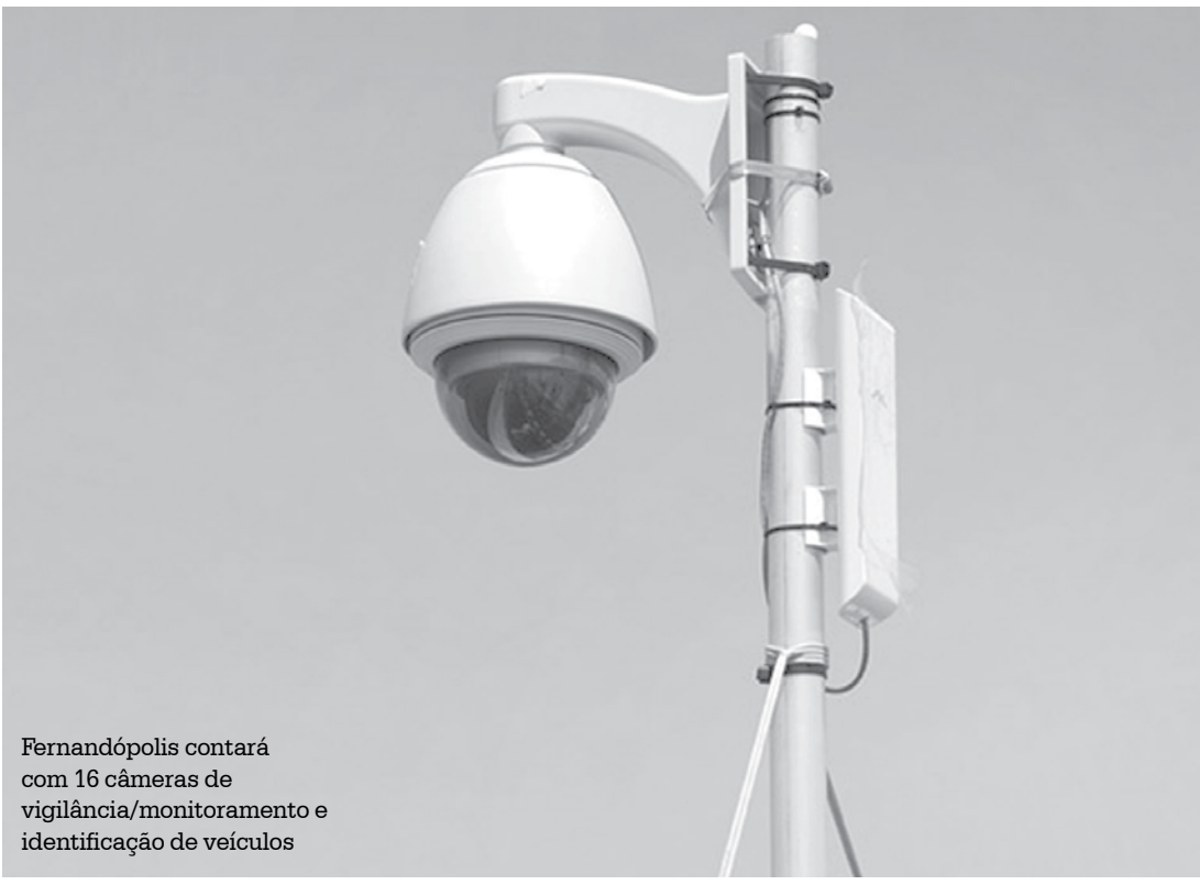
Fernandópolis contará com 16 câmeras de vigilância/monitoramento e identificação de veículos

da Brasil/Pontilhão de Água Vermelha) e no Trevo do Ubirajara (próximo à Rodoviária). Ao todo, são 16 câmeras (algumas do modelo speed dome - 360 graus) e numa primeira etapa está prevista a instalação de 8 câmeras de vigilância/monitoramento e identificação de veículos. O projeto é encabezado pela Associação de Amigos, tornando-se realidade devido à parceria com as Polícias Civil e Militar e também com a ACIF. A Prefeitura de Fernandópolis é gestora e também parceira do projeto, estando incumbida da instalação e manutenção das câmeras em pontos indicados pelo policiamento.