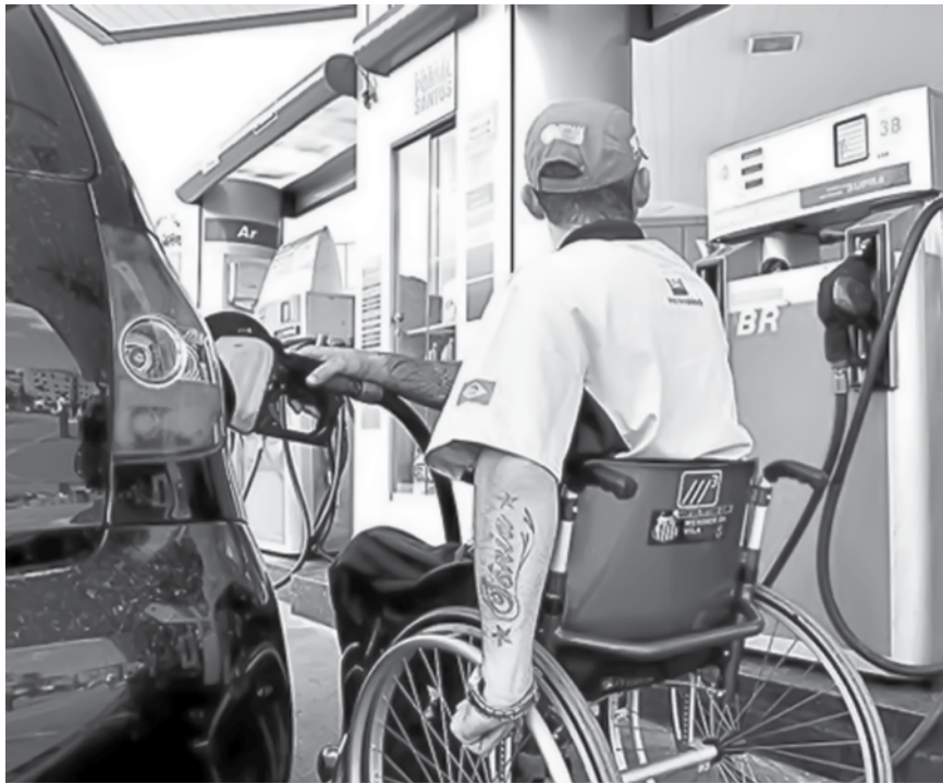
Caso as empresas cumprissem a lei, o número de pessoas com deficiência que estão empregadas seria maior

Segundo a Lei de Cotas (Lei nº 8213/1991), se a empresa tem entre 100 e 200 empregados, 2% das vagas devem ser garantidas a beneficiários reabilitados e pessoas