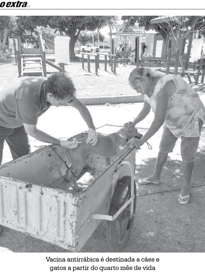
Vacina antirrábica é destinada a cães e gatos a partir do quarto mês de vida