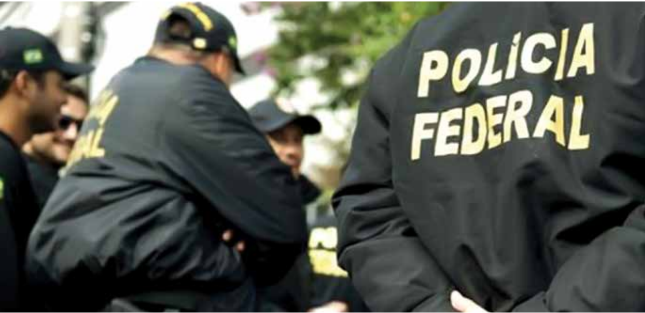
Objetivo das diligências da PF é prevenir e impedir que crimes eleitorais ocorram na região