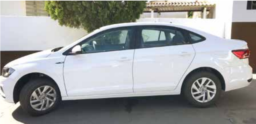
Automóvel foi adquirido por meio de um convênio firmado entre a Prefeitura e o Governo Federal

do Ministério da Saúde. Além do veículo outros 16 itens também foram licitados para serem adquiridos com a finalidade de equipar a Unidade Básica de Saúde do município. Com esses equipamentos à disposição dos profissionais médicos e de enfermagem a Unidade reunirá condições de atender à comunidade com mais eficiência, melhorando muito a qualidade dos atendimentos. Ao todo foram licitados mais de R$ 99.000,00 em itens que serão utilizados na modernização da Unidade Básica de Saúde, a fim de prestar um serviço com mais qualidade para a população. A Proposta inicial do Ministério da Saúde para as aquisições dos objetos era de R$ 107.930,00 com a realização do Pregão Presencial houve uma economia de R$ 8.484,00 para os cofres públicos.