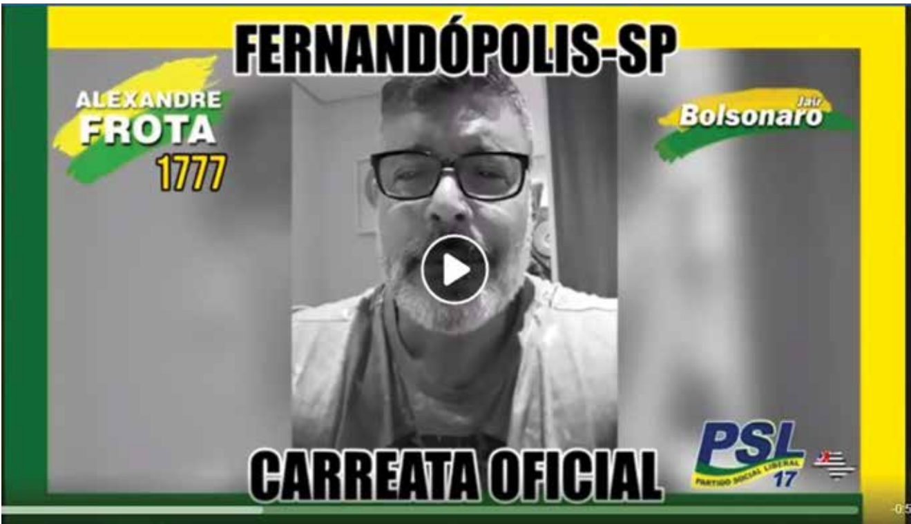
Em vídeo que está circulando nas redes sociais, Alexandre Frota convida a população a participar do ato