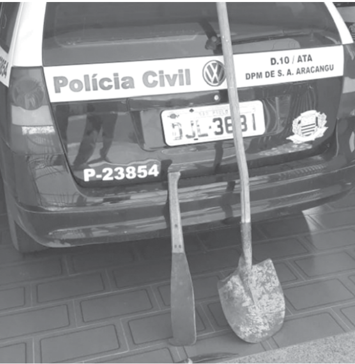
Pá e facão que podem ter sido usados no crime