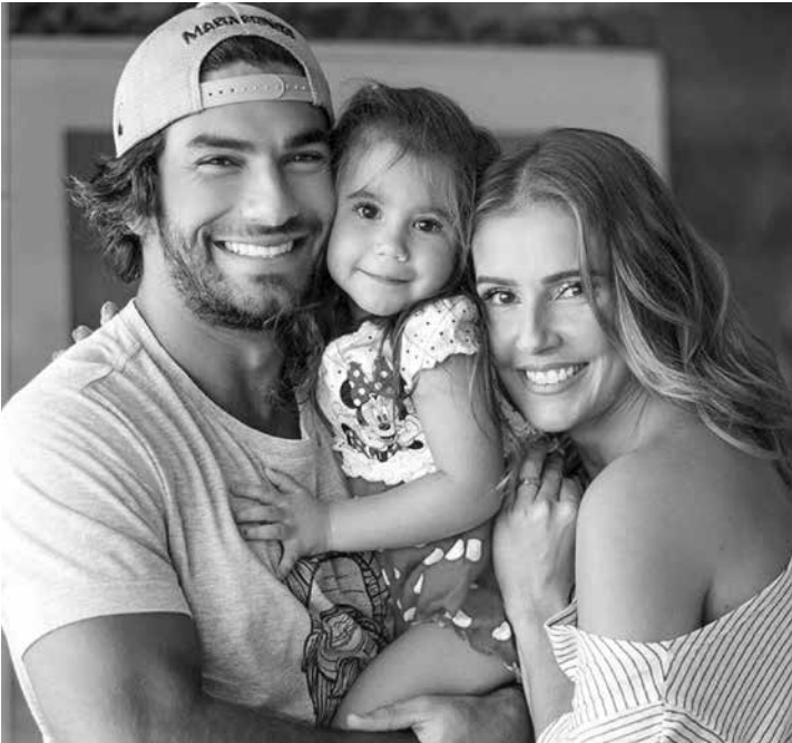
Deborah ao lado do marido e da filha