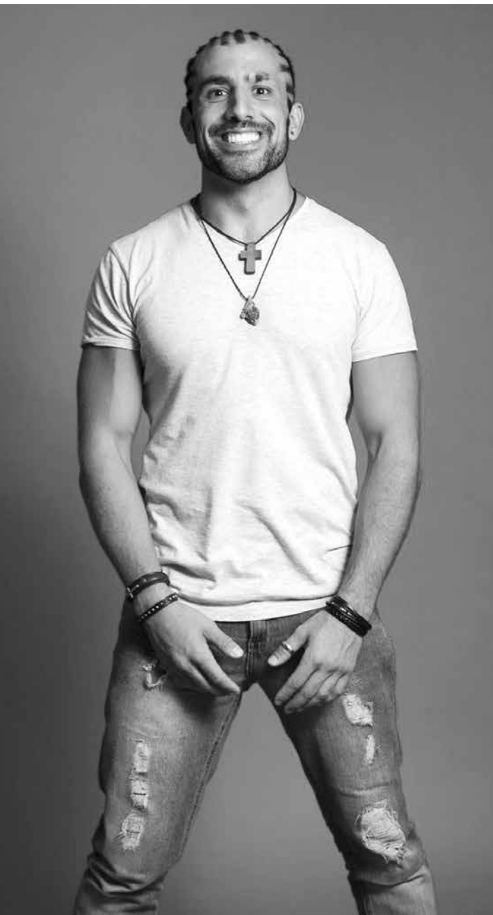
O sírio reencontrou sua família na noite do último sábado (22)