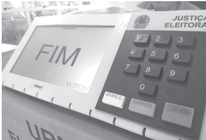
Número aumentou no noroeste paulista neste ano

internet, que também pode confundir o eleitor com notícias falsas.