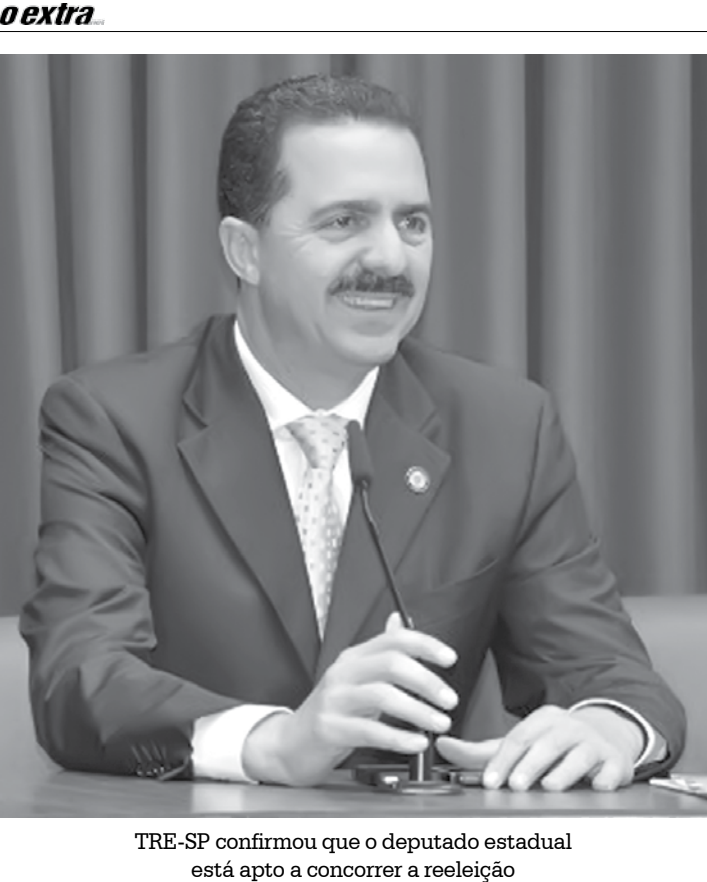
TRE-SP confirmou que o deputado estadual está apto a concorrer a reeleição