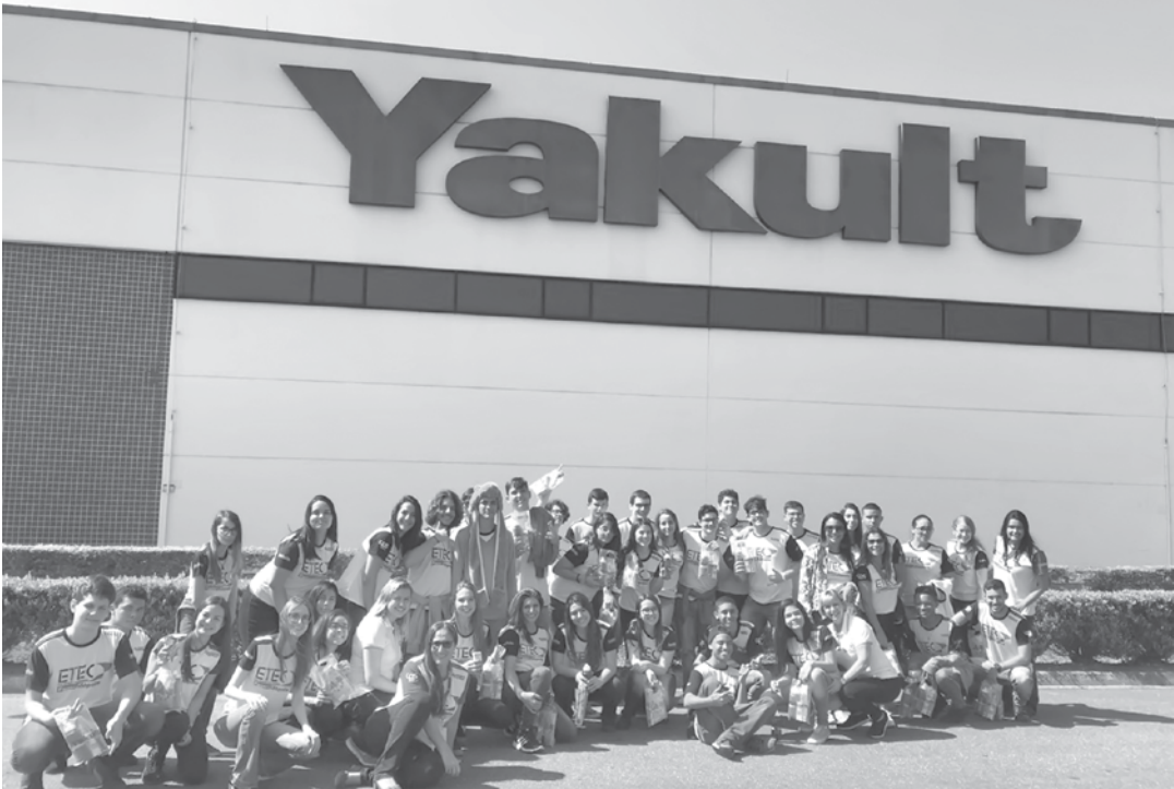
Participaram das visitas alunos dos cursos de Açúcar e Alcool, Segurança do Trabalho e Química da Etec de Fernandópolis