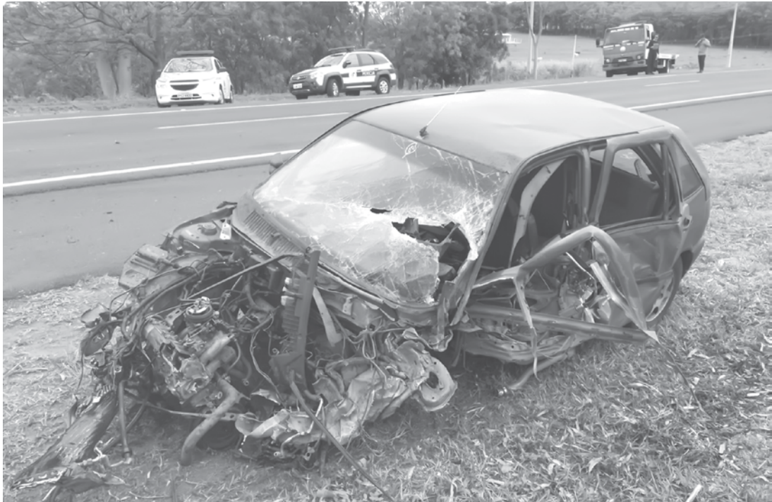
Motorista embriagado invadiu a pista contrária e bateu de frente com caminhão em Jales

O homem teve ferimentos leves e precisou ser levado à