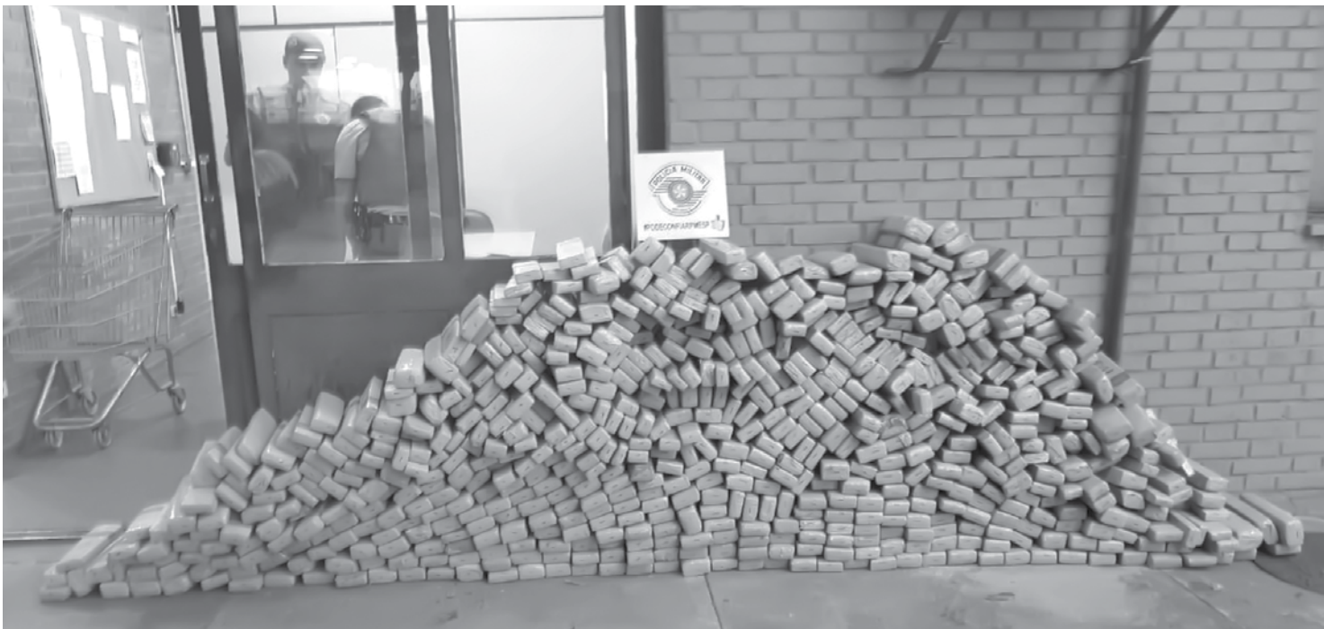
Droga apreendida foi encaminhada à Polícia Federal de Jales

Já o motorista do terceiro carro que também estaria envolvido no crime fugiu sentido Minas Gerais, mas foi preso em um canalial pela Polícia Rodoviária de Iturama (MG). No carro havia mais 200 tablets de maconha.