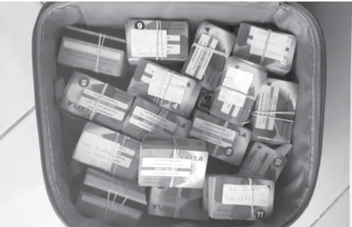
Ao todo, foram expedidos 11 mandados de prisão e 33 mandados de busca e apreensão

Ao todo, foram expedidos 11 mandados de prisão (sendo quatro preventivas e sete temporárias) e 33 mandados de busca e apreensão, indisponibilidade de bens e bloqueio de valores em endereços de dez municípios de Minas Gerais: Grão Mogol, Itacarambi, Corinto, Contagem, Belo Horizonte, Brumadinho, Santa Luzia, Ribeirão das Neves, Juatuba e Esmeraldas.