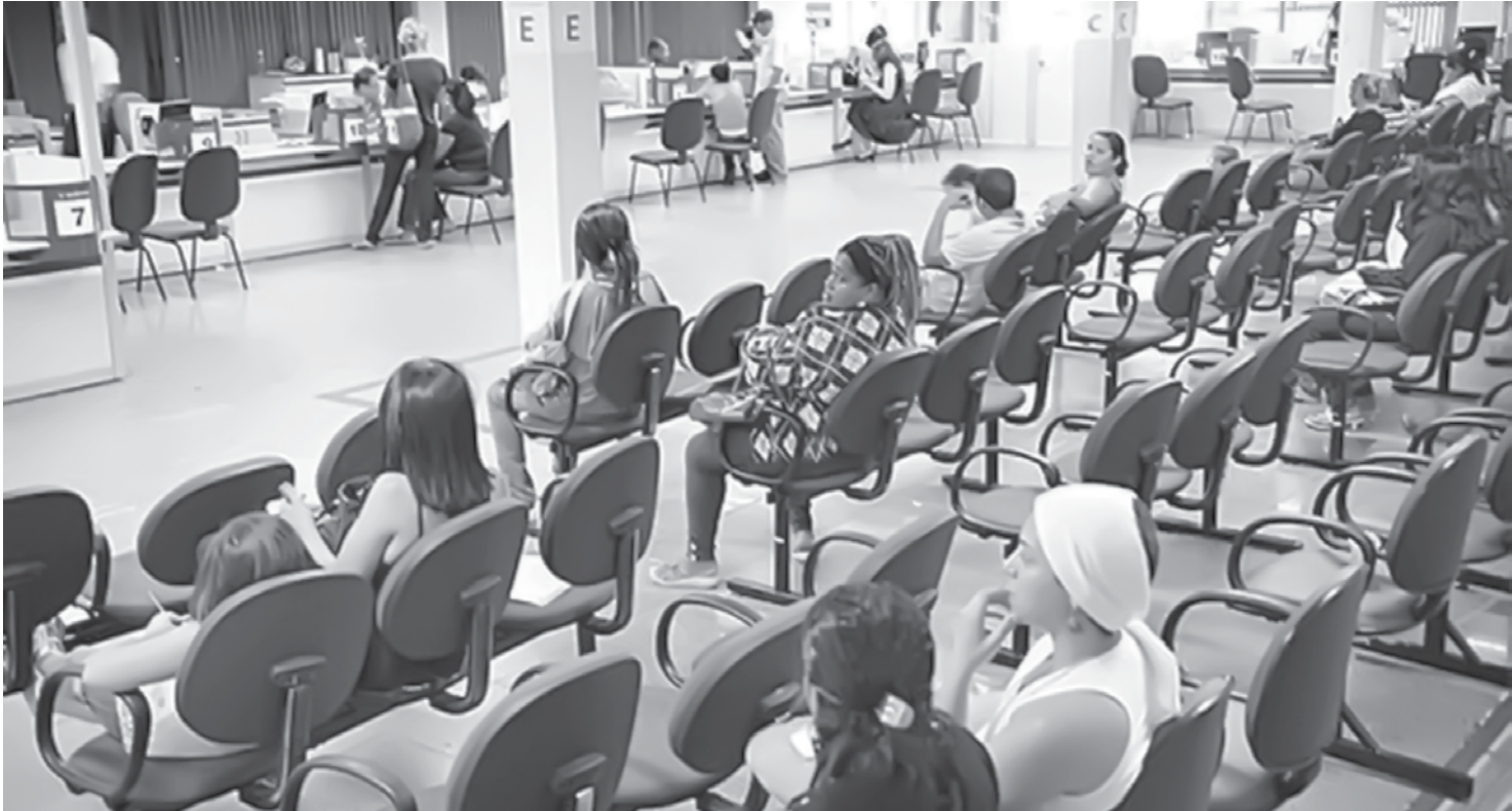
Estimativa é de que 59.700 novos casos sejam diagnosticados neste ano

O compromisso firme, e ao mesmo tempo paciente, de remover as crenças nocivas de nossas almas confere-nos, pouco a pouco, a habilidade de ver com mais clareza, através de nossos frágeis temores, nossa desorientação nas questões amorosas e nossa falta de autocontrole. Paramos de nos esforçar para impressionar os outros. Um belo dia percebe-se com satisfação que não estamos mais representando para plateia alguma.