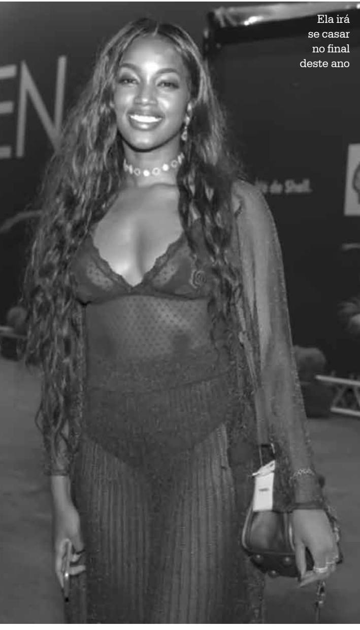
Ela irá se casar no final deste ano