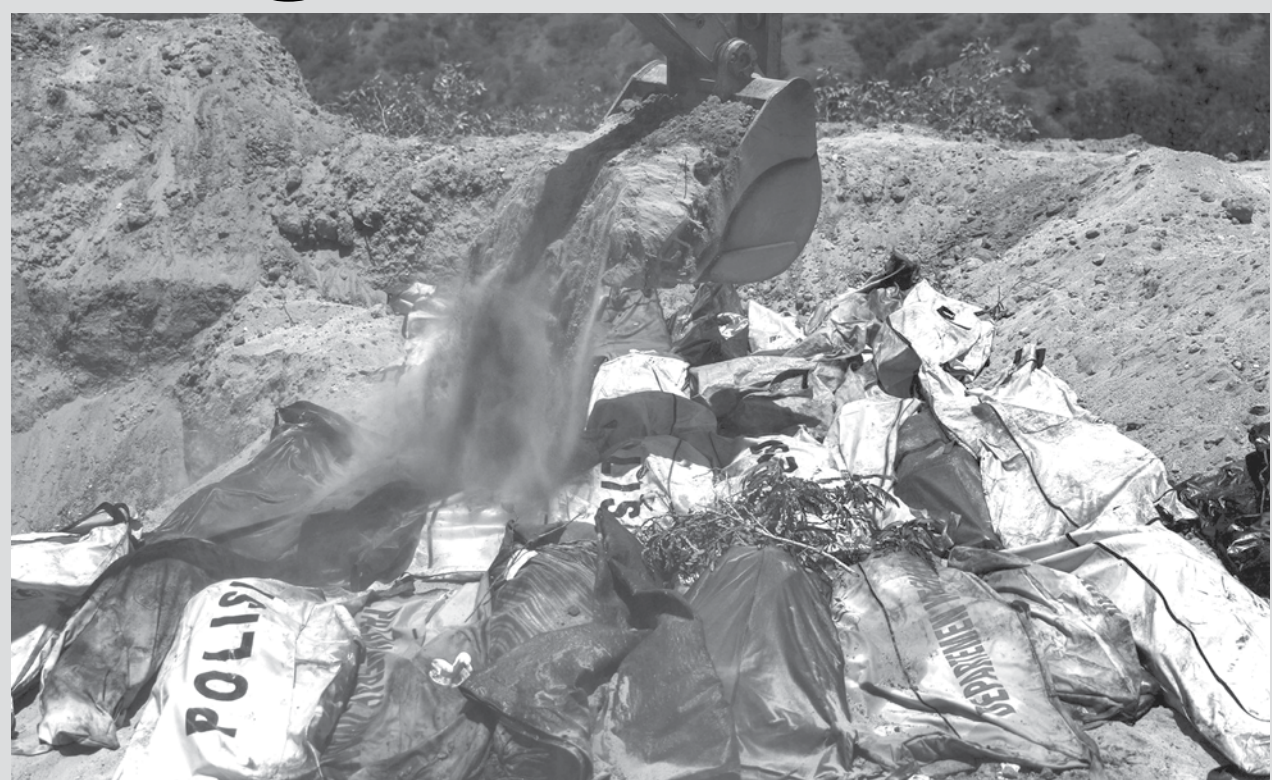
Corpos de vítimas do terremoto e tsunami que atingiu Palu, na Indonésia, são enterrados em uma vala comum. Mais de 1200 pessoas morreram no desastre.