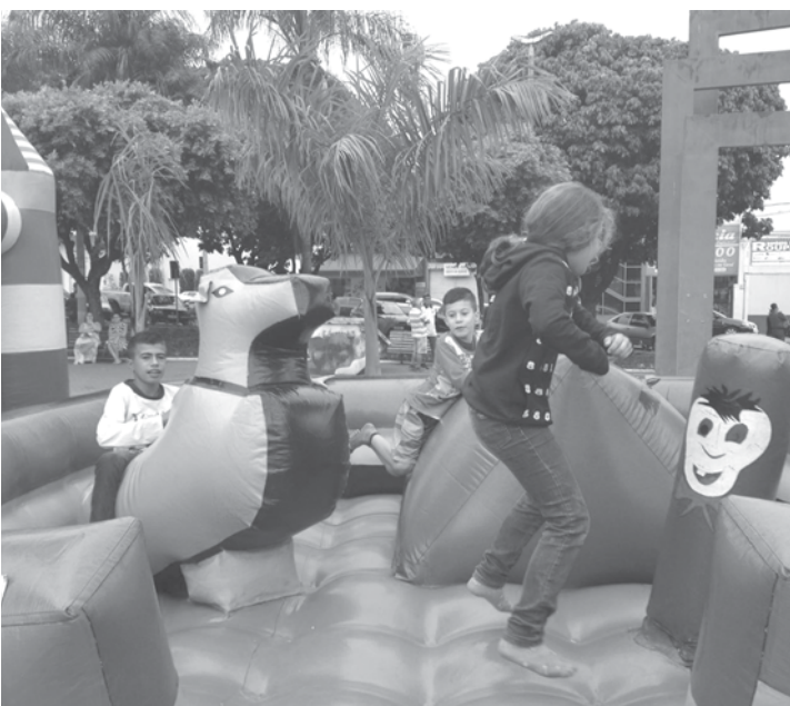
Festa atrai grande público todos os anos na praça

Segundo um levantamento feito pela Educação, o estado de São Paulo possui 2,2 mil escolas que fazem parte do programa.