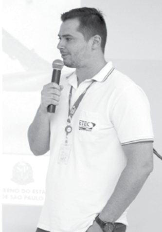
Evento contou com a presença de prefeitos, empresários, líderes e gestores de Fernandópolis e região