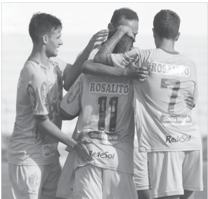
O Mirassol tem 15 gols na competição

Com três pontos na conta da vitória fora de casa na