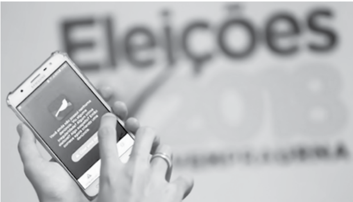
Aplicativo está disponível para o eleitor tanto em versão Android quanto iOS