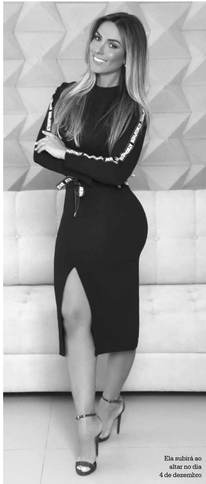
Ela subirá ao altar no dia 4 de dezembro