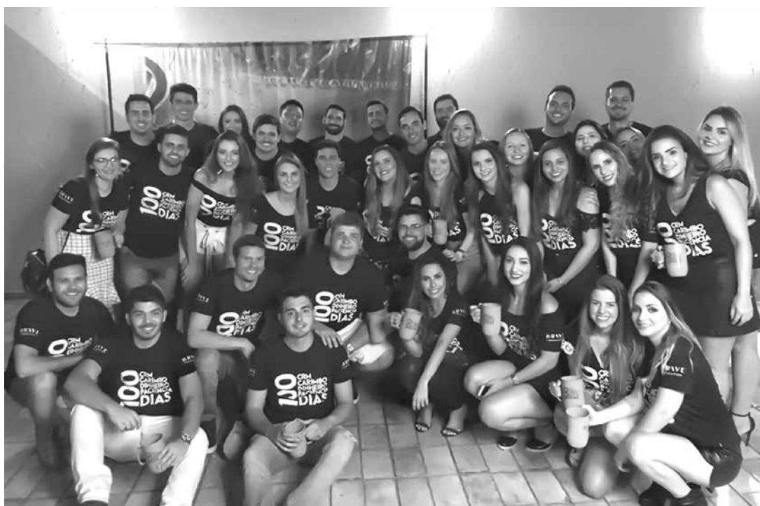
A TXIII turma de Medicina de Fernandópolis posa para um click especial na festa dos 100 dias.