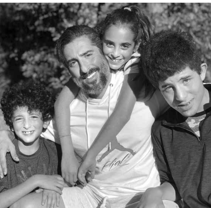
Marcos Mion com os filhos