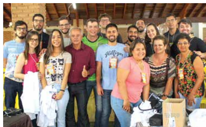
Todo o leite arrecadado com o evento foi doado ao CRAS do município