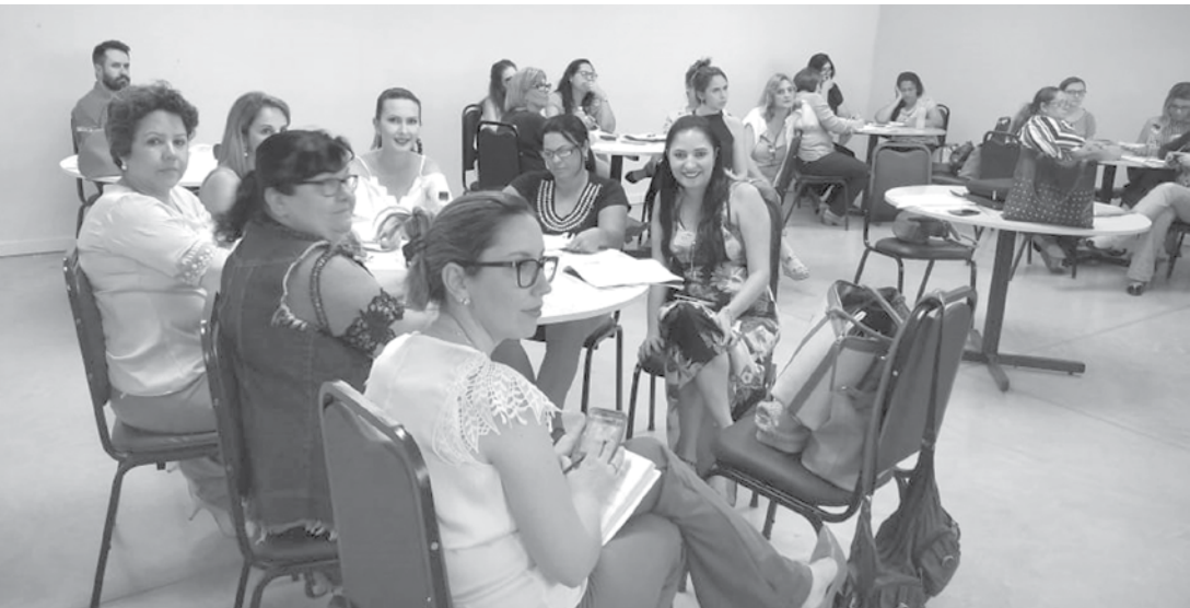
Equipe de Fernandópolis marcando presença no encontro

Evento visa proporcionar qualificação e novos conhecimentos aos profissionais da área