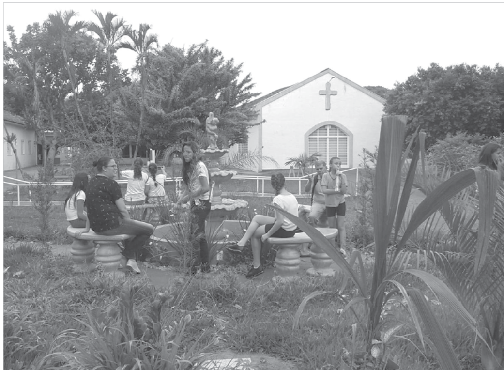
Alunos durante visita ao Parque Residencial São Vicente de Paulo