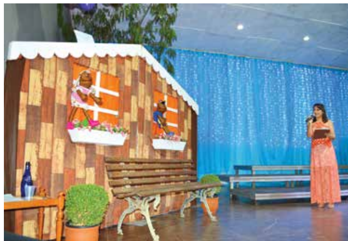
Evento reuniu grande público na noite de quarta-feira, no Plaza Eventos