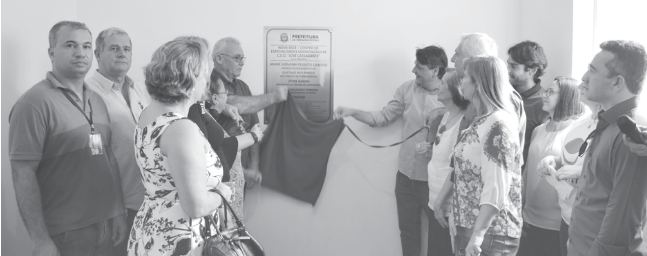
Solenidade de inauguração das novas instalações do CEO

Informar às pessoas sobre a presença de nutrientes críticos não gera riscos ou prejuízos econômicos para a indústria. Pelo contrário, gera o desenvolvimento econômico e social, porque amplia as possibilidades de escolhas alimentares mais saudáveis e promove a competitividade baseada no que é melhor para os consumidores: o atendimento às suas demandas por produtos mais saudáveis. O Idec participa dessa discussão na Anvisa desde o princípio, propondo modelos de rotulagem nutricional adequada com base nessas exigências, e concretizando sua missão de orientar, conscientizar e defender a ética nas relações de consumo, há mais de 30 anos. E não está sozinho nisso: diversos órgãos e entidades públicas e privadas, nacionais e internacionais, acompanham e apoiam essa luta, como o Ministério da Saúde, a Organização Pan-Americana da Saúde, o Instituto Nacional do Câncer, institutos de pesquisa renomados de universidades brasileiras, as entidades e pessoas que integram a Aliança pela Alimentação Adequada e Saudável - todos engajados moralmente com o combate à obesidade e às doenças crônicas não transmissíveis provocadas pelo consumo de alimentos e bebidas com alto teor de ingredientes críticos. A adoção de normas de rotulagem que garantam essa imprescindível informação é um caminho sem volta. É isso o que os cidadãos consumidores querem e o que os governos estão reconhecendo.