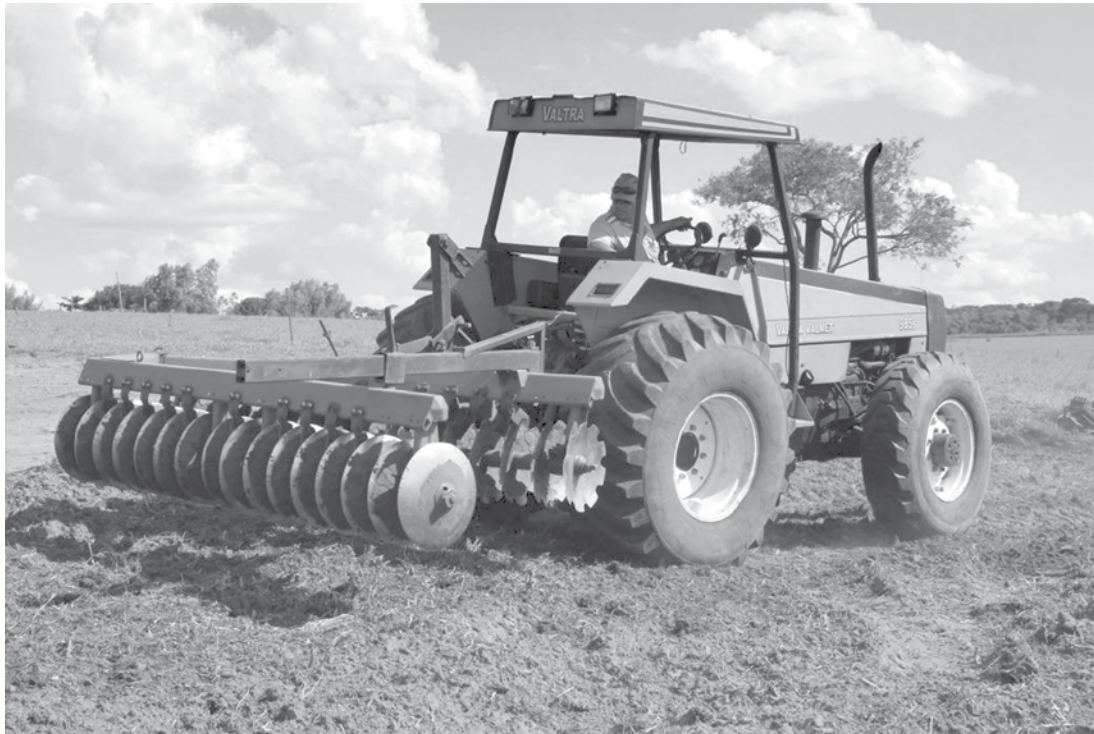
Motoristas e operadores de máquinas vão fazer a prova prática

gem; Advogado do Creas; Fonoaudiólogo e Médico ESF. Os candidatos aos cargos de Motorista e Operador de Máquina/trator, melhores classificados, deverão fazer a prova prática que pretende avaliar a capacidade do candidato em desenvolver as