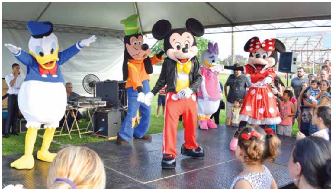
Momentos especiais do evento

Para o prefeito André Pesuto, a festa das crianças foi um importante momento para comemorar a data especial. "Realizamos um evento simples, porém muito bem organizado e com fartura para a garotada e suas famílias, todos comeram e se divertiram muito. No ano que vem, com certeza, faremos uma bonita festa novamente", explanou.