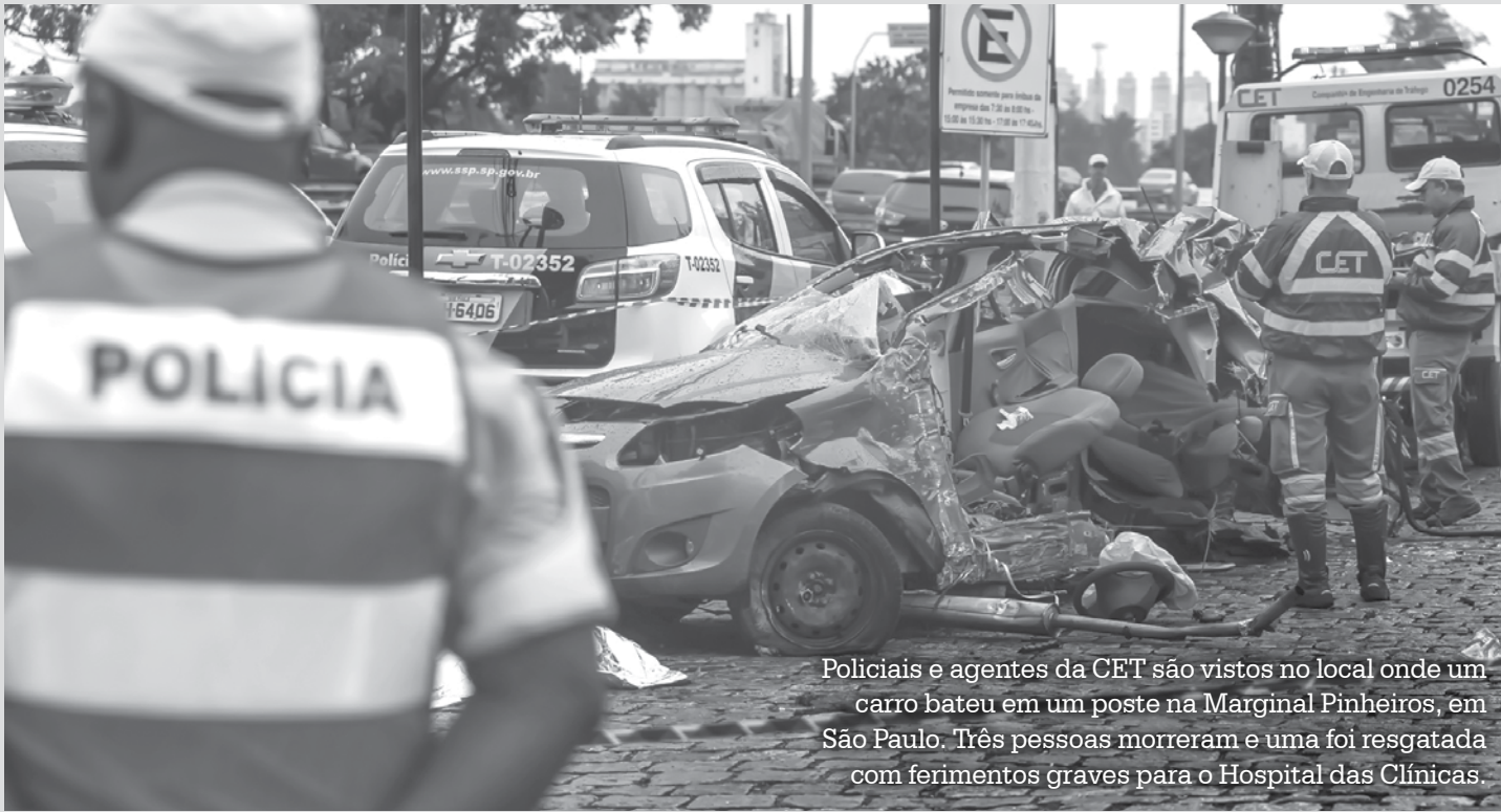
Policiais e agentes da CET são vistos no local onde um carro bateu em um poste na Marginal Pinheiros, em São Paulo. Três pessoas morreram e uma foi resgatada com ferimentos graves para o Hospital das Clínicas.