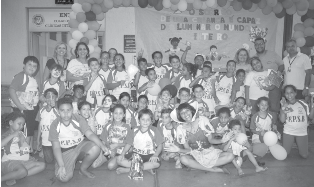
Evento foi organizado e preparado pelo curso de Serviço Social

Em meio ao evento, estavam presentes crianças que frequentam diariamente as Clínicas Integradas, localizada na própria Fundação, que prestam atendimentos à população, e crianças de Insti-