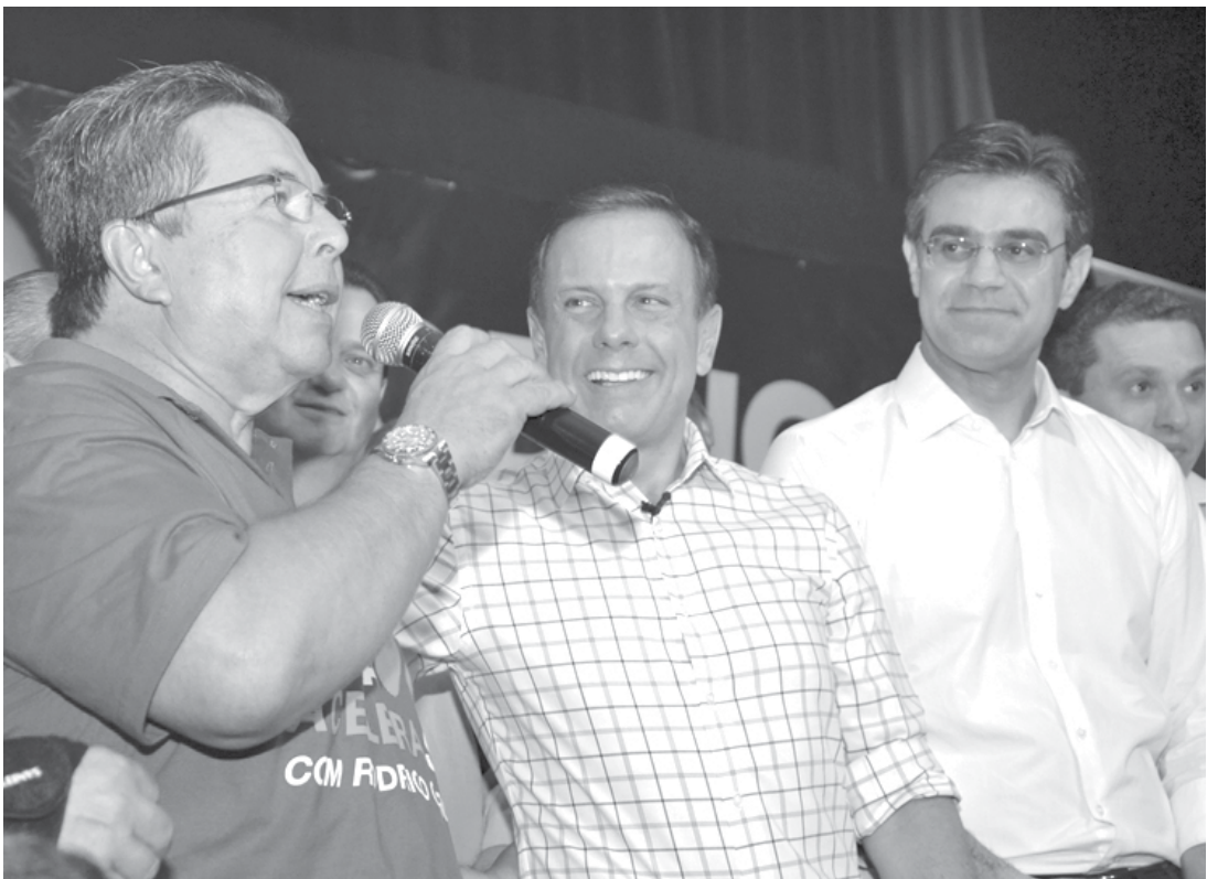
Para o deputado, Doria representa o novo e é a melhor opção para o Governo do Estado

Segundo turno das eleições será no dia 28 de outubro