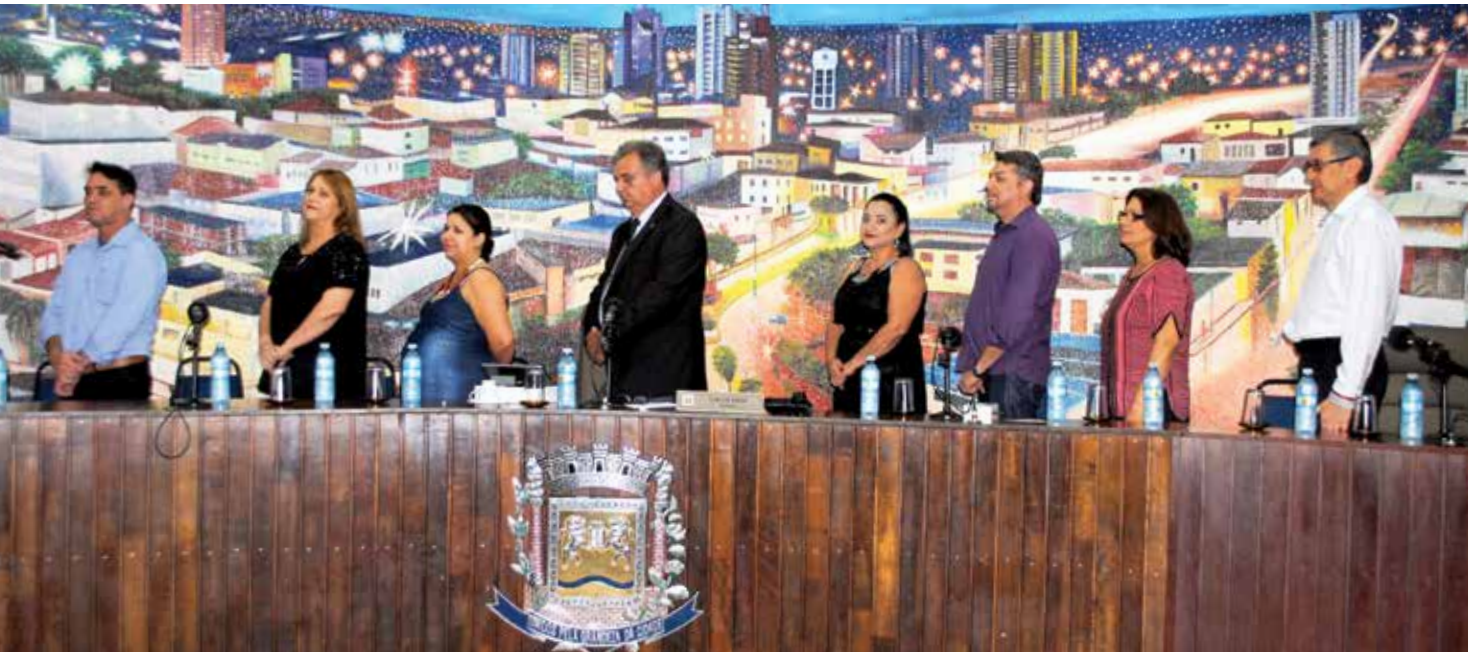
Título é uma honraria aos profissionais que mais se destacaram no transcorrer do ano letivo