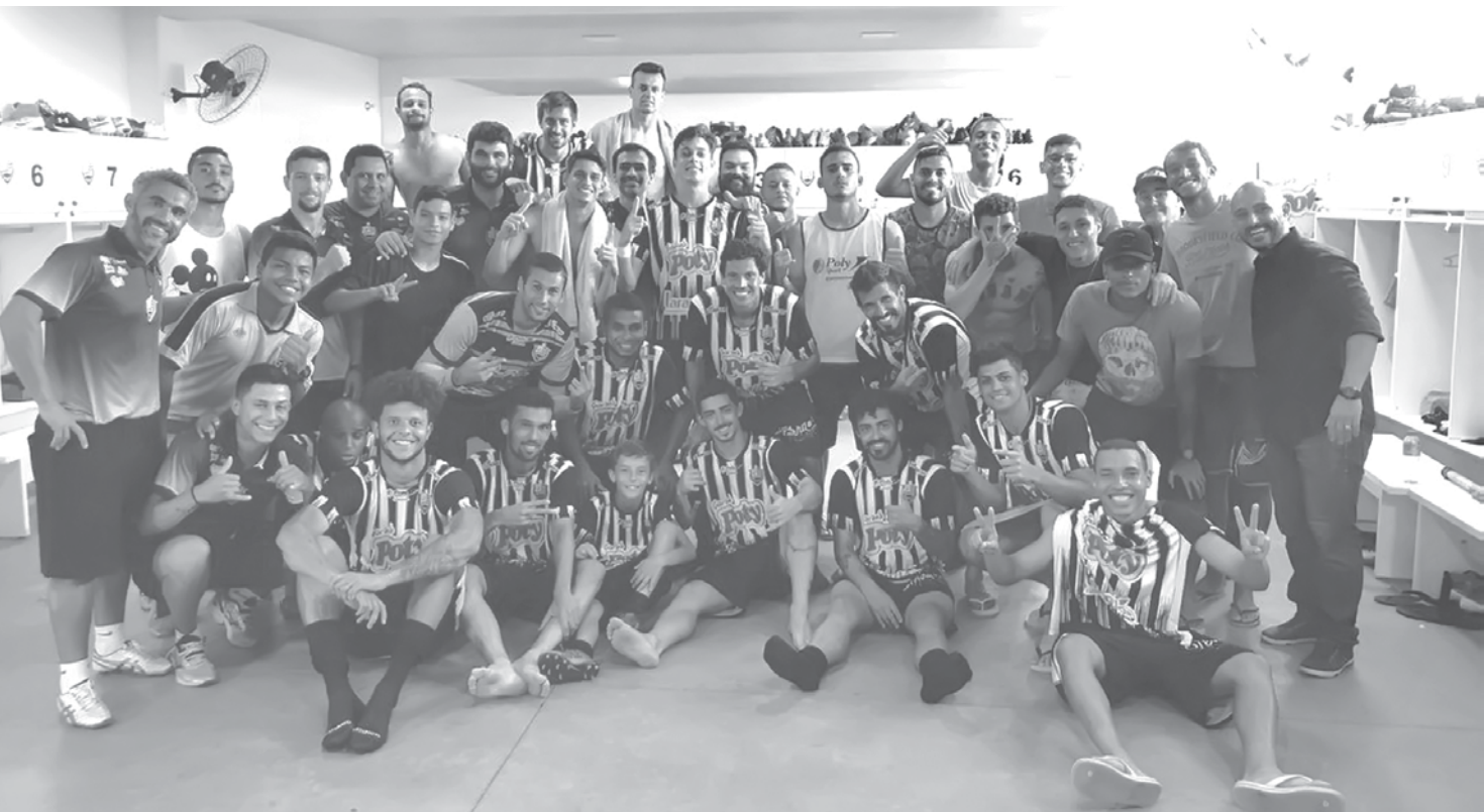
Votuporanguense garantiu a sua classificação ao derrotar o São Caetano, na arena Plínio Marin

Votuporanguense, arquirrival do Fefecê, está na fase mata-mata