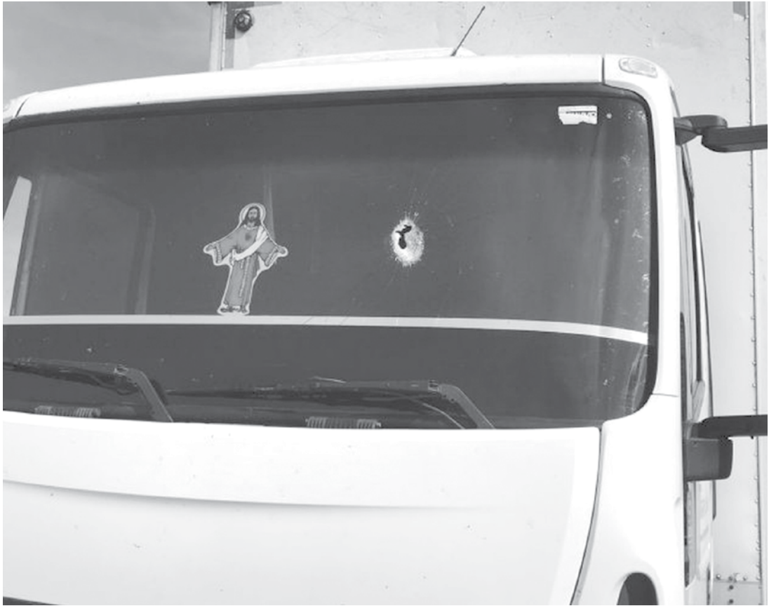
Caminhoneiro morreu após ser atingido por pedra em rodovia de Santa Fé do Sul