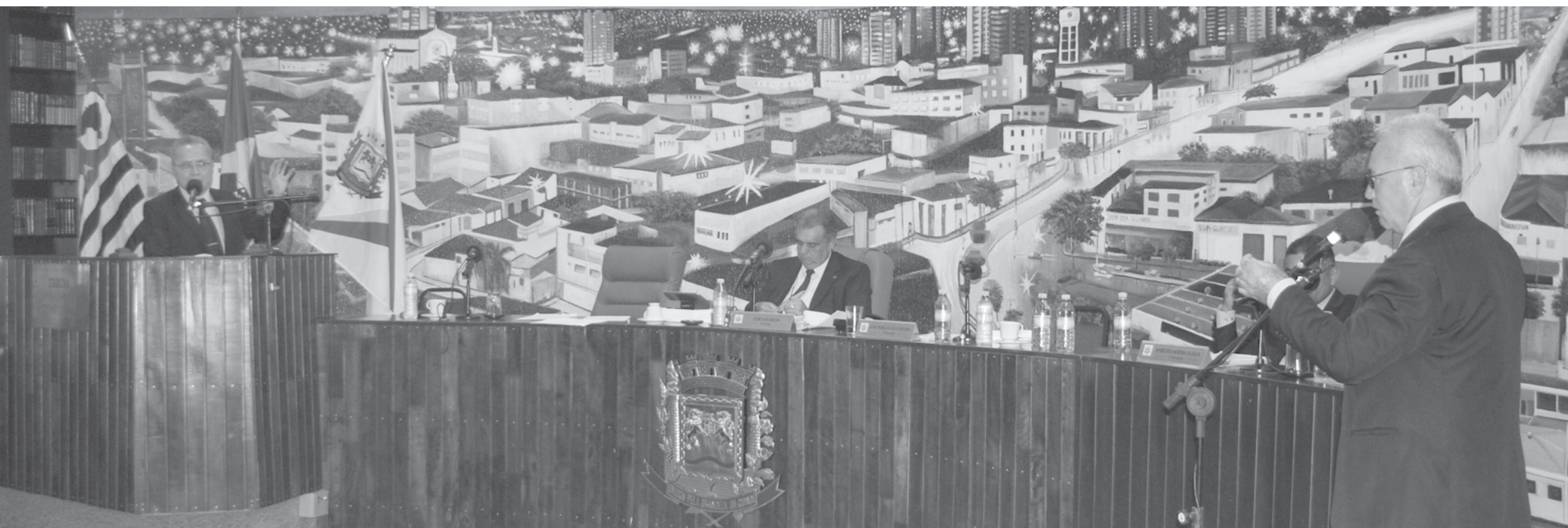
Vereadores aprovam seis projetos e rejeitam dois

→ ASSESSORIA DE IMPRENSA Câmara de Fernandópolis