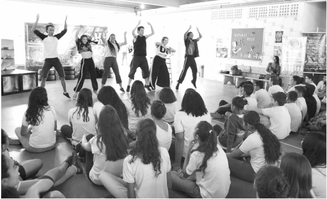
Espetáculo une teatro, música e dança

→ ASSESSORIA DE IMPRENSA Prefeitura de Valentim Gentil