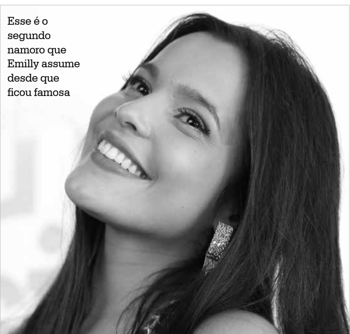
Esse é o segundo namoro que Emily assume desde que ficou famosa