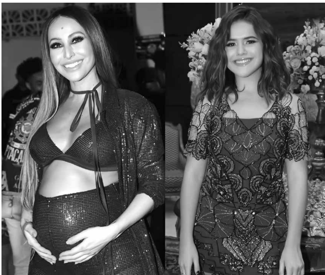
Sabrina Sato participou do ‘BBB’ em 2003; Maisa nasceu em 2002

tinha reparado que ela virou uma mulher. Tá um mulheirão!”, elogiou Sabrina Sato.