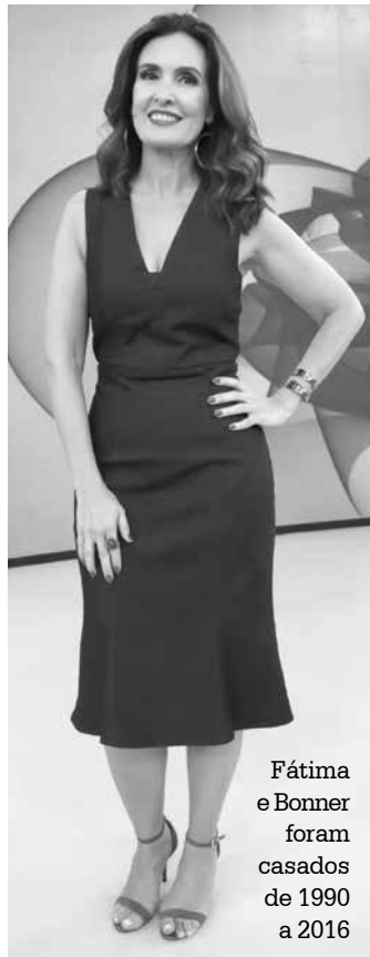
Fátima e Bonner foram casados de 1990 a 2016