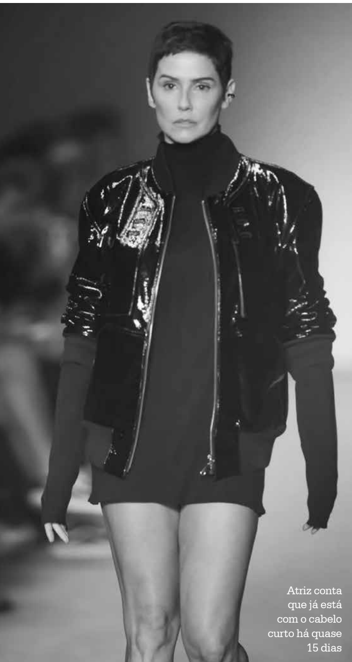
Atriz conta que já está com o cabelo curto há quase 15 dias