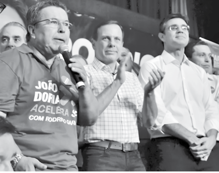
Parlamentar afirma que ambos vão promover uma pacificação do País e do Estado

Uma publicação: Terça-feira, dia 30 de Outubro de 2018. O EXTRA.NET - Edição Nº 3.405.