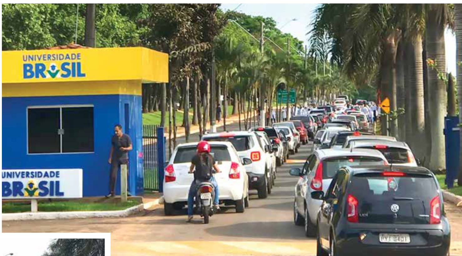
Manifestação aconteceu defronte à faculdade e causou filas de carros na rodovia Carlos Gandolfi

Em contato com a assessoria de imprensa da Universidade Brasil, a reportagem de O Extra.net foi informada de que o grupo específico, que realizou a manifestação na manhã de ontem, deseja fazer o internato em lugares escolhidos por eles e, segun-