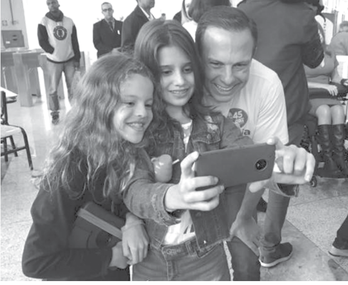
Placar final ficou em 51,75% contra 48,25% de Márcio França

João Agripino da Costa Doria Júnior tem 60 anos, é paulistano, casado com a artista plástica Bia Doria e tem três filhos. Foi secretário de Turismo da Prefeitura de São Paulo (1983-1986), presidente da Embratur (Empresa Brasileira de Turismo) de 1986 a 1988 e filiou-se ao PSDB em 2001, mas só disputou a primeira eleição em 2016, quando foi