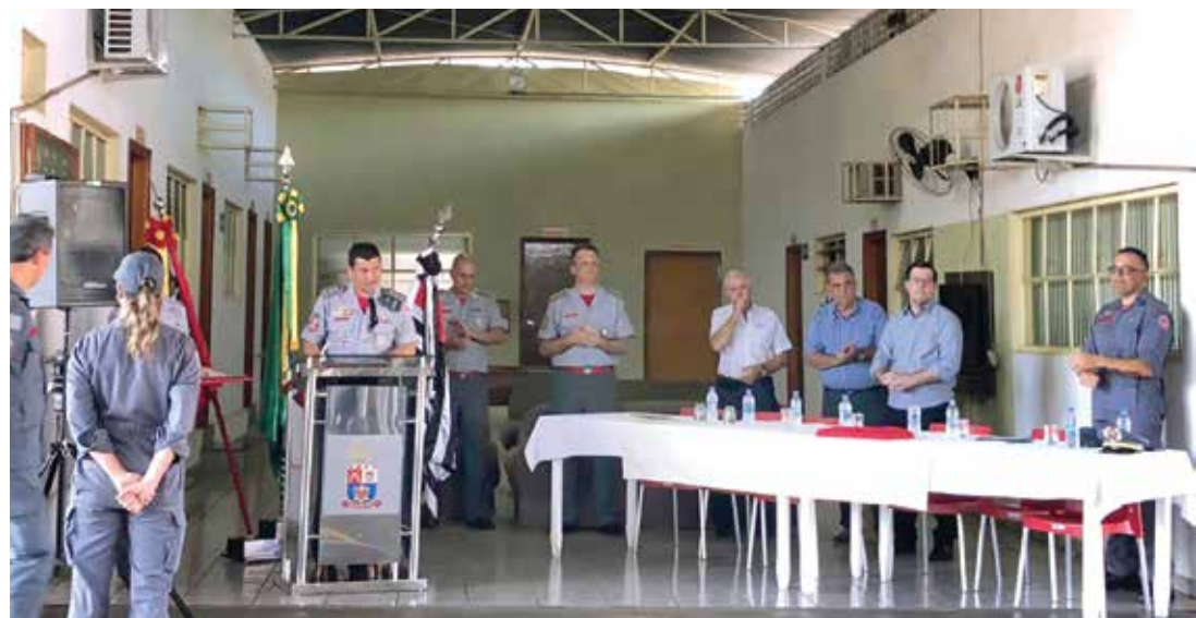
Convidados participando das comemorações de aniversário do Corpo de Bombeiros