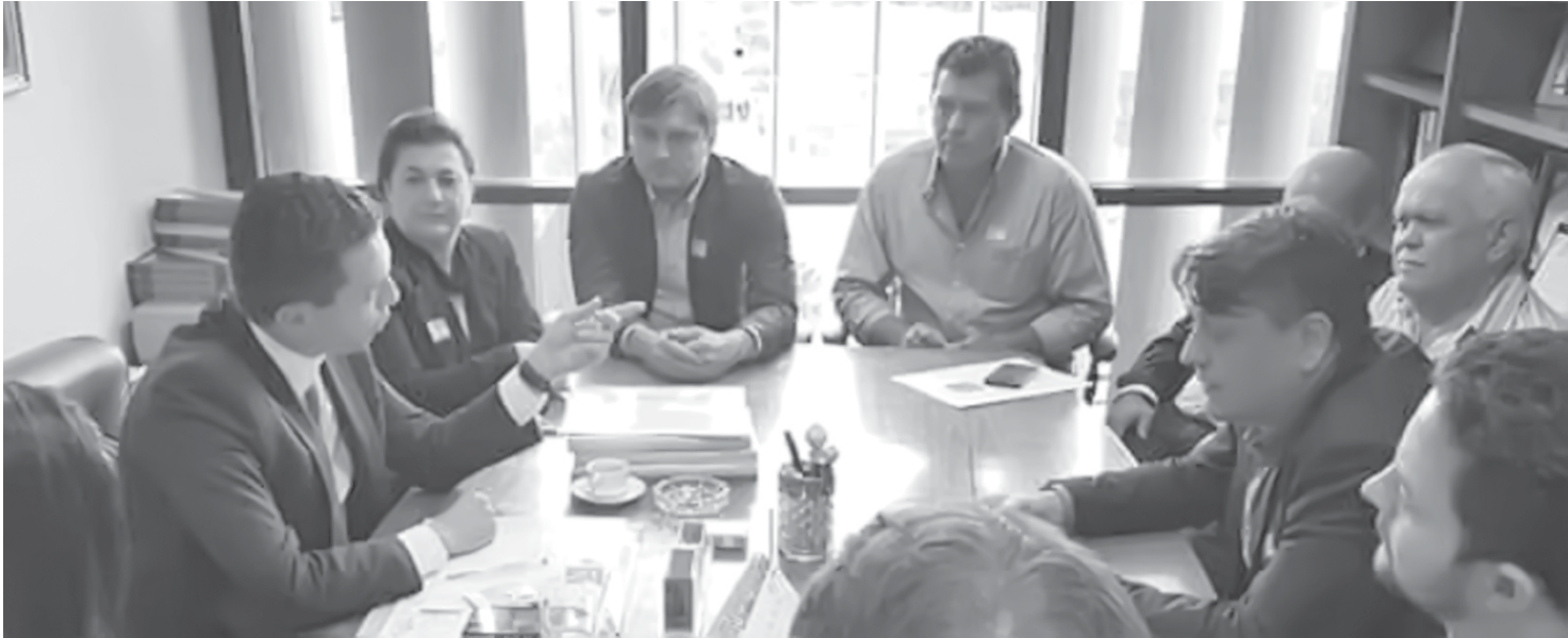
Prefeito reunido no Gabinete do Dep. Pinato em Brasília

O principal encontro ocorreu no gabinete do Deputado Federal Fausto Pinato que recepcionou o prefeito e discutiram novas emendas para o município. “É importante que os gestores tragam para nós de-