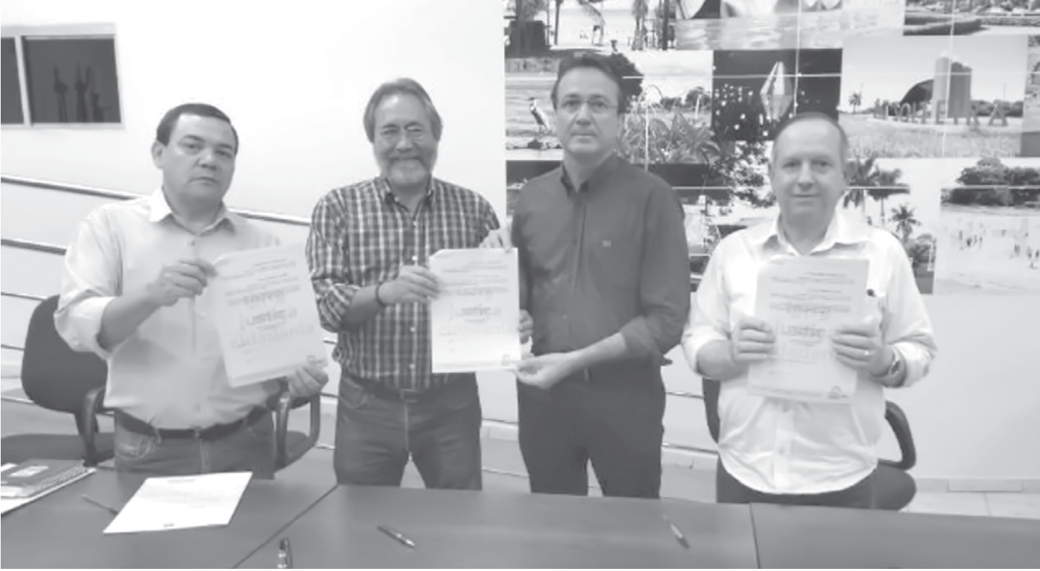
Assinatura aconteceu na cidade de Ilha Solteira

Três publicações: Dias 30 e 31 de Outubro e 01 de Novembro de 2018. 1ª publicação: Terça-feira, dia 30 de Outubro de 2018. 2ª publicação: Quarta-feira, dia 31 de Outubro de 2018. 3ª publicação: Quinta-feira, dia 01 de Novembro de 2018. O EXTRA.NET - Edição Nº 3.407.