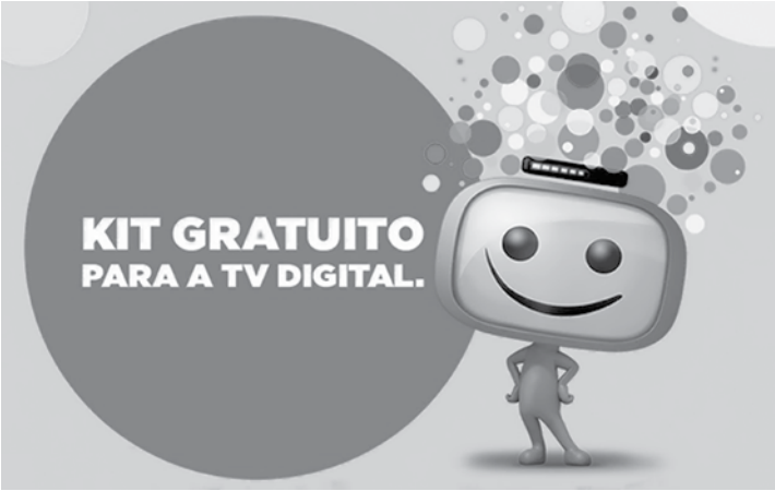
Evento será realizado na Praça Antônio Rastelli, na Cohab Antônio Brandini

bairro em uma ação porta a porta, para tirar dúvidas da população e divulgar o projeto. SERVIÇO: • A ação acontecerá das 16h30 às 20h30, na Rua: Rubens Padilha Meato, esquina com a Paulina Maximiano Duran, na Praça.