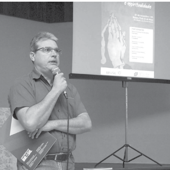
Evento reuniu seis palestrantes, que falaram sobre diversas religiões aos alunos