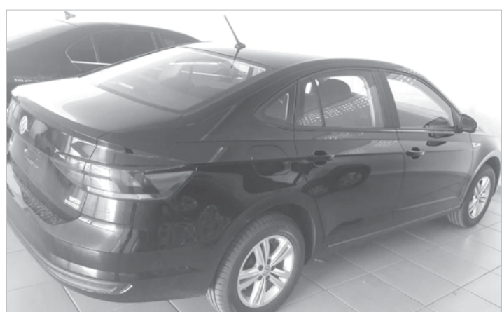
Reformas, moto 0 km, novo carro e presidente ainda prevê devolução de repasse à Prefeitura no fim de 2018