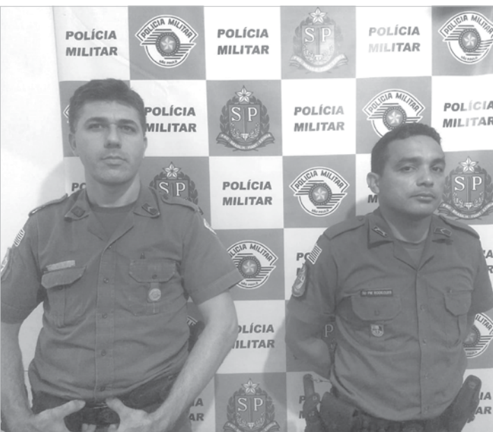
Ocorrência foi atendida pelos policiais militares de Ouroeste