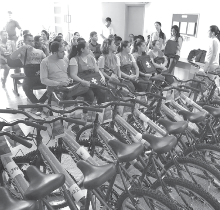
Foram 21 bicicletas conquistadas por meio de uma emenda parlamentar federal

→ ASSESSORIA DE IMPRENSA Prefeitura de Ouroeste