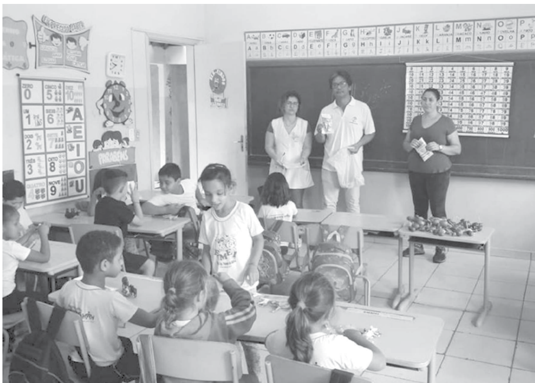
Iniciativa é realizada todos os anos

através deste projeto que é promovido a prevenção à saúde bucal das crianças do município.