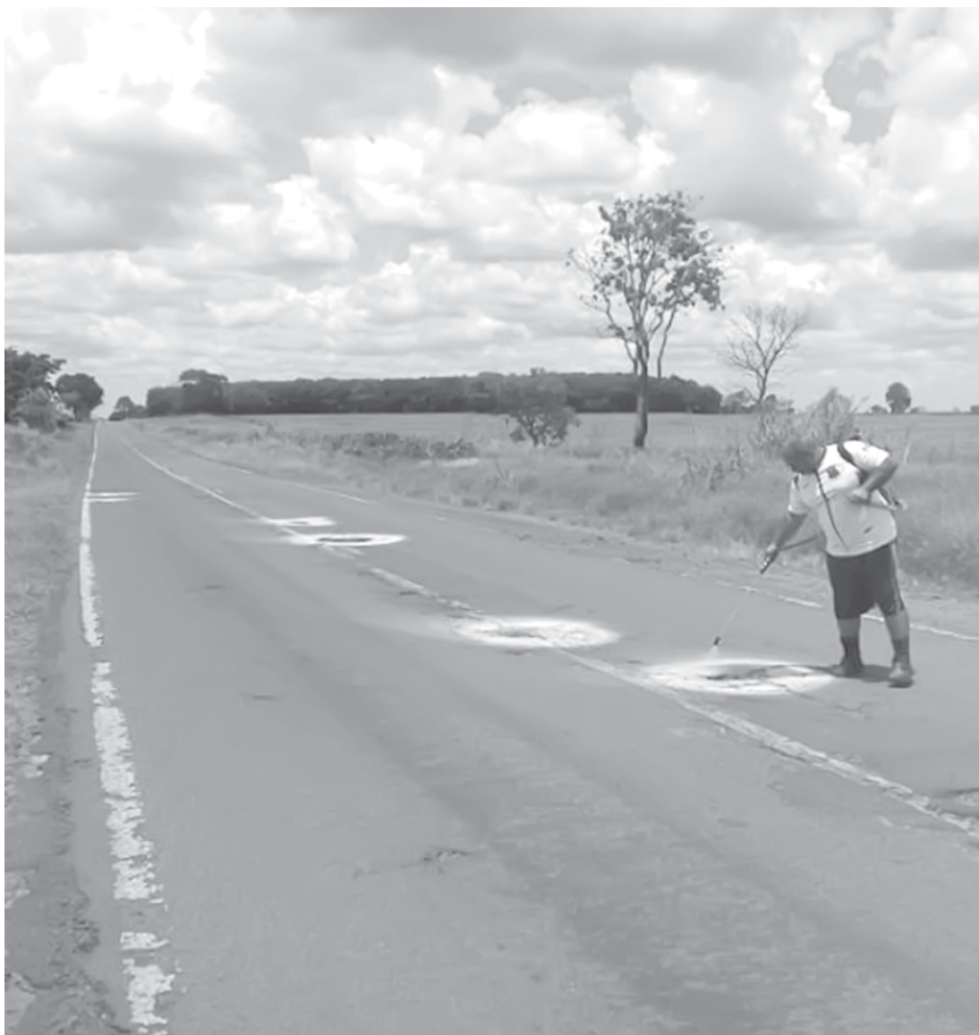
Buracos na pista foram destacados pelos moradores da região

Percy Waldir Semeghini conta- va com conservação de rotina até julho/2018, porém, o esta- do do pavimento já não com- portava serviços pertinentes à conservação de rotina, sen- do realizado em toda a sua ex- tensão serviços de tapa-bura- co e remendo do pavimento, até a finalização do contra- to de conservação. A rodovia está inserida como priorida-