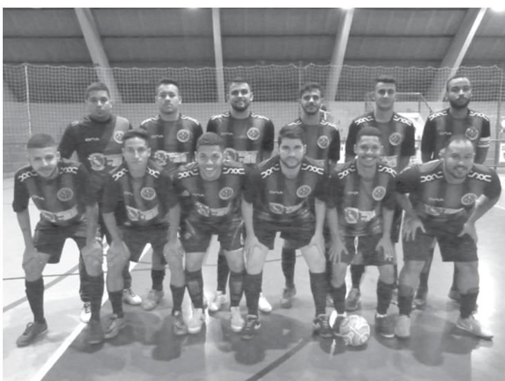
Equipes participantes da Copa

CONFIRA COMO FICOU A SITUAÇÃO DE CADA GRUPO: • Grupo A (Indefinido) Cigão E.C. de Iturama lide-