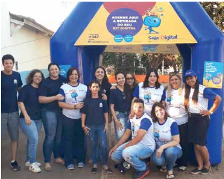
Para maiores informações sobre o Kit Conversor Digital basta procurar o CRAS

Criada pela Agência Nacional de Telecomunicações (Anatel) é uma instituição não governamental e sem fins lucrativos, responsável pela migração do sinal analógico para o sinal digital no país. Esse processo teve início em abril de 2015.