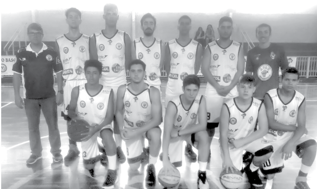
Equipe classificada para a final da Liga

→ SECOM Prefeitura de Fernandópolis A equipe sub-16 da APAB/FEF/ CPP/SMEL conquistou mais um importante resultado em competições. Desta vez a vitória aconteceu no último domingo, 11, quando o time venceu os atletas de Jaboticabal pelo placar de 47 X 24. Com o resultado obtido na partida, o time fernandopolense se classificou para a final da Liga Regional de Basquete de Ribeirão Preto e competirá o título de campeão contra Franca, em uma partida marcada para o dia 1 de dezembro, na quadra da escola EELAS, em Fernandópolis.