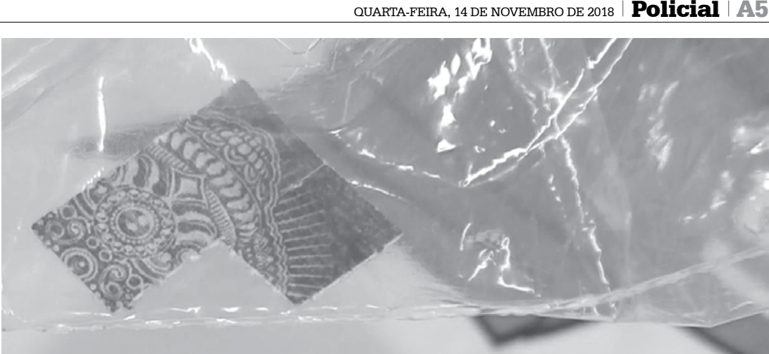
Droga sintética apreendida pela Polícia