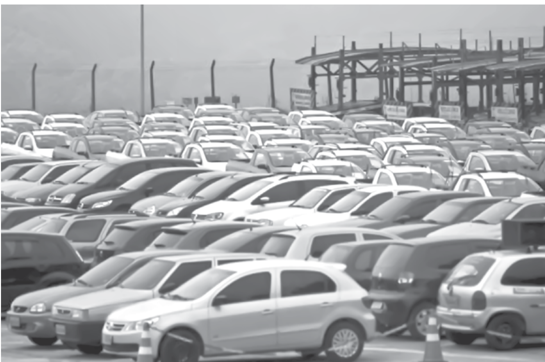
A combinação de taxa de juro, envelhecimento da frota e o começo de uma curva positiva de confiança trouxe a demanda de volta para o mercado