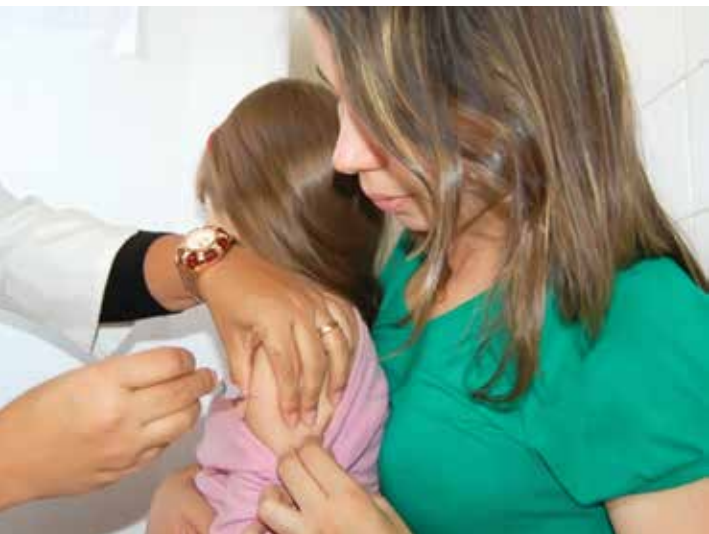
São cerca de 20 tipos de diferentes vacinas oferecidos pela rede pública