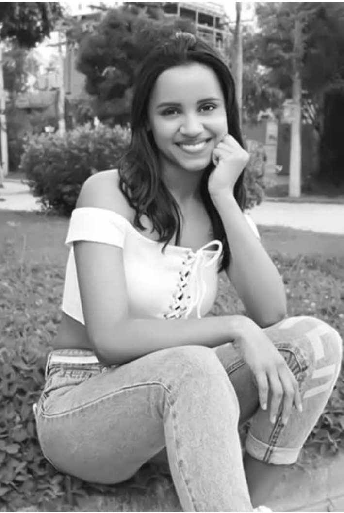
Ela usou parte do R$ 1,5 milhão que ganhou no ‘BBB’ para comprar e mobiliar uma casa para a família