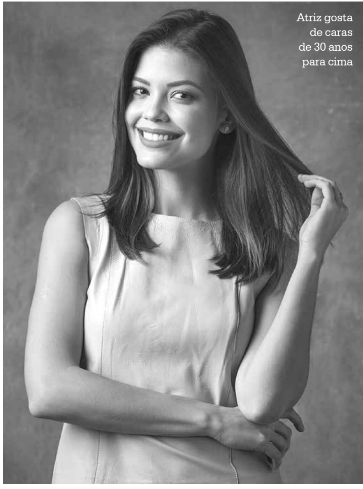
Atriz gosta de caras de 30 anos para cima

prêmio Men of The Year, da revista “GQ” e, em entrevista ao canal GNT, ela e João Vicente falaram sobre as cenas de romance entre Cris e Alain. “A gente trabalha no beijo técnico sim... É só porque em uma cena no chuveiro ele abriu uma boca imensa e parece que ele tá me engolindo, mas não deixa de ser beijo técnico”, afirmou a atriz. “É verdade e é muito importante que seja respeitosa essa relação quando a gente está no set”, completou o intérprete do diretor na novela das seis.