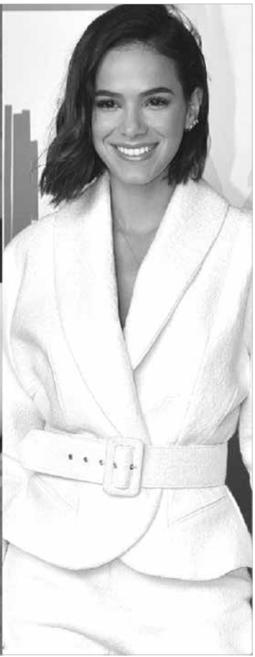
O cantor ficou com elas quando estava solteiro