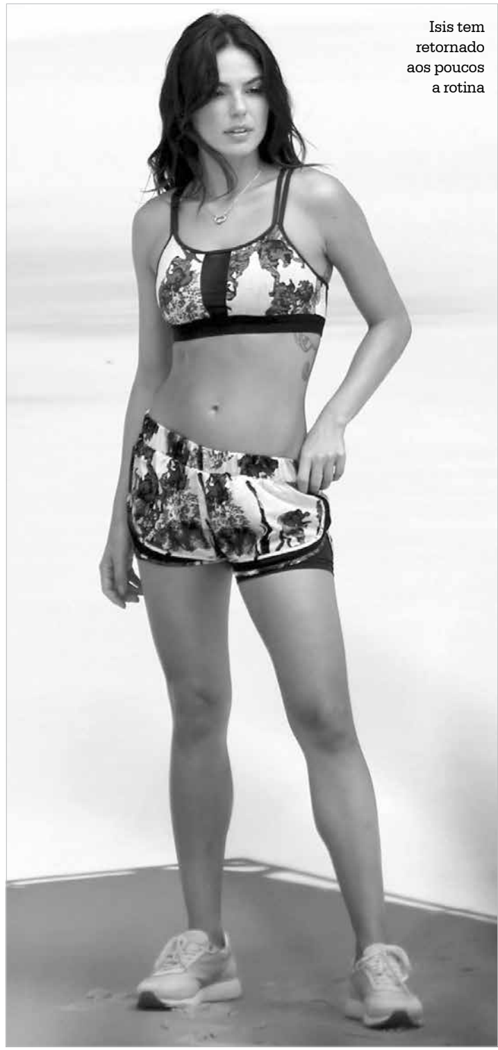
Isis tem retornado aos poucos a rotina