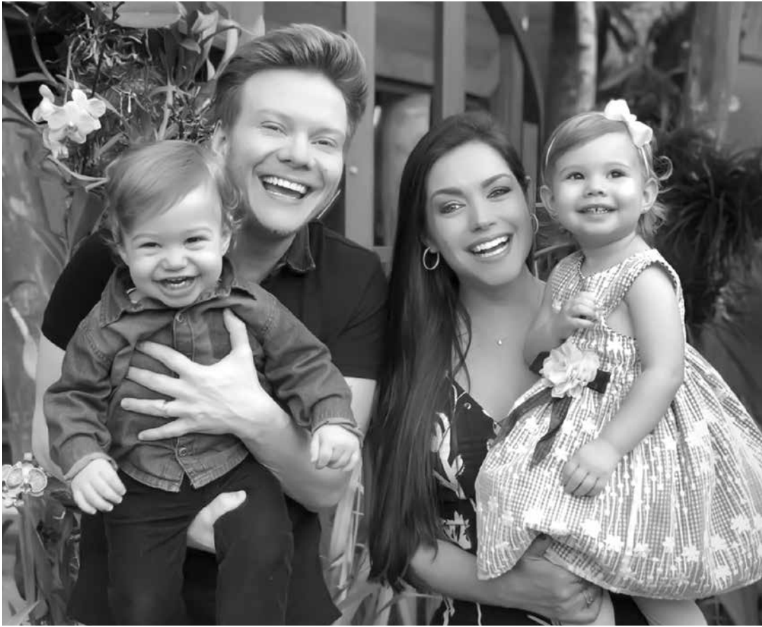
Michel Teló ao lado da mulher e dos filhos