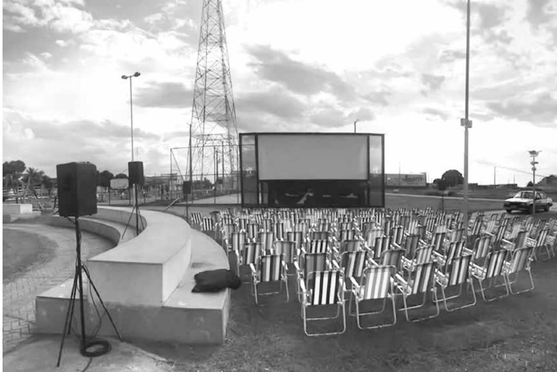
Ouroeste também ganhou revitalização e iluminação em ação promovida pela AES Tietê

ças que brincam nas quadras de campo society enquanto os pais caminham e se exercitam na academia ao ar livre. Ao final, cada voluntário receberá um kit com boné, camiseta e uma almofada para participar das sessões de cinema com todo o conforto. Durante os trabalhos da ação os voluntários terão suco, frutas e barra de cereal para lanche. Serão quatro dias de exibição de filmes atuais, sendo: Extraordinário, Mulher-Maravilha, A Vida é uma Festa, e no domingo o filme mais votado pelo voto popular será exibido. As três opções para votação são: Jurassic Word, Thor Ragnarock e Pantera Negra.