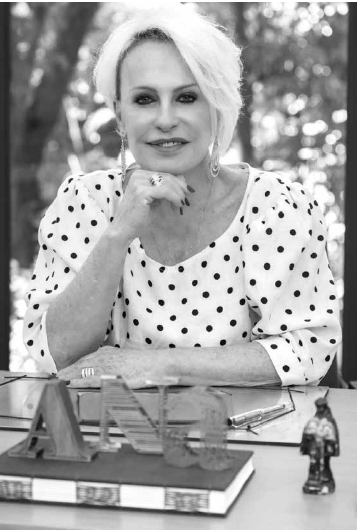
Apresentadora sofreu com a doença em 1991