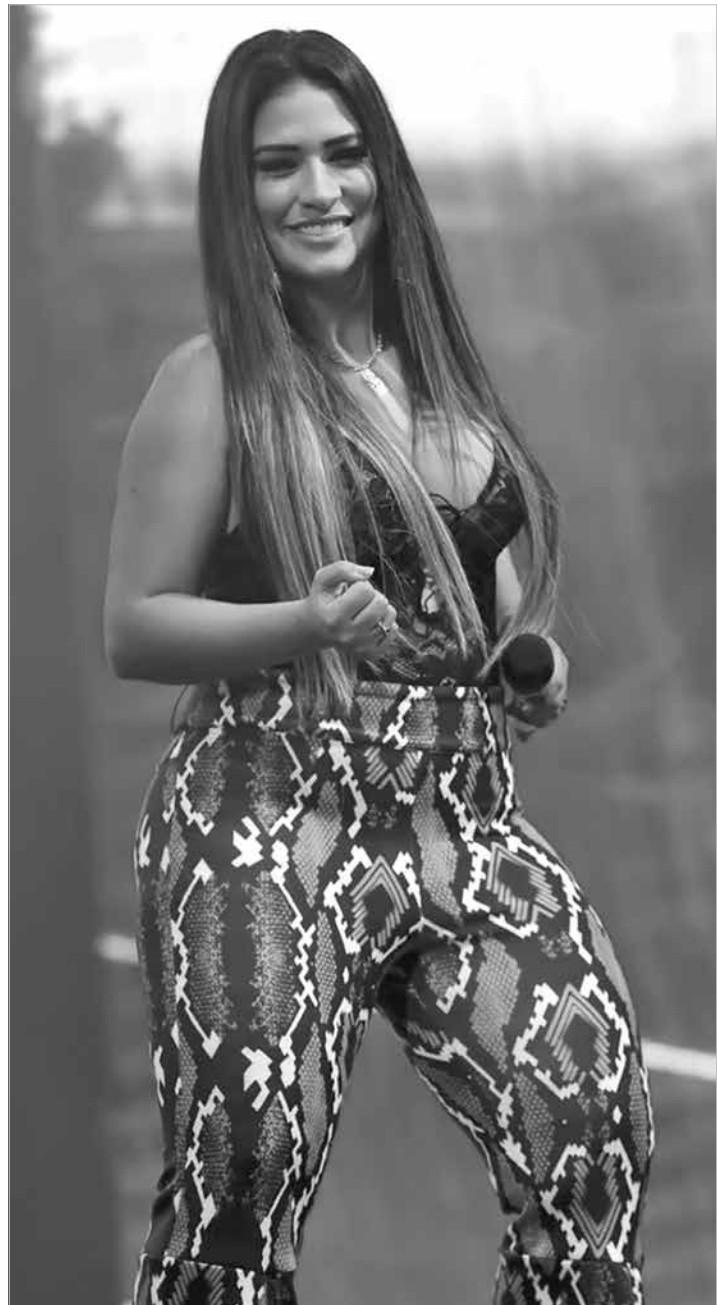
A cantora disse que quando estiver de volta, contará sobre a experiência

Ao relembrar a doença, Ana Maria Braga ainda declarou que poderia ter enfrentado problemas piores. “Eu tive a sorte de não ter uma metástase. As pessoas não acreditam que câncer de pele mata, mas o assunto é muito sério”, disse ela. Além da luta em 1991, Ana ainda enfrentou o câncer por mais duas vezes: em 2001 descobriu tumor na virilha e no reto. Já em 2015, ela contou que passou por uma cirurgia de retirada de tumor cancerígeno no pulmão esquerdo.