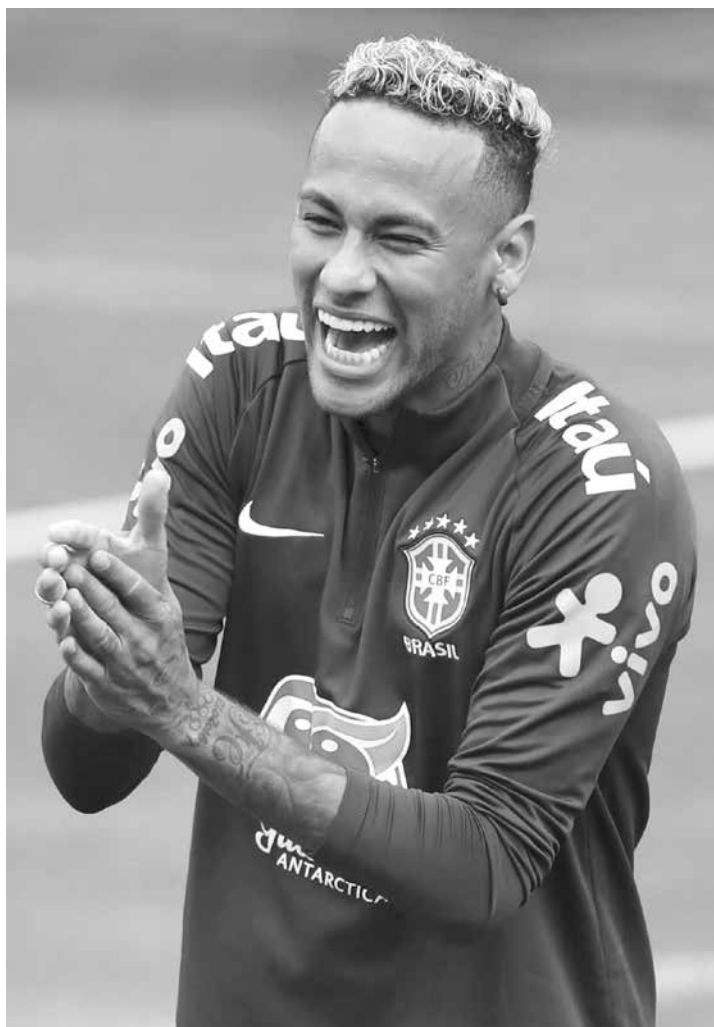
O craque revelou que sempre gostou de mudar as coisas

ra, onde o Brasil enfrentou o México pelas oitavas-de-finais, o jogador ostentou as madeixas castanhas. Para a Liga dos Campeões, em outubro, o craque deu um tapa no visual com o cabeleireiro, Tenório Wagner, responsável pelos looks do craque há anos, e deixou as laterais raspadas e um topete dourado para partida do Paris Saint-Germain contra a Estrela Vermelha. No mesmo mês, o atacante adotou cabelo liso e topete em um treinamento da Seleção Brasileira em Londres enquanto se preparava para enfrentar a Arábia Saudita.