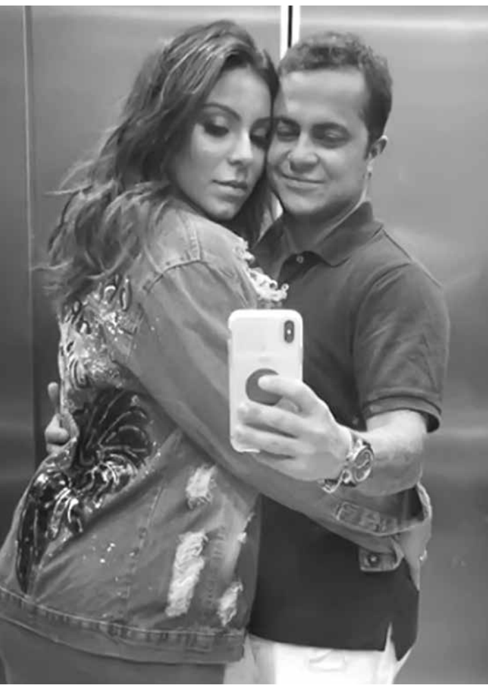
O casal terá um bebê através de um processo de inseminação artificial

Eles ainda revelaram os nomes que já pensaram para o bebê. “Se for menino, queremos Theodoro, Joaquim e Lorenzo. E para menina, Antonella e Manoela”, adianta o casal.