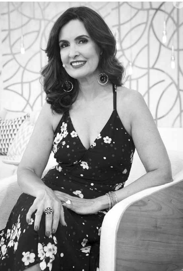
Fátima revelou que faz uso de botox na região da testa

Sobre o período sabático que está vivendo ao lado da namorada, com quem está morando em Indaiatuba, no interior de São Paulo, Guizé comentou: “Estou me adaptando a Indaiatuba ainda. Lá é rápido, perto do aeroporto. Tem uma energia incrível. Tenho vivido muito bem, cuidando dos cachorros, das galinhas, da minha horta”. Apesar de estarem dividindo o mesmo teto - sem, no entanto, terem oficializado a relação - Sérgio garantiu que filhos não estão nos planos imediatos do casal. “Não queremos ser pais agora! Ela tem que trabalhar muito ainda. Ainda não”, negou aos risos.