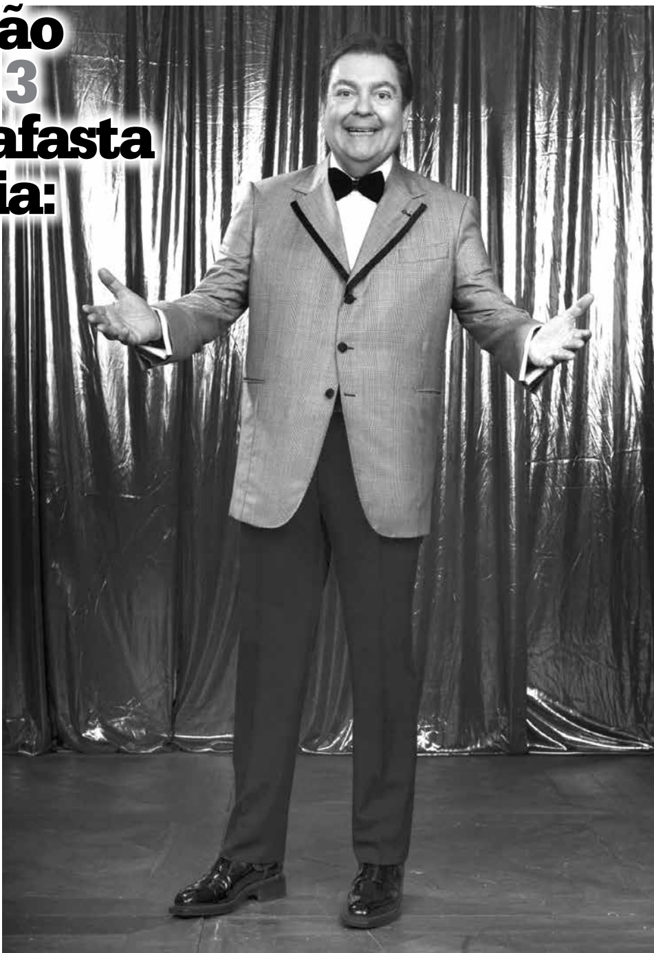
“Tenho filho pequeno, uma pilha de carnê para pagar”, disse Fausto Silva

Casado há 16 anos com Luciana Cardoso e homenageado pela ex-bailarina na rede social, Fausto fala sobre a escolha dos herdeiros. Apesar de não pressioná-los, o apresentador gostaria de ter um sucessor na família. “Tem que ver o que eles querem fazer. Sempre é bom. Se ele tiver vontade, juízo e consciência. Não vou impor, por que é pior. Se o cara não tiver muita consciência do trabalho acaba se expondo demais e é pior. Depois ele vai ver como é a cobrança”, comenta ele nos bastidores do Troféu Melhores do Ano.