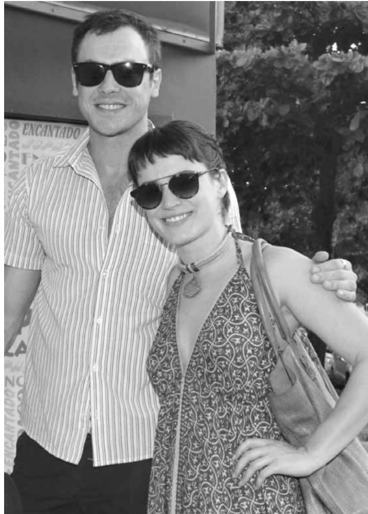
Ter filhos não está nos planos imediatos do casal

kg em apenas sete meses e contou o segredo para perder peso recentemente: “Eu primeiro aumentei a carga de exercício. E também a alimentação. Não sou uma pessoa de comer bobagens nos intervalos. Eu preciso comer de 3h em 3h. Tirei muito do arroz branco, que não me agrega em nada. Quando tenho que comer, coloco o feijão sobre os legumes. À noite, por orientação, eu diminuí muito os carboidratos”. Segundo a apresentadora, foi difícil retirar pão e doces do cardápio: “A primeira semana é muito difícil de diminuir o carboidrato. As pessoas falavam e eu pensava: ‘Não vai rolar porque eu amo pão, biscoito, massa’. Mas não, se você vai diminuindo, o corpo vai exigindo menos de você”.