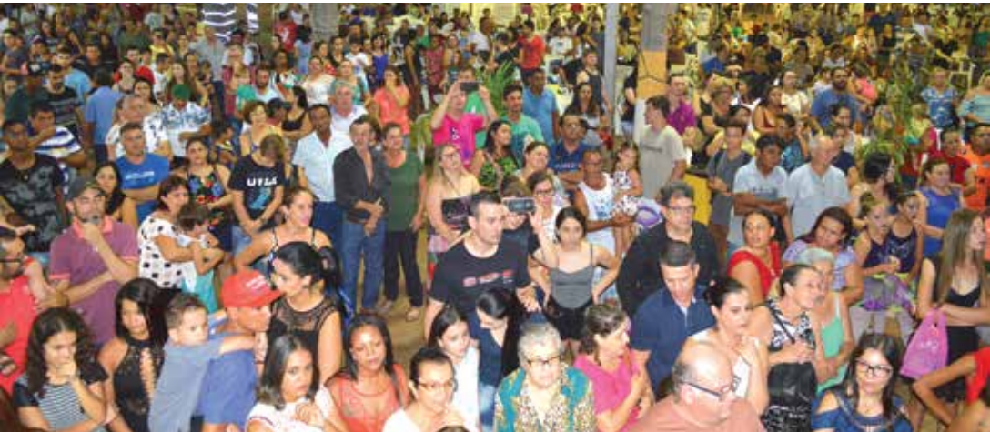
Público presente na noite da última quarta-feira