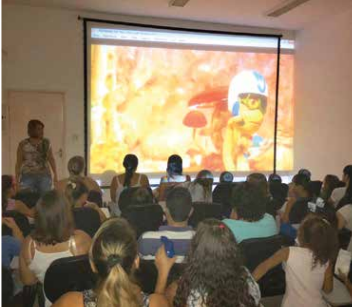
Projeto é realizado através de um sistema de parceria

lefone (17) 3843-1481 e Cel. (17) 99642-0330. As sessões acontecem todas as quintas-feiras às 19h30, com direito a pipoca, em uma sala climatizada com equipamento de cinema.