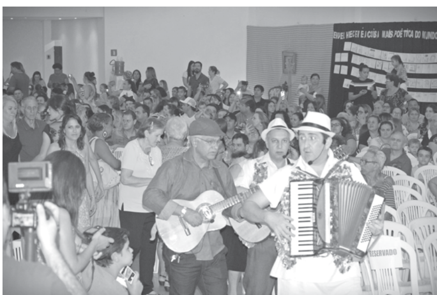
Música utilizada nas apresentações tem o título “Vem para o CRAS”