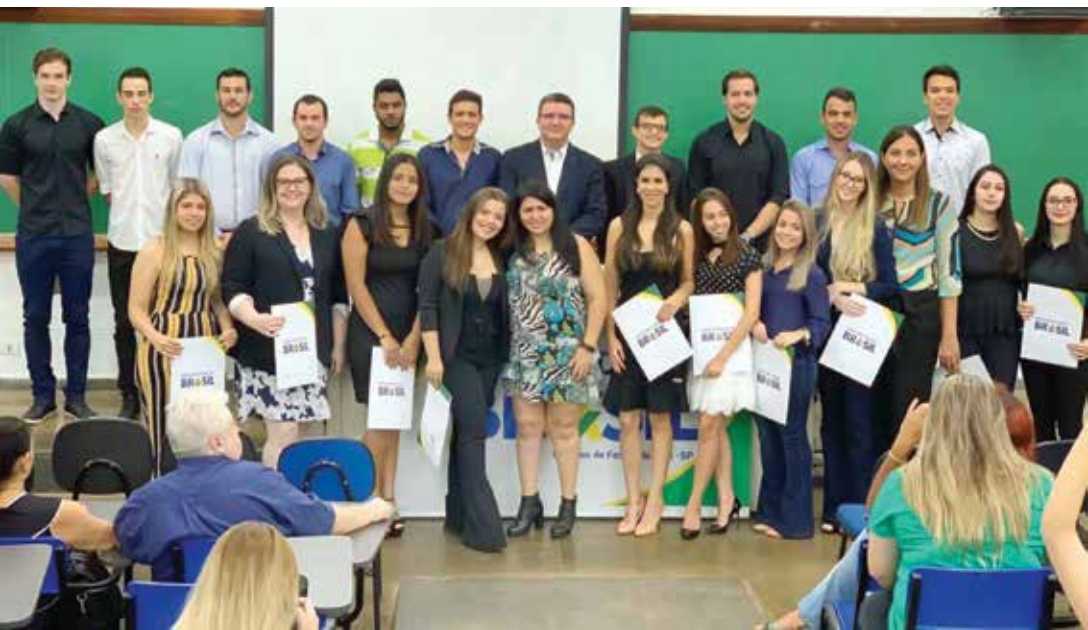
Familiares e amigos prestigiaram a outorga de grau dos 23 acadêmicos

Piratininga não poupou elogios ao reconhecer o desempenho da turma. “Estamos felizes e, claro, muito orgulhosos pelo desempenho maravilhoso dos nossos acadêmicos. Esse, com certeza, é um dia memorável, tanto para a instituição quanto para todas as famílias aqui presentes”, destacou.