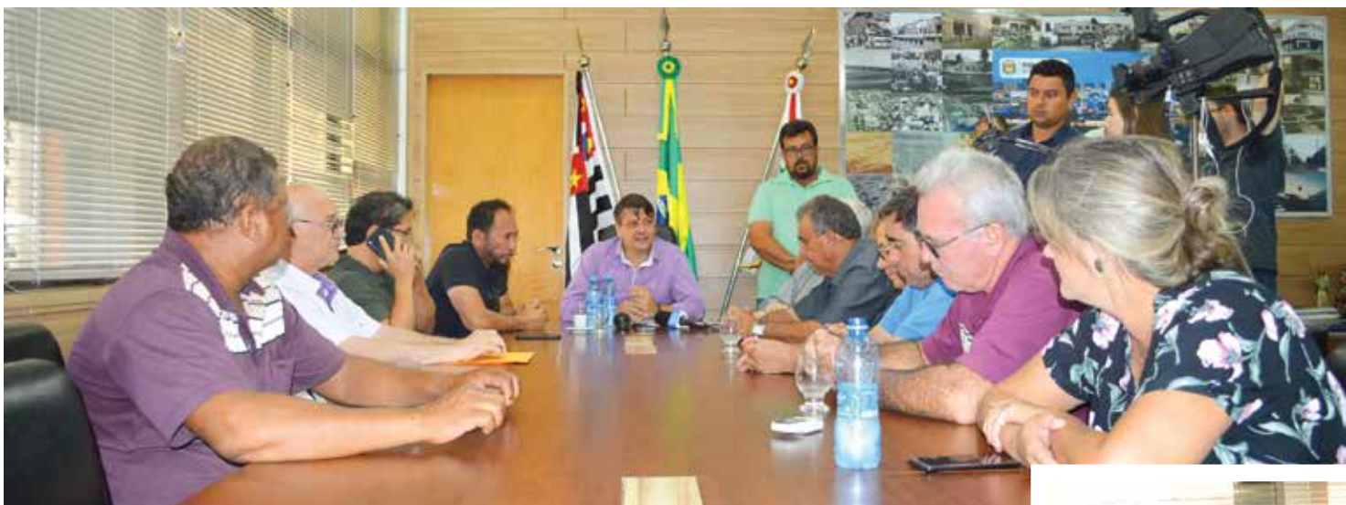
Proposta é que o grupo Arakaki construirá a represa e um parque ecológico no córrego da Aldeia

A proposta é que o grupo Arakaki construirá a represa e um parque ecológico no córrego da Aldeia, tornando o lugar uma das mais significativas áreas de lazer de Fernandópolis. Em troca deste benefício ao local, a Prefeitura descontará da empresa cré-