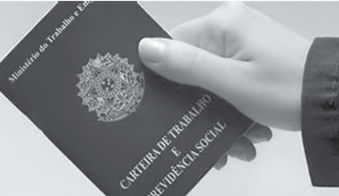
Medida deverá ser implementada em seis meses

→ ASSESSORIA DE IMPRENSA Ministério do Trabalho