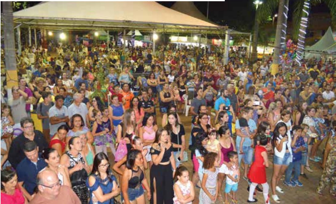
Fernatal atrai grande público na Praça central da cidade