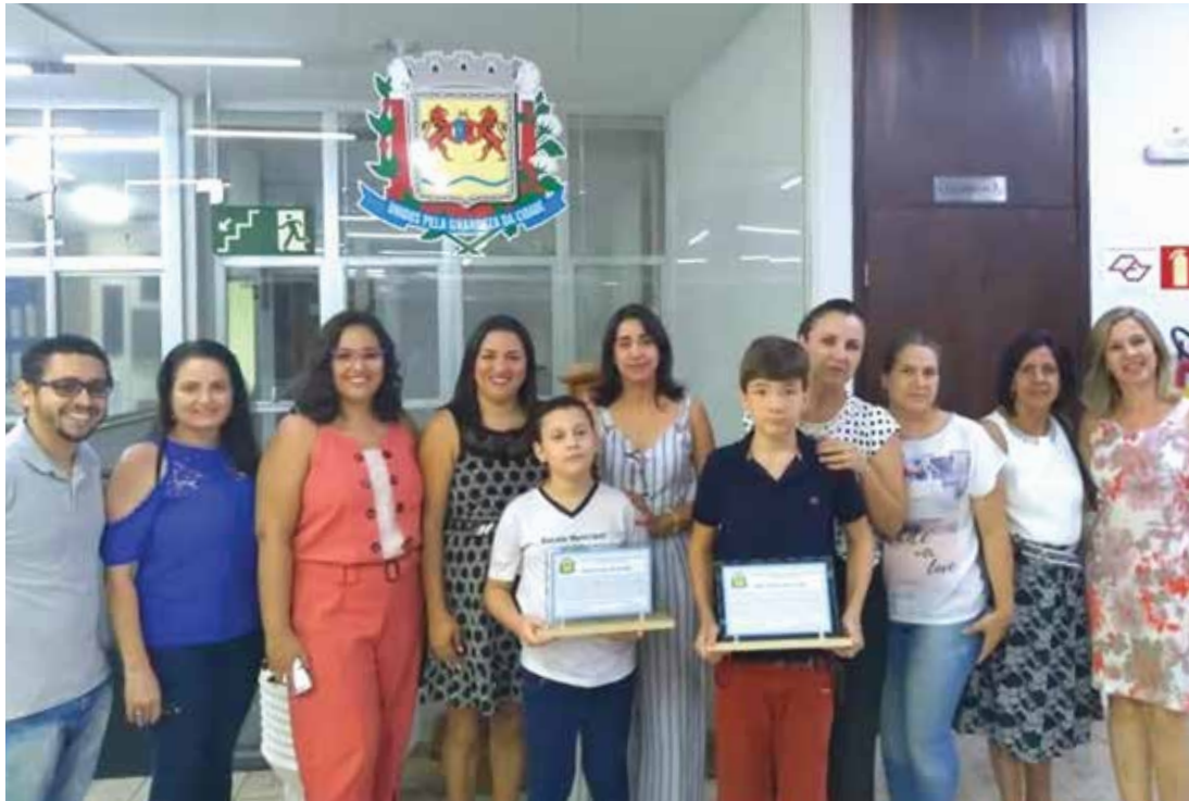
Alunos de Fernandópolis destaques na OBMEP