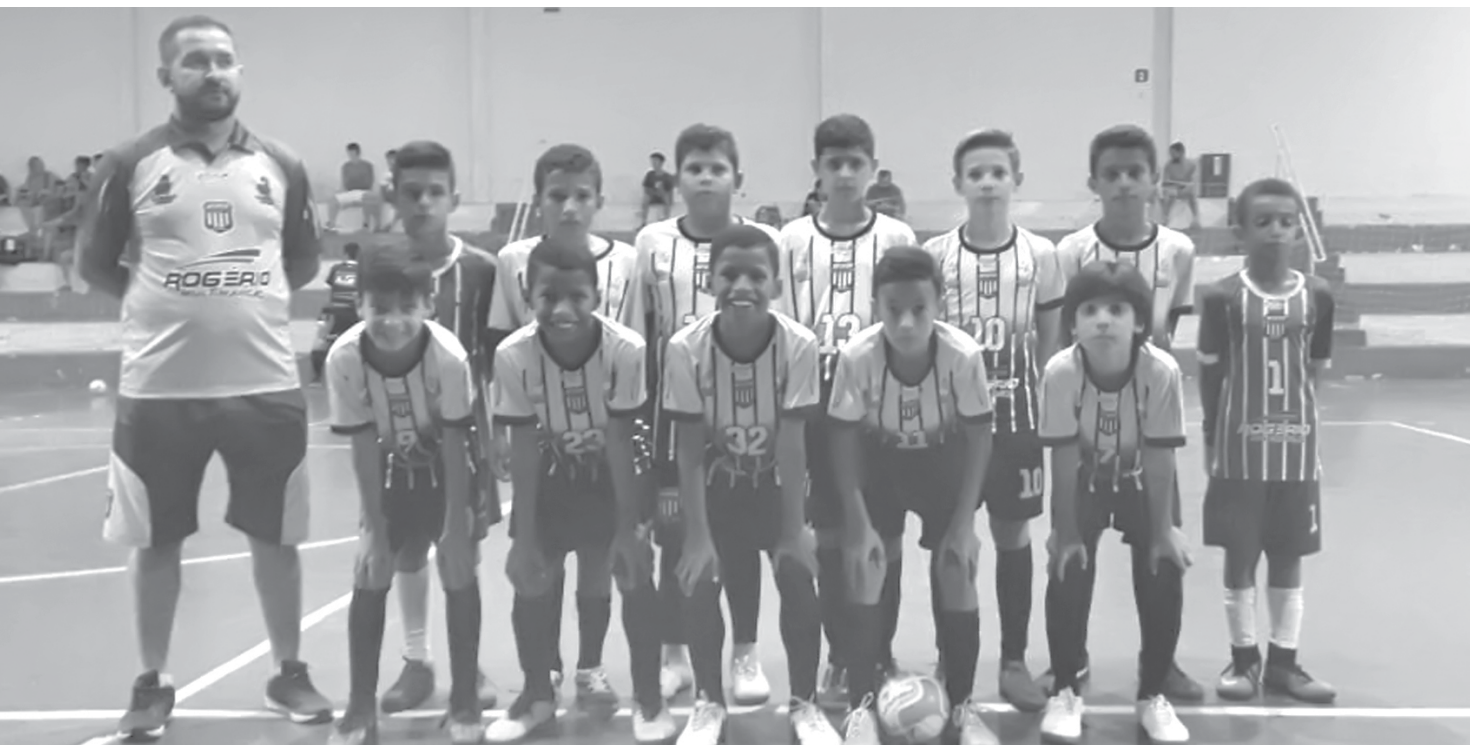
Os títulos vieram depois das finais realizadas no ginásio Paraíso

Além do título na competição, equipe sub-10 do Futsal termina o ano invicta