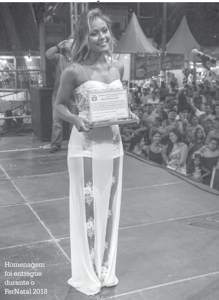
Homenagem foi entregue durante o FerNatal 2018