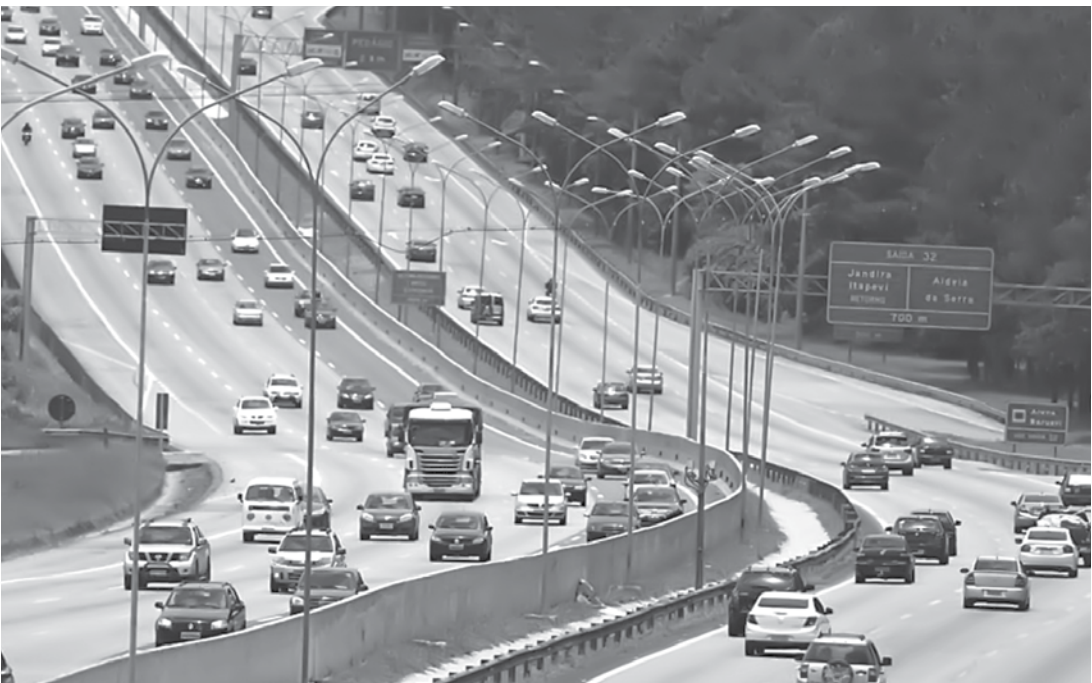
Saída para o Natal deve ter maior movimento entre 12h e meia-noite de sexta-feira

Para viajar com conforto e segurança, alguns cuidados são importantes e começam antes mesmo de sair de casa. Verificar os freios, amortecedores, luzes, óleo e pneus, inclusive a calibragem, são condições básicas para pegar a estrada. Os níveis da água do radiador e do limpador de para-brisa devem ser checados. É importante manter a documentação do veículo e do motorista em dia. Além disso, o condutor não deve esquecer os equipamentos obrigatórios como macaco, chave de roda, triângulo para sinalização e estepe. É essencial que o motorista tenha descanse no dia