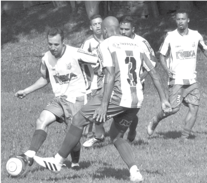
Na quinta-feira, o elenco treinou em dois períodos