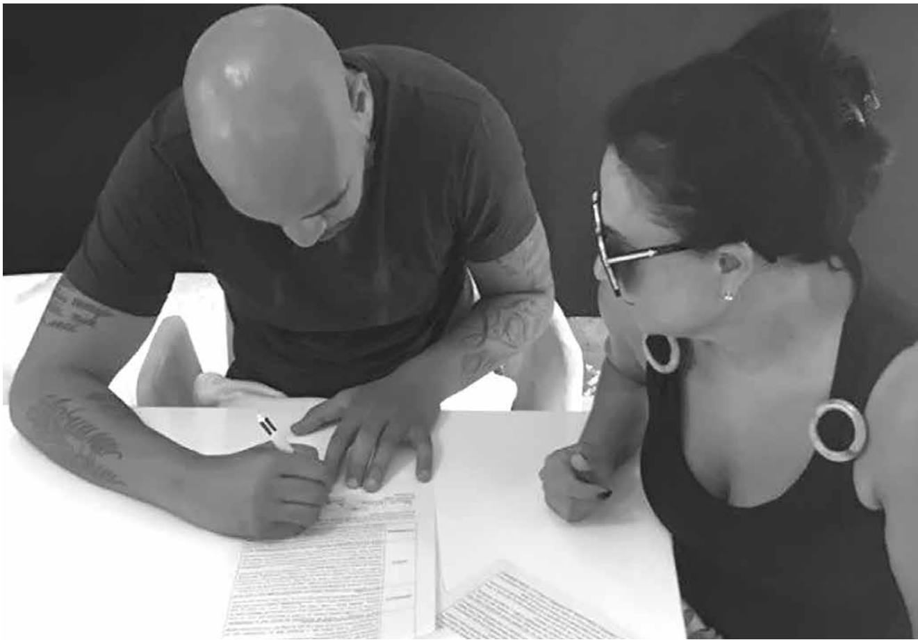
Contrato foi assinado no Rio de Janeiro

ca, na Zona Oeste do Rio, e teve direito a comemoração com champanhe. Esta não será a primeira vez de Didico num filme. Ele já participou de um outro documentário. O craque falou sobre suas experiências como jogador e o racismo em "O negro no futebol brasileiro", do canal HBO. Numa parte do depoimento, Adriano conta que passou por uma situação que o constrangeu: "Um dia fui parado numa blitz e me liberaram por eu ser o Adriano. E se eu não fosse? O que fariam? Isso me dói".