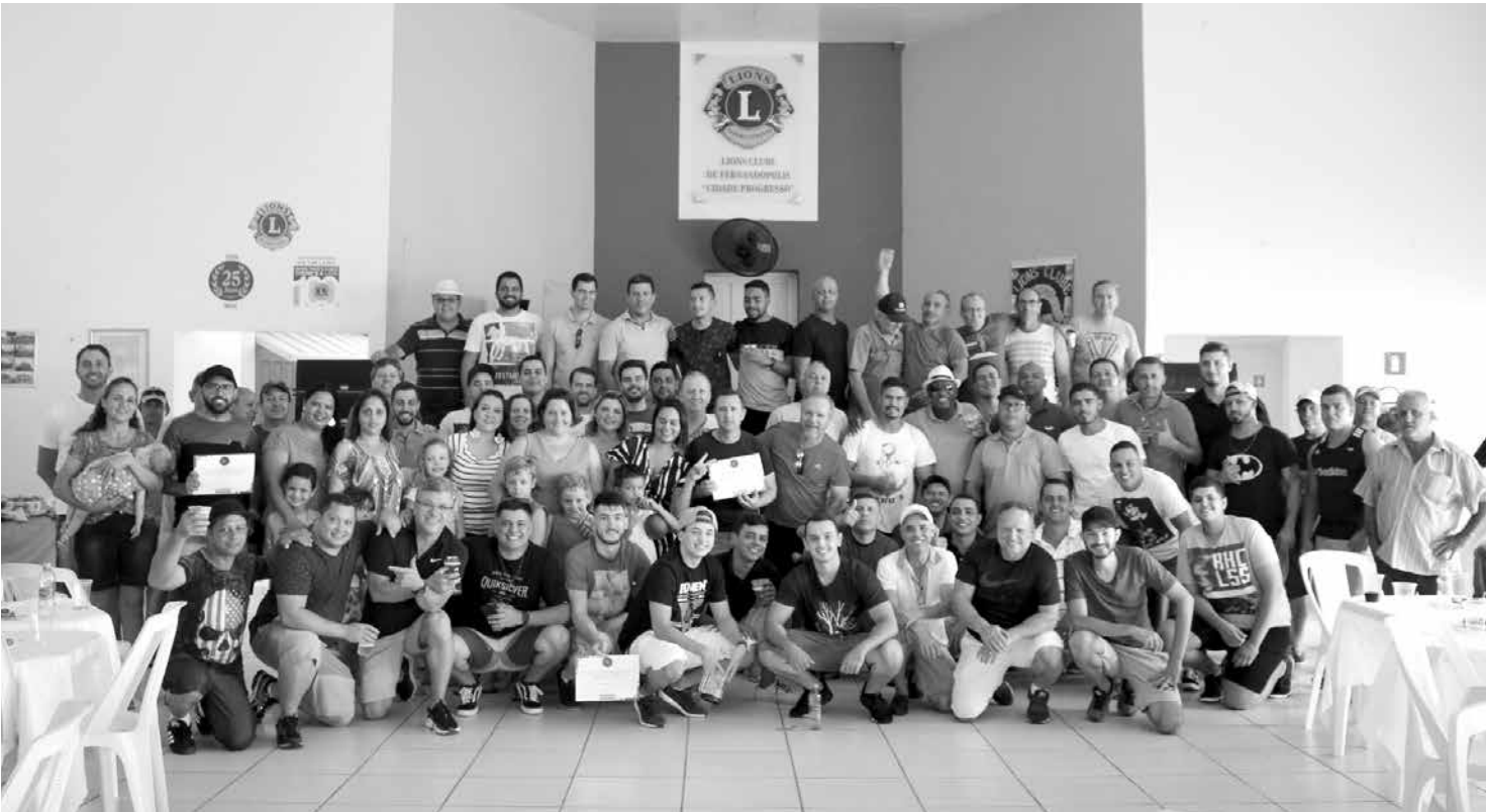
Durante o encontro, a diretoria e os colaboradores da empresa celebraram as conquistas de 2018

ído um mimo para todos os colaboradores. “As festas de confraternização de final de ano são tradicionais na Deaço e é um momento de agradecer nossos colaboradores pela dedicação e parceria ao longo do ano que se finaliza. Esse evento é marcado sempre por muita alegria e sensação de dever cumprido”, destacaram os diretores da Deaço. A partir de 21 de dezembro, a Deaço entrará em recesso coletivo e voltará às atividades normais em 7 de janeiro de 2019.