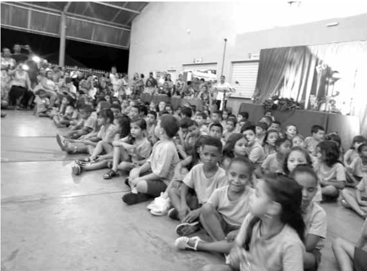
Eventos comemorativos de encerramento variaram entre atrações de apresentações e exposições de trabalhos pedagógicos