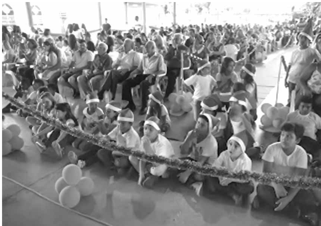
Projeto foi realizado entre abril e novembro deste ano