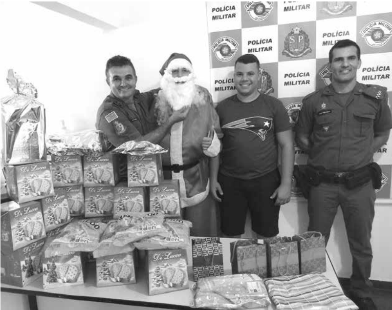
Ação foi realizada durante a semana