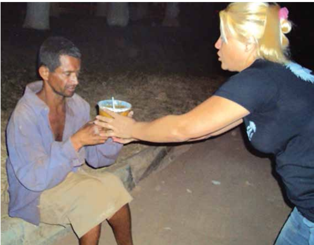
Morador de rua recebe alimentos do grupo fernandopolense durante a ceia

Quem quiser ajudar os voluntários as informações a respeito do grupo podem ser conferidas na página do Facebook do “Ronda do Bem”.