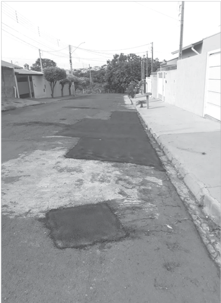
Nesta semana ações foram intensificadas em mais de dez bairros da cidade