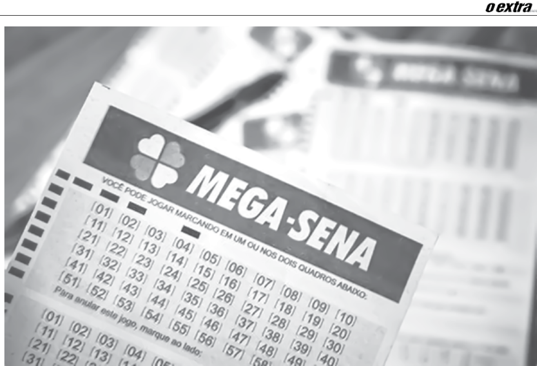
As apostas podem ser feitas até as 19h do dia do sorteio

O próximo concurso da Mega-Sena será realizado sábado, 12. As apostas podem ser feitas até as 19h (horário de Brasília) do dia do sorteio, em qualquer casa lotérica credenciada pela Caixa em todo o país. O bilhete simples, com seis dezenas, custa R$ 3,50.