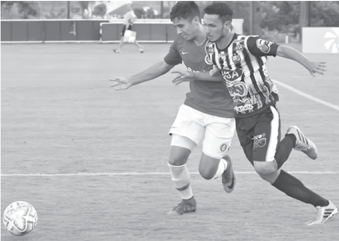
O Internacional venceu o CAV e segue para a próxima fase, que será disputada em Votuporanga