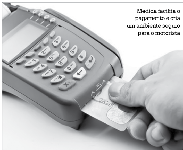
Medida facilita o pagamento e cria um ambiente seguro para o motorista

Os recursos do imposto são investidos pelo governo estadual em obras de infraestrutura e melhoria na prestação de serviços públicos como os de saúde e educação.