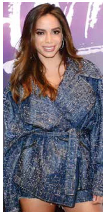
A cantora se inspirou na ativista Luísa Mell

pre bom receber todo tipo de informação e buscar sua própria verdade", incentivou a intérprete do hit "Veneno".