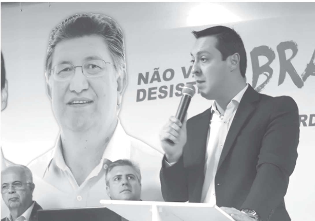
Ex-presidente do PSB de Fernandópolis aunciou nesta semana sua saída do partido

trazendo conquistas importantes para a cidade”. Segundo ele, a decisão de deixar o partido vinha amadurecendo há algum tempo. “Não posso negar que o não cumprimento da palavra de França a respeito da ZPE pesou na decisão, mas a desfiliação era algo que eu já estava pensando em fazer antes mesmo das eleições de 2018”, explica.