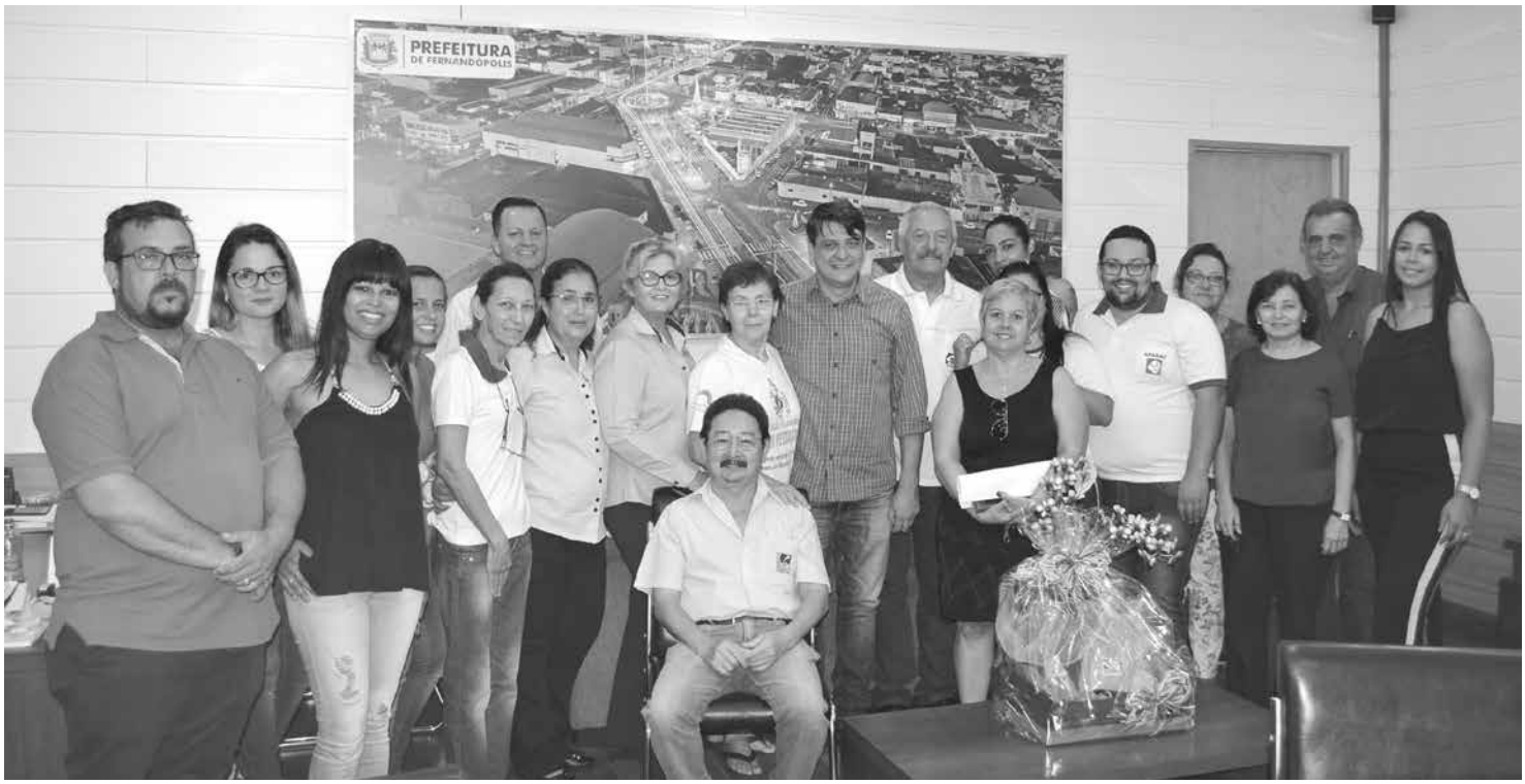
Representantes das instituições em visita à Prefeitura