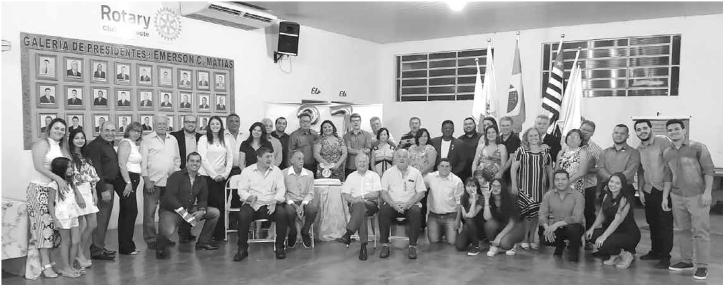
A noite festiva reuniu membros do Rotary, damas da Casa da Amizade, membros do Rotaract e Interact Club