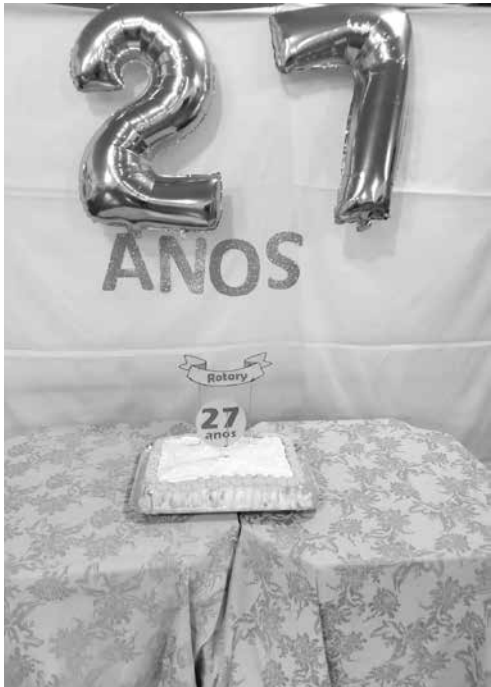
As comemorações marcaram os 27 anos de serviços prestados a comunidade de Ouroeste