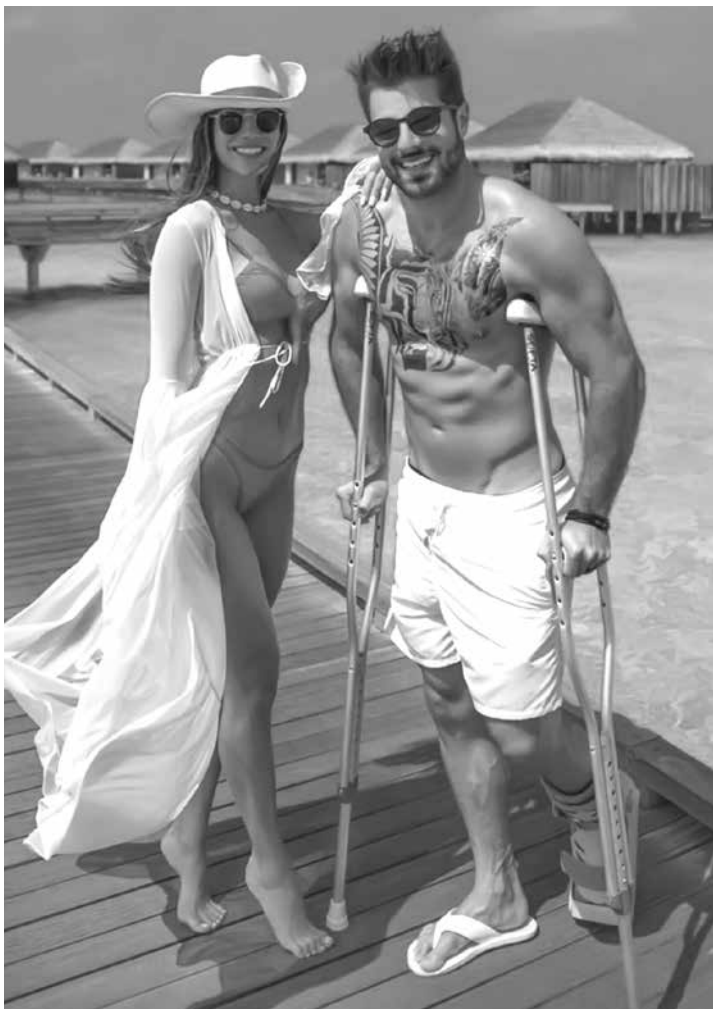
O DJ sofreu um acidente enquanto praticava wakeboard nas Ilhas Maldivas

Alok tem encarado numa boa o acidente que sofreu durante a lua de mel com a mulher, Romana Novais. Nesta sexta-feira, 25, o DJ compartilhou em sua conta de Instagram foto na qual aparece com o pé imobilizado com uma bota ortopédica e se locomovendo com o auxílio de muletas. O músico sofreu um acidente enquanto praticava wakeboard nas Ilhas Maldivas e precisou engessar o membro inferior. “Nem tudo saiu como planejado na lua de mel! Mas tudo bem! Tenho muito mais motivos para sorrir do que para reclamar”, escreveu Alok com bom humor em imagem na qual aparece ao lado da médica. Os fãs do DJ aproveitaram para desejar uma rápida recuperação ao artista. “Melhoras pra você, querido”, disse um. Uma outra seguidora elogiou a beleza de Alok. “Gente esse o homem consegui ser gato até de coletas. Meu Deus..”, disse.