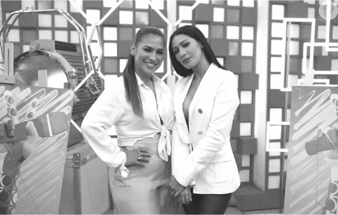
As coleguinhas estão com volta aos palcos prevista para março