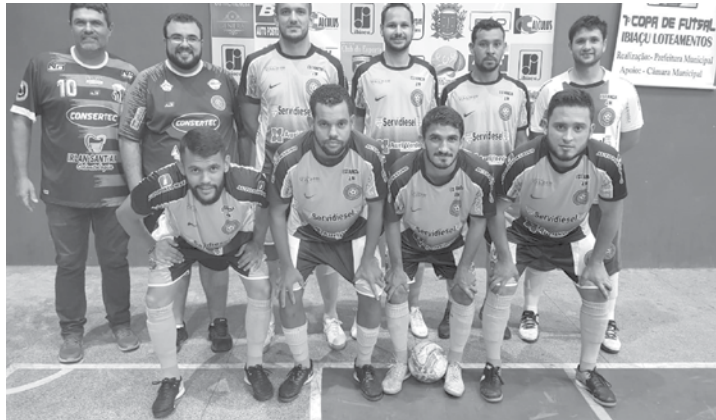
Times do Tanabi e Auriflama

Os jogos semifinais foram realizados nesta última quarta-feira, 06, em dois jogos de arrear. Auriflama chegou à final após vencer bem a equipe do Votuporanga E.C. pelo placar de 6 a 1, já Tanabi chegou a decisão após um jogo épico que terminou empatado em 4 a 4 contra a equipe de Santa Fé do Sul, nas penalidades o goleiro Vinicius garantiu a classificação de sua equipe para mais uma decisão do futsal regional.