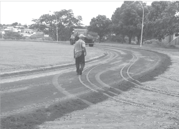
Todas as irregularidades do terreno foram niveladas

precisar trabalhar duro para conquistar novamente a confiança do torcedor. Sábado a Votuporanguense encara o Santo André, às 16h, no estádio Bruno José Daniel, em Santo André.