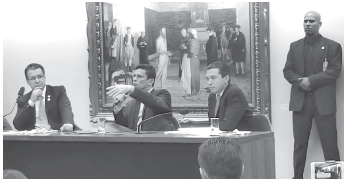
Proposta, que altera 14 leis na área penal, iniciará tramitação pela Câmara dos Deputados

As medidas apresentadas pelo ministro da Justiça buscam combater a corrupção, o crime organizado e crimes violentos.