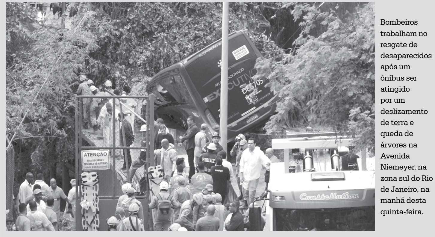
imagem do dia