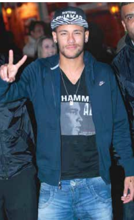
"Precisa dar uma festa de 500 pessoas, ficar no palco com muleta", disparou o apresentador