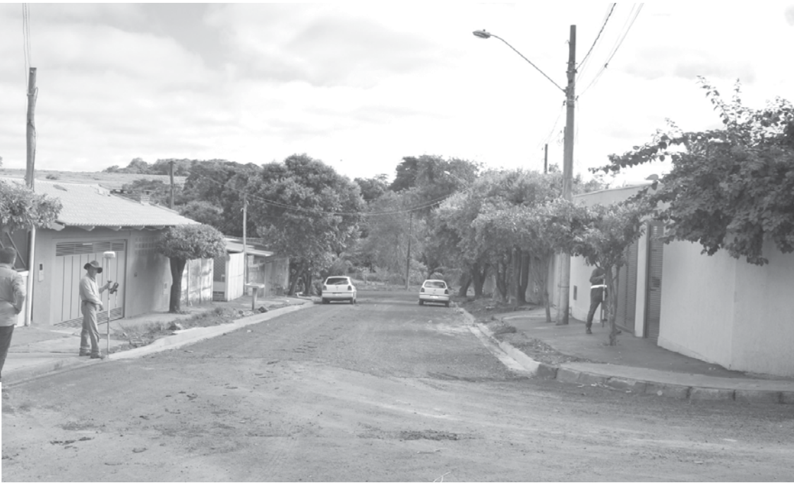
Visitas no Santo Antônio ocorrerão nos dias 12 e 13; já no Jardim Ipanema serão em 13 e 14 de fevereiro

Paulo. No momento em que receberem os cadastrados, os moradores devem ter em mãos os seguintes documentos: • Solteiros: Certidão de nascimento/ RG/ CPF/ CNH; • Casados: Certidão de casamento/ RG/ CPF/ CNH; • Divorciados: Averbação do divórcio / RG/ CPF/ CNH; • Viúvos: Certidão de óbito/ RG/ CPF/ CNH. Documentos do imóvel (lote/ casa): • Proprietários: Contrato de compra/ aquisição do imó-