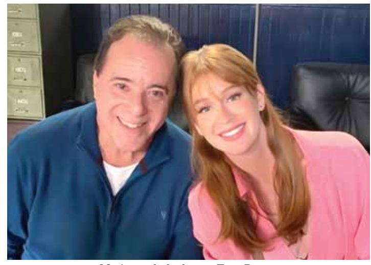
Marina ao lado do ator Tony Ramos

Marina Ruy Barbosa está de volta às gravações da novela “O Sétimo Guardião”. Após suposta crise nervosa ao contracenar com José Loreto e pausa para viajar no Carnaval, a intérprete da bruxinha Luz retornou ao set de filmagem nesta quarta-feira (06) e postou uma foto lado de Tony Ramos. “Por aqui seguimos trabalhando e em boa companhia”, disse ela, ao compartilhar um clique em seu perfil do Instagram. Em dia de tbt (Throwback Thursday), a ruivinha ainda recordou a época em que atuou junto do veterano em “Belíssima”, sucesso de 2005. “Aos 10 anos, e aos 23 anos. Em Belíssima, e em O Sétimo Guardião. Sabina e Nikos, Luz e Olavo. Aprendo tanto com Tony Ramos. Muita coisa mudou, mas a admiração que tenho por ele só aumenta”, acrescentou.