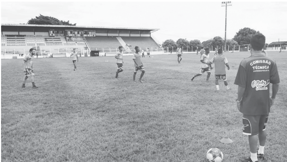
Jogadores da Águia durante treinamento no Cláudio Rodante