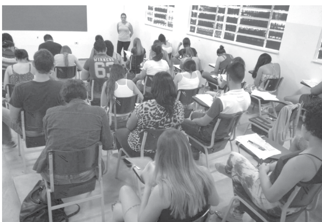
Estudantes de cursos de nível superior podem se inscrever para o processo seletivo

ço, das 8h às 13h. Podem se inscrever os estudantes dos seguintes cursos de nível superior: Administração de empresas, Biomedicina, Ciências Contábeis, Direito, Educação Física, Farmácia, Fisioterapia, Letras, Matemática, Odontologia, Pedagogia e Psicologia.