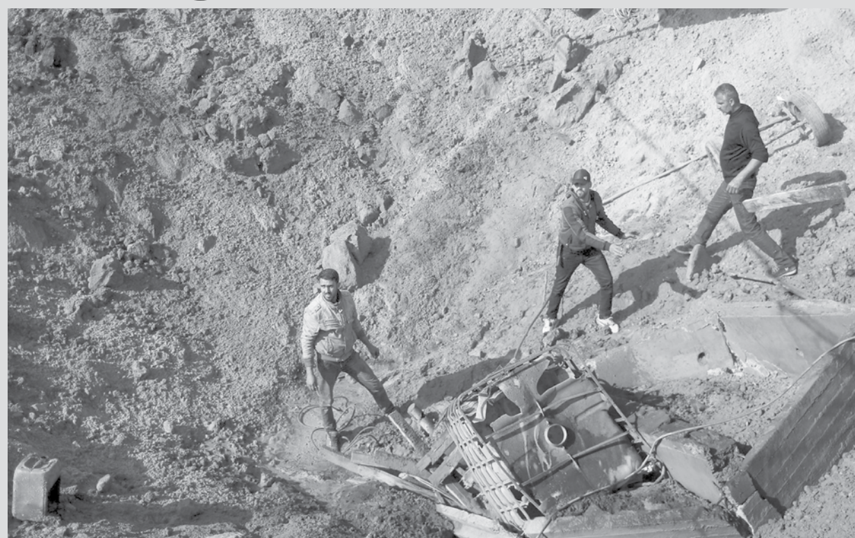
imagem do dia

Palestinos inspecionam o local de ataque aéreo israelense em um porto marítimo em construção, no sul da Faixa de Gaza