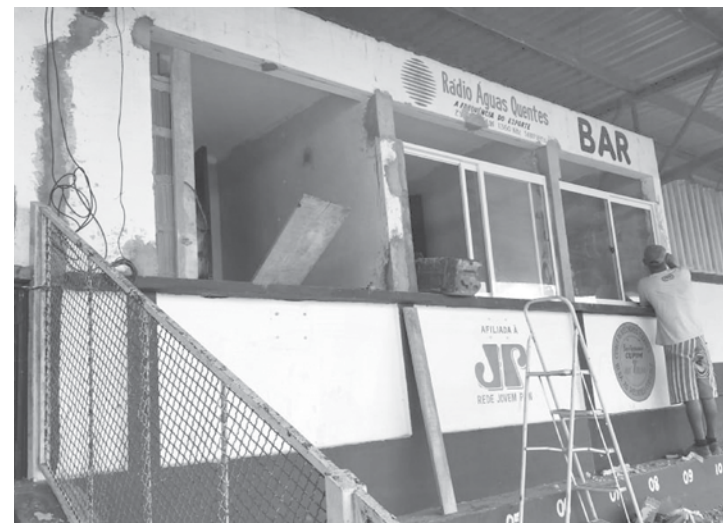
Cabines de imprensa do estádio estão passando por reformas

estão passando por reformas para melhor atender aos jornalistas, radialistas e demais profissionais ligados a diversos órgãos de comunicação, seja ele de Fernandópolis ou de qualquer outra cidade que venham acompanhar as equipes que fazem parte da competição.