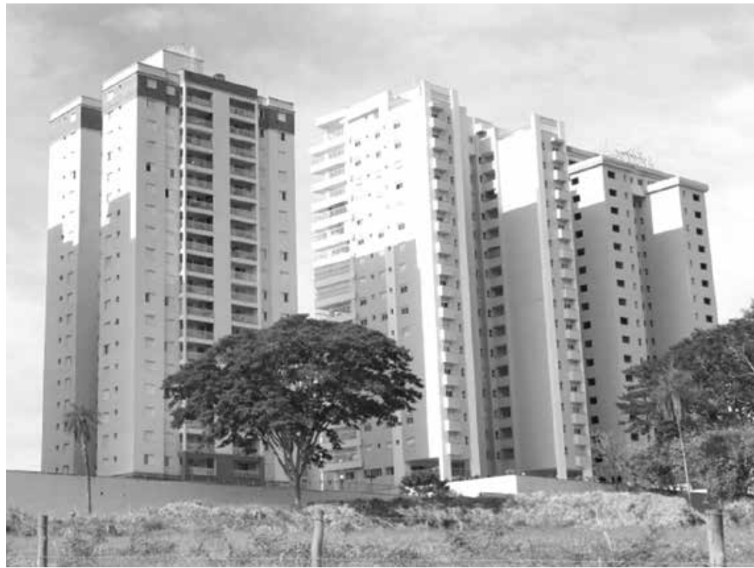
Resultado aponta para uma queda real no preço dos imóveis

O levantamento é feito com base nos anúncios de imóveis em 50 cidades, das quais 16 são capitais. Em fevereiro, nove das 16 capitais pesquisadas tiveram alta nos