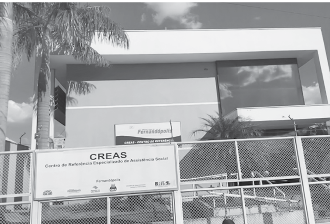
Ambas oficinas ocorrerão semanalmente no CREAS, entre os meses de abril e dezembro de 2019

Atividades ocorrerão semanalmente no CREAS, entre os meses de abril e dezembro