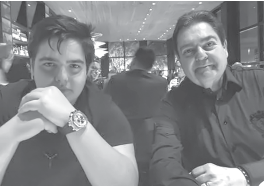
Fausto Silva começou a carreira também adolescente como repórter de uma rádio