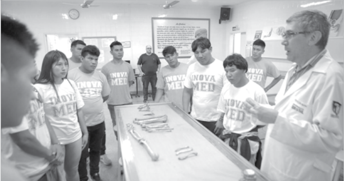
As 12 vagas oferecidas foram preenchidas através de um processo seletivo