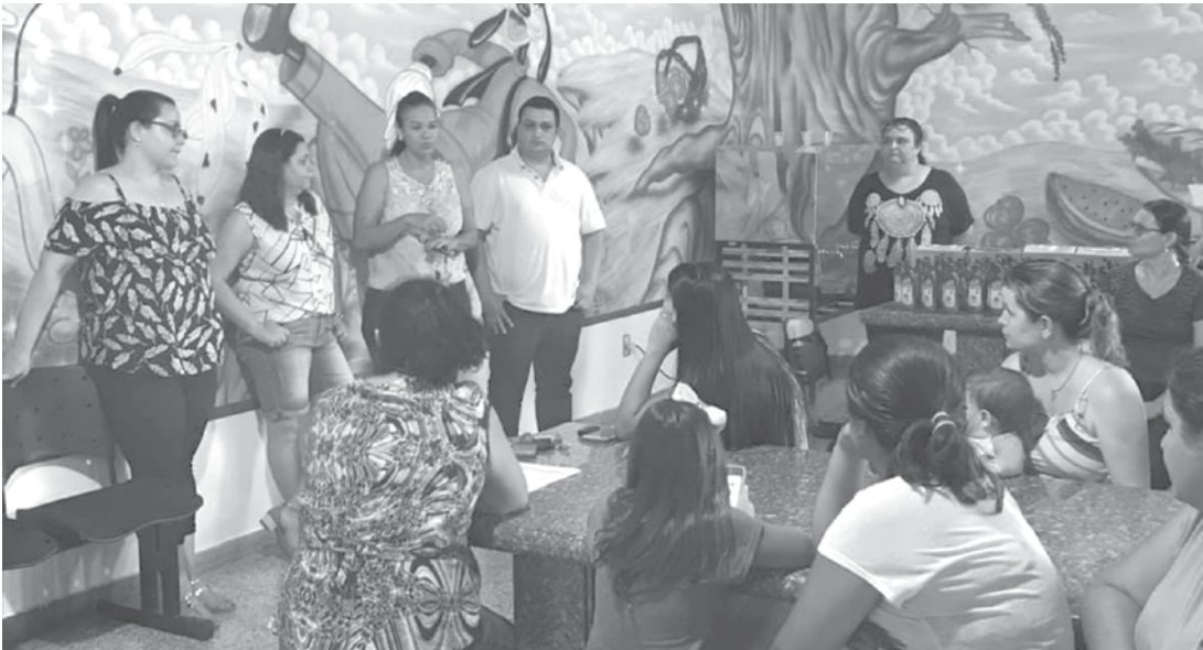
Coordenadoria de Saúde fez a distribuição de repelentes aos alunos matriculados na rede municipal de ensino

Além dessas orientações, a Coordenadoria de Saúde fez a distribuição de repelentes aos alunos