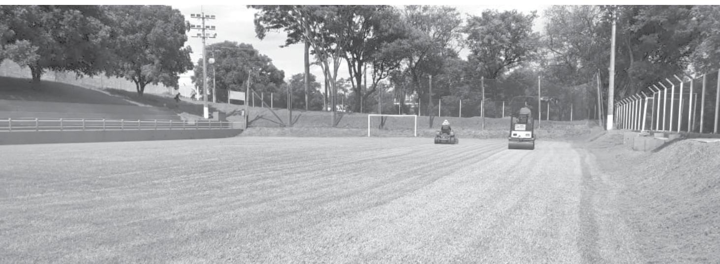
Campo está preparado para receber as equipes competidoras

Campeonato começa com preliminar de atletas do sub-9 e sub-10, às 18h