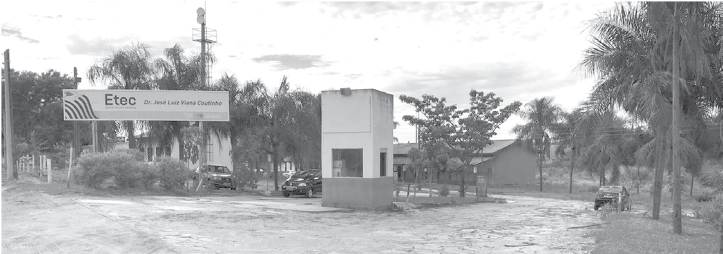
Escola onde o jovem estudava e morava no alojamento em Jales

Em nota, o Centro Paula Souza disse que o aluno passou mal à noite no alojamento. O centro disse que o Samu foi acionado e a família, avisada.