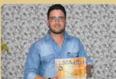
Ouomix - Destaque no segmento de Concreto e Argamassa