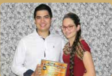
Audácia Kids - Loja de Roupas Infantis Destaque