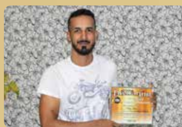
Plug Som - Som e Iluminação Profissional Destaque