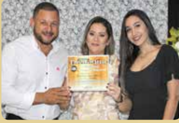
Sorveteria Doce Sabor - Sorveteria Destaque