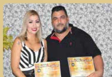
Brother's Hamburgueria - Destaque no segmento de Lanches e Hamburgueria