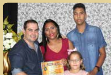
Ourocell - Loja de Celulares e Assistência Técnica Destaque