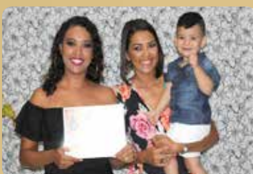
Ateliê das Unhas "Taty e Jor" - Manicure, Pedicure e Unhas de Porcelana Destaque