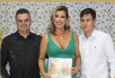
Gislaine Romeira Salon - Salão de Beleza Destaque