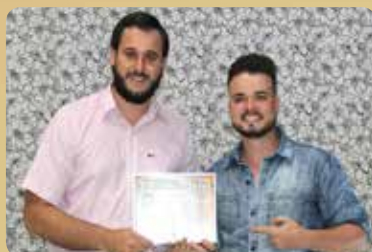
Agroeste - Loja Veterinária e Pet Shop Destaque