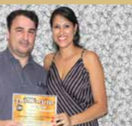
Sponga Corretora de Seguros - Corretora de Seguros Destaque