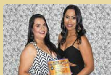
Ótica Santa Luzia - Ótica Destaque