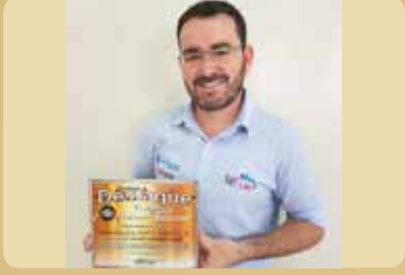
Laboratório João Paulo II Grupo MDLab - Laboratório de Análises Clínicas Destaque