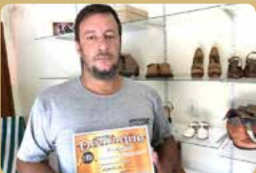
Sapataria JC - Sapataria Destaque