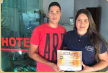
Hotel Oliveira - Destaque no segmento de Hotelaria