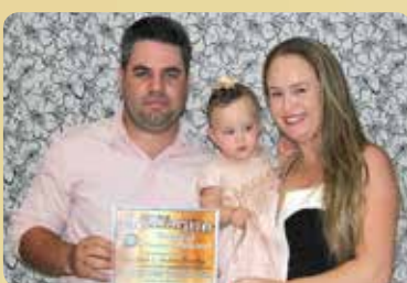
Agroforte & Fashion Country - Loja de Produtos Agropecuários e Roupas Country Destaque