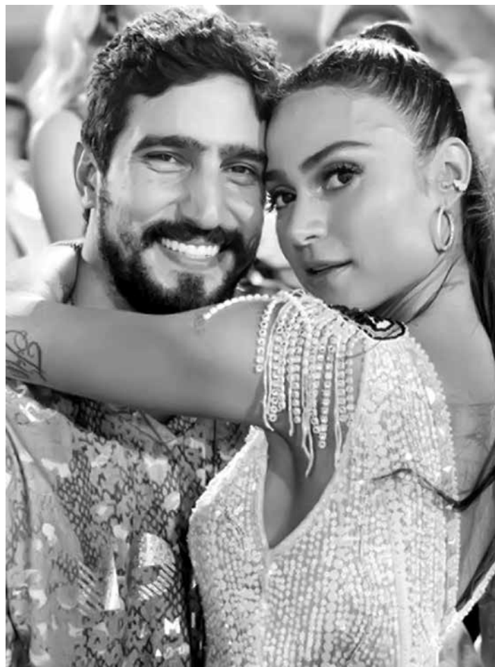
Thaila Ayala ainda não pensa em filhos com Renato Góes