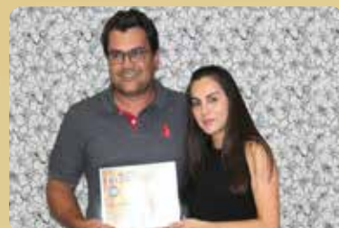
Sgotti Materiais para Construção - Destaque no segmento de Materiais para Construção