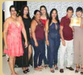
Lavanderia Ouroeste - Destaque no segmento de Lava