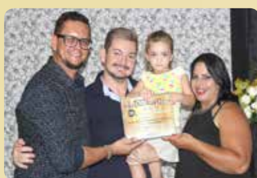
Varanda's Restaurante e Pizzaria - Destaque no segmento de Delivery