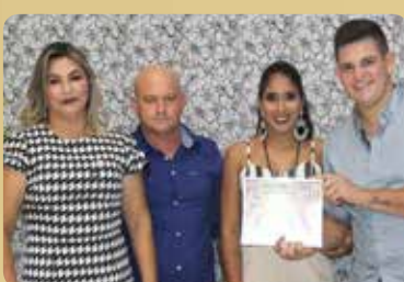
Rei da Pizza - Delivery e Salão - Pizzaria Destaque