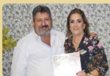
Restaurante Peixão - Destaque no segmento de Fogão à Lenha