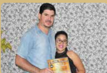
Espaço Masculino "Eder Silva" - Destaque no segmento de Corte Masculino e Barbearia