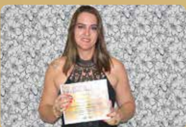
Variedades.com - Loja de Variedades Destaque