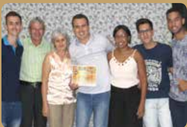
Auto Elétrico Trevo - Auto Elétrico Destaque