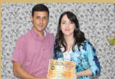
Ouro Tintas - Loja de Tintas Destaque