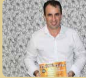
Supermercado Maticolli - Destaque no Segmento de Super