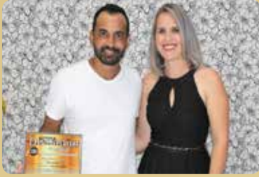
Bematec - Destaque no segmento de Segurança Eletrônica