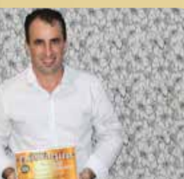
Supermercado Maticolli - Destaque no segmento de Supermercado