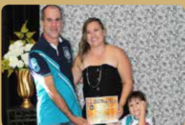
Veiga Motos - Oficina de Motos