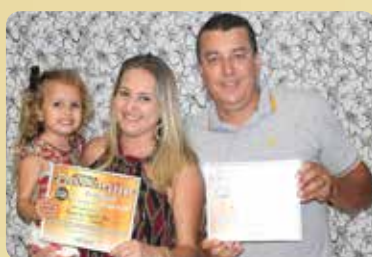
Casarão Espeto Bar - Bar e Lanchonete e Choperia Destaque