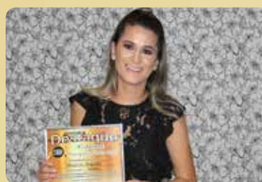
Point do Salgado - Pastelaria Destaque