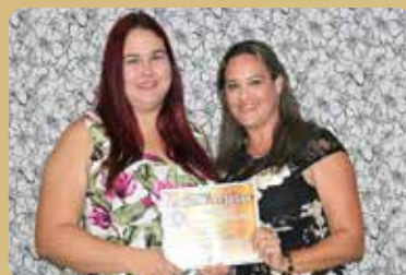
Ciberpoint - Provedor de Internet Destaque