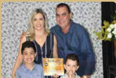
Solda Leve - Destaque no segmento de Comércio de Ferramentas e EPIS