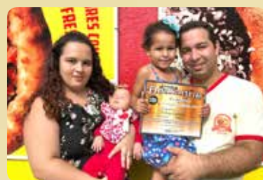
Delícia Esfihas - Destaque no segmento de Esfihas