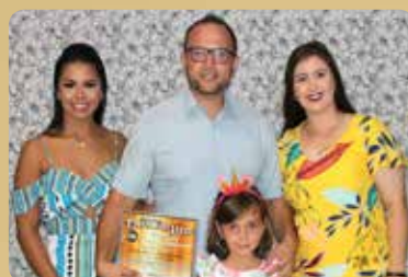
Altas Horas Conveniência - Loja de Conveniência Destaque