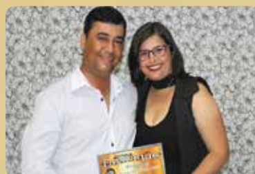
Charles Comunicações - Destaque no segmento de Propagandas em Geral