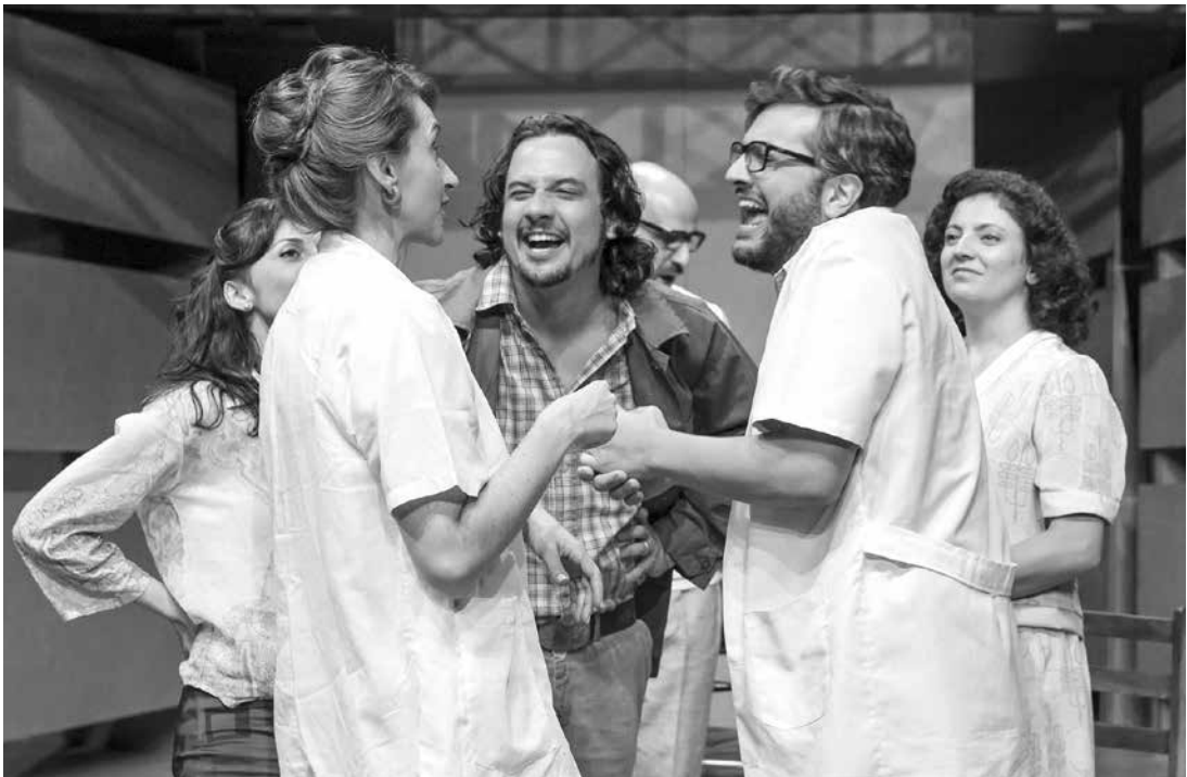
Na Cia Elevador, a maioria dos atores e o diretor são professores