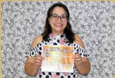
Limpoeste - Destaque no segmento de Produtos de Limpeza, Higiene e Tratamento de Piscinas