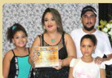
Isa Sabores / Cozinha Delivery - Destaque no segmento de Serviços de Buffet