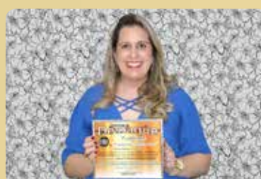
Cartório de Registro Civil das Pessoas Naturais, Interdições, Tutelas e Tabelionato de Notas da Sede da Comarca de Ouroeste - Empresa Profissional nos serviços prestados