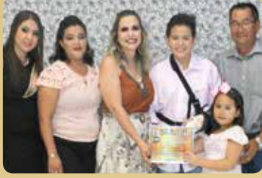
Edu Variedades - Loja de Variedades e Presentes Destaque