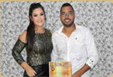
GSM - Ar-Condicionado - Destaque no segmento de Manutenção em Ar-Condicionado