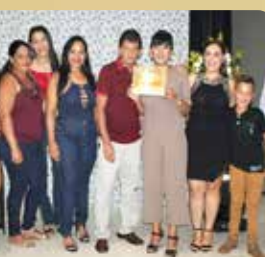
Lavanderia Ouroeste - Destaque no segmento de Lavanderia