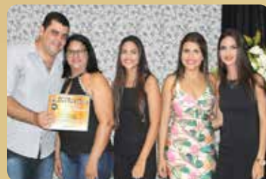
L & L Calçados - Loja de Calçados Destaque