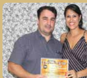
Araponga Corretora de Seguros - Corretora de Seguros Destaque