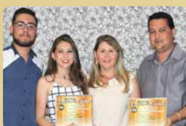
Semar Foto - Stúdio Fotográfico e Comunicação Visual Destaque