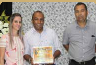
Funerária Nova Aliança - Destaque no segmento de Serviços e Planos Funerários