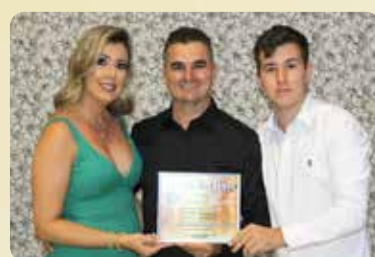
CB PM Romeira - Policial Militar Destaque