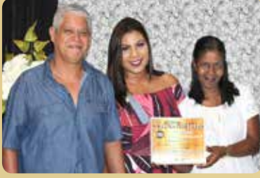
Mini-Mercado e Serv Festas São Lourenço - Serv Festas Destaque