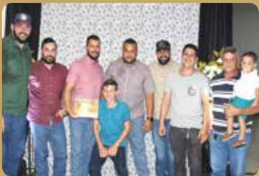
New Age - Destaque no segmento de Reforma, Manutenção Preventiva e Peças para Máquinas Agrícolas