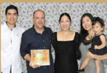
Móveis Pinheiro - Destaque no segmento de Móveis e Eletrodomésticos