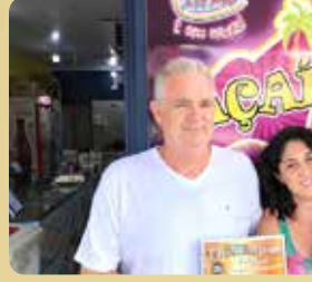
Sorveteria Ice Mel - Melhor Açai