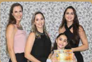
Corpus - Instituto de Terapias Integrado - Clínica de Estética Destaque