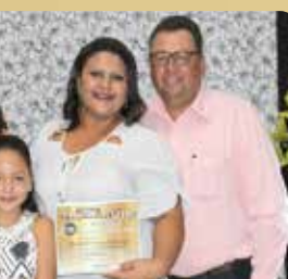
Locação Industrial - Destaque no segmento de Locação de Caminhão Munck