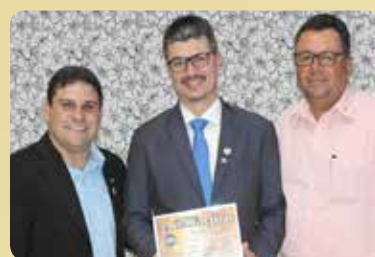
Rotary Club de Ouroeste - Entidade prestadora de Serviços Sociais Destaque