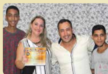
Sherman Som e Acessórios - Destaque no segmento de Som e Acessórios para Carros