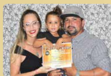
Cristal Car - Lava-Jato Destaque