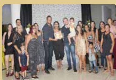
Varanda's Restaurante e Pizzaria - Restaurante Destaque