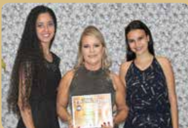
Mundial Fashion - Boutique Destaque