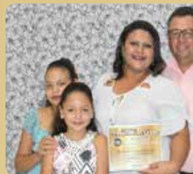
Minaslocal Locação Industrial - Des segmento de Locação de Caminhã