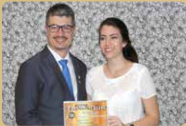
Conexão.com - Loja de Informática Destaque