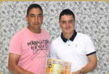
Ferreira Gás e Água - Revendedor de Gás e Água Destaque