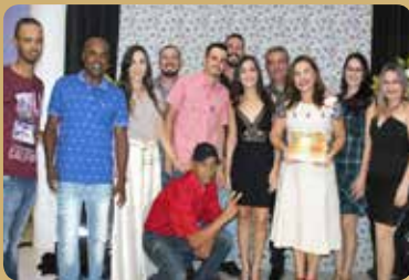
Auto Posto Ipiranga - Posto de Combustível Destaque