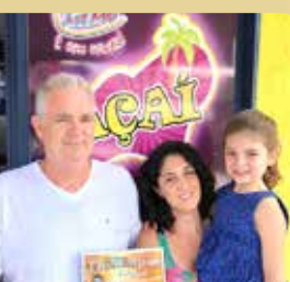
Sorveteria Ice Mel - Melhor Açai