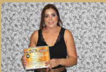
Mistura Fina - Loja de Roupas em Geral Destaque