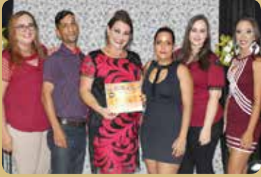
Hot Dog D'Alini - Destaque no segmento de Cachorro Quente