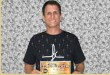
Ouro Verde - Destaque no segmento de Paisagismo