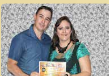
Glamour Moda Íntima - Loja de Lingerie Destaque