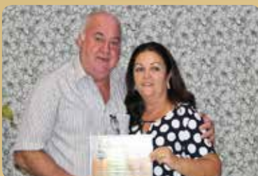
Escritório Argus - Despachante e Contabilidade Destaque