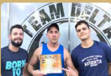
Delta Fitness - Academia de Musculação Destaque