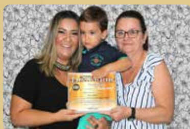
Maritek - Destaque no segmento de Decorações para festas em geral