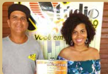
Rádio Stúdio FM 87,9 - Imprensa Falada Destaque