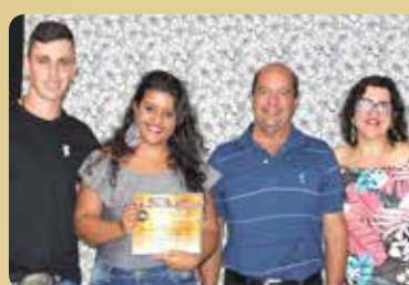
Sorveteria Branka do Neve - Destaque no segmento de Salgados e Sucos