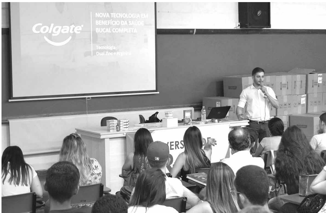
Evento vem sendo realizado, anualmente, na Universidade Brasil